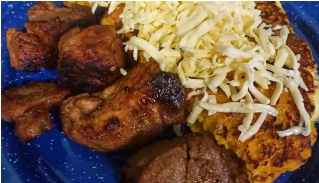
Con sabor a llano guariqueno comida y bebida