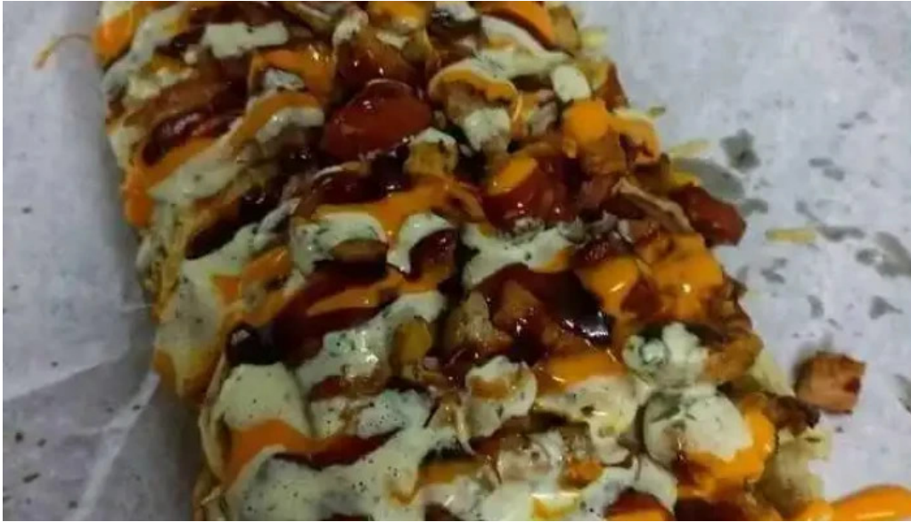
Con sabor a llano guariqueno del propietario