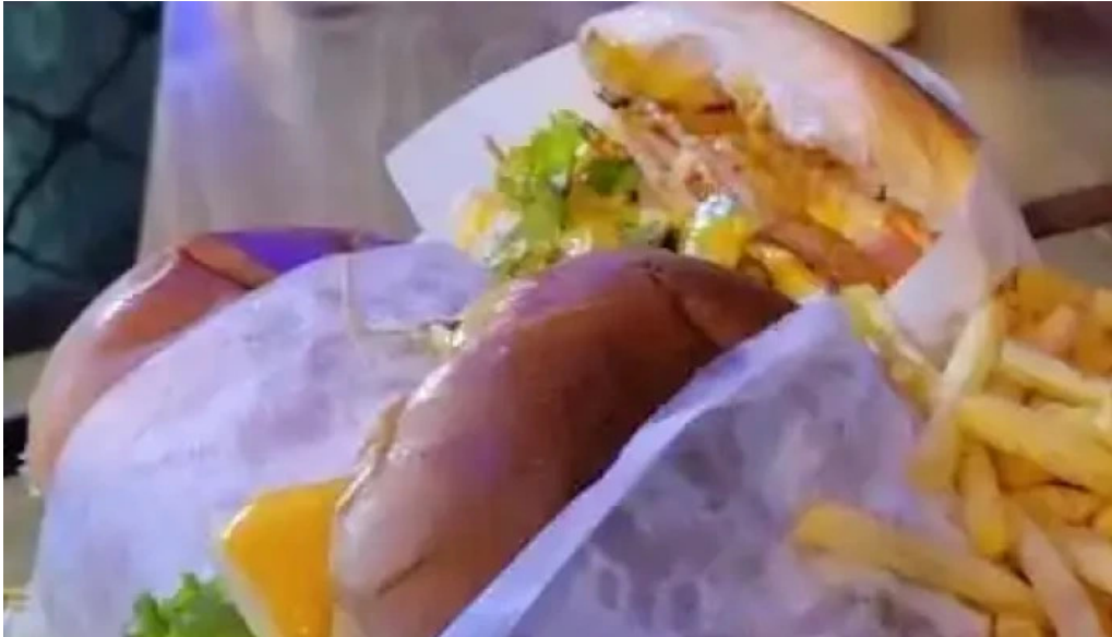
Con sabor a llano guariqueno videos