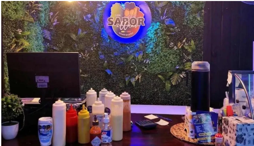
Con sabor a llano guariqueno ambiente