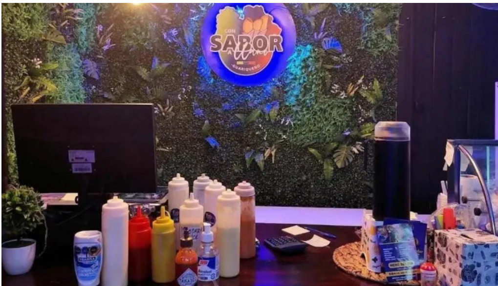
Con sabor a llano guariqueno todas