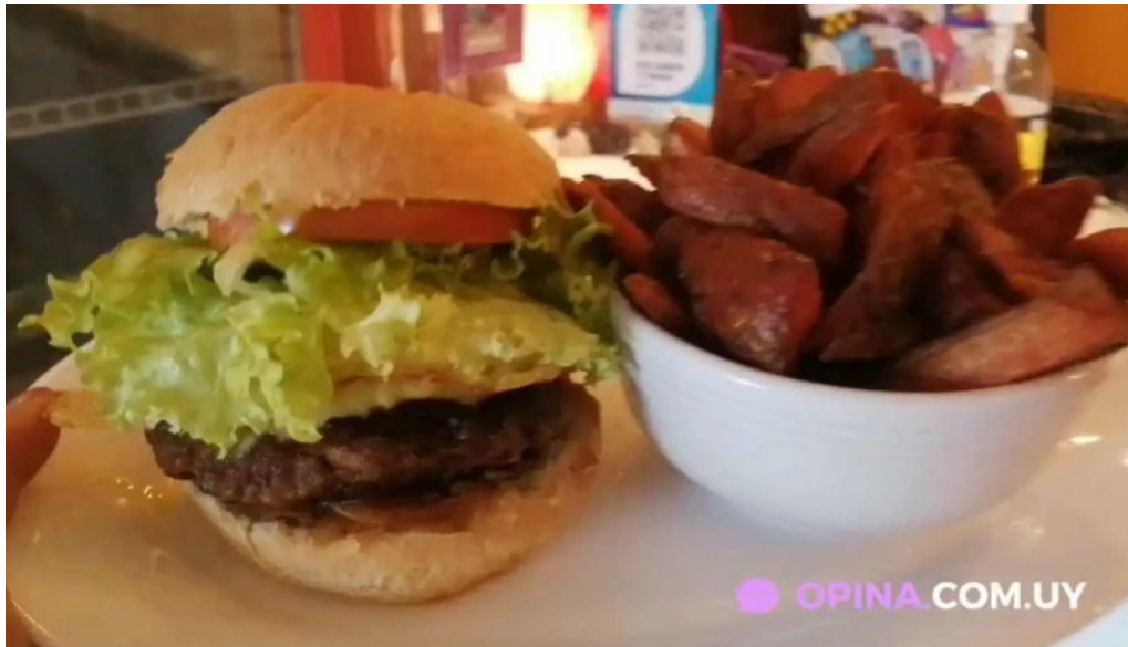
Amorcito sabores vegetarianos videos