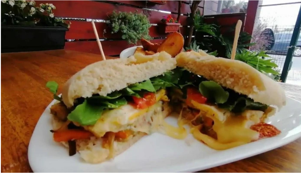
Amorcito sabores vegetarianos sandwich de pollo