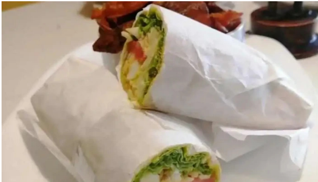
Amorcito sabores vegetarianos comida y bebida