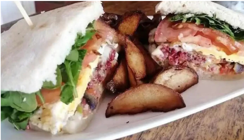
Amorcito sabores vegetarianos sandwich blt