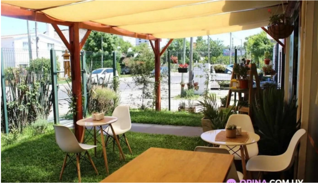
Amorcito sabores vegetarianos maldonado