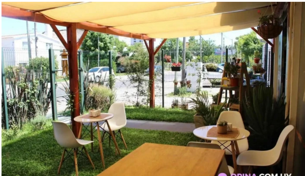
Amorcito sabores vegetarianos todas