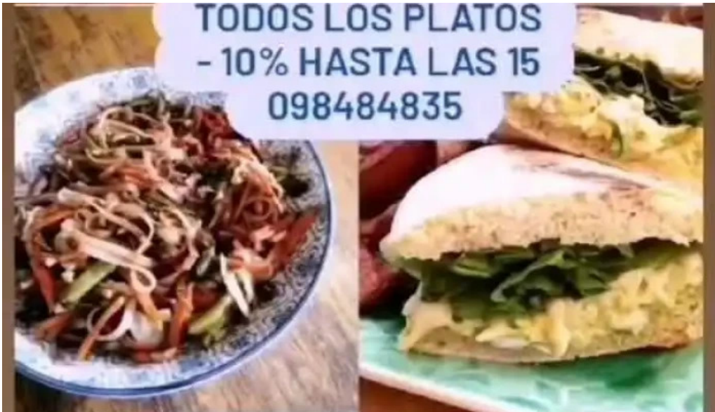
Amorcito sabores vegetarianos del propietario