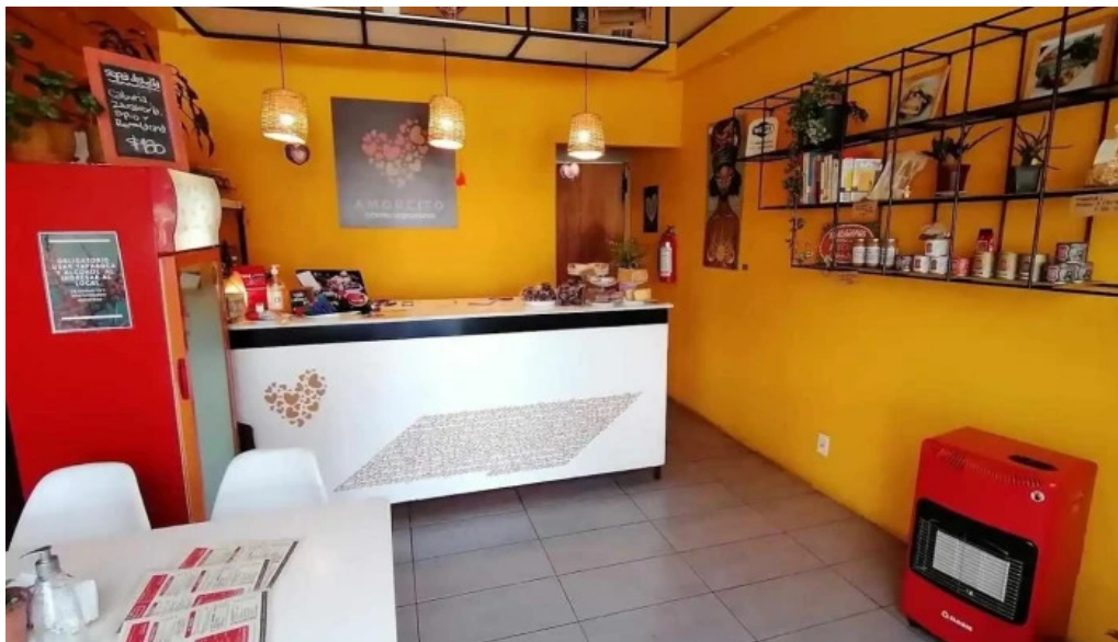
Amorcito sabores vegetarianos ambiente