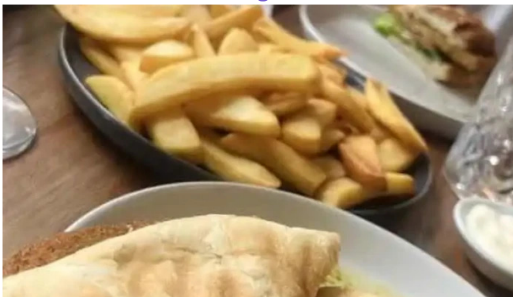
Jucylucy lucy garden todas