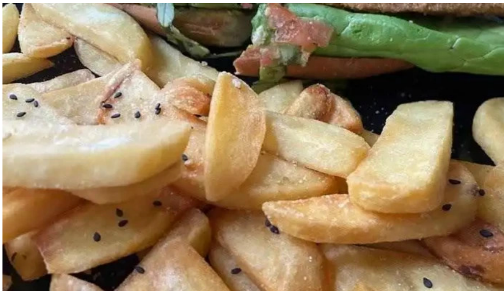
Jucylucy lucy garden comida y bebida