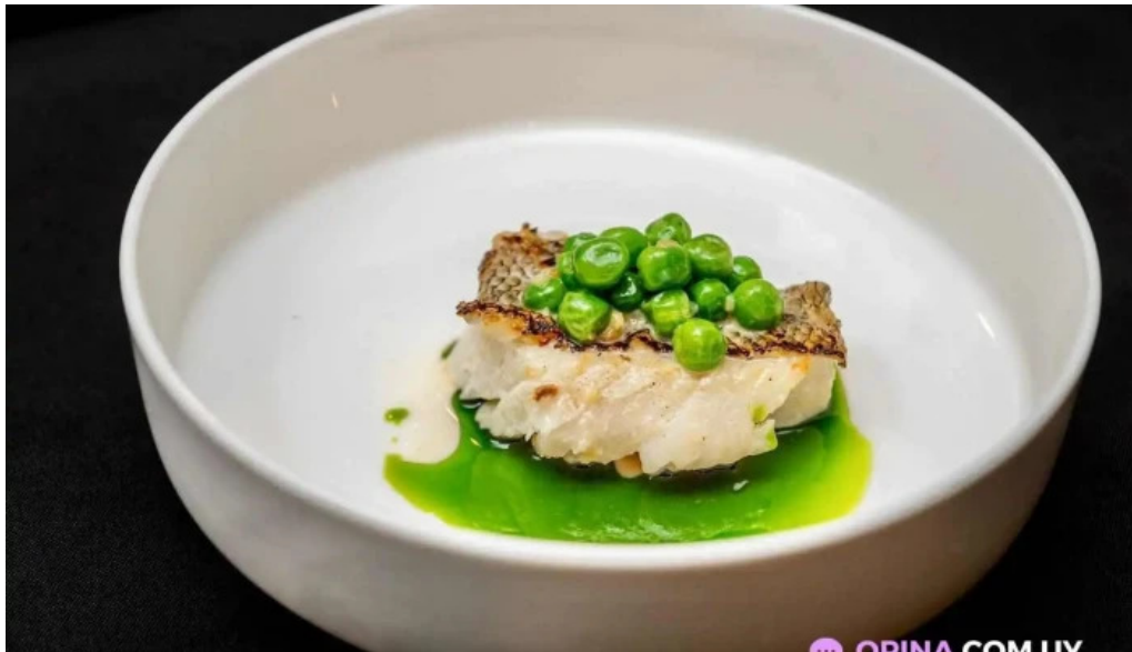
Pistatxofusion comida y bebida