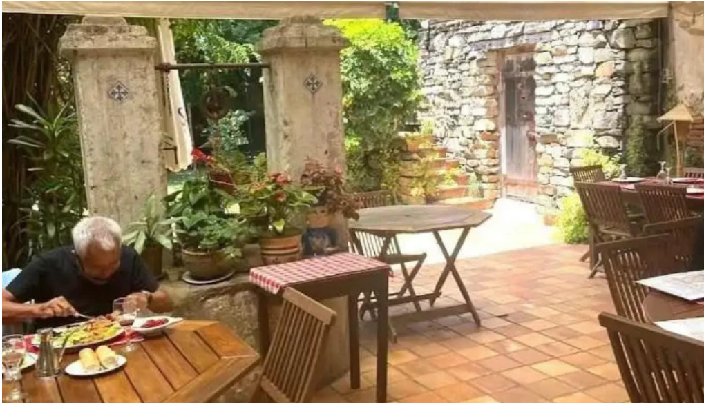
Taberna patxi todas