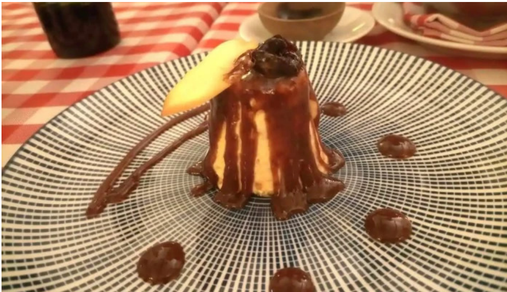
Taberna patxi comida y bebida