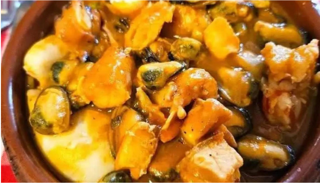
Taberna patxi gambas al ajillo