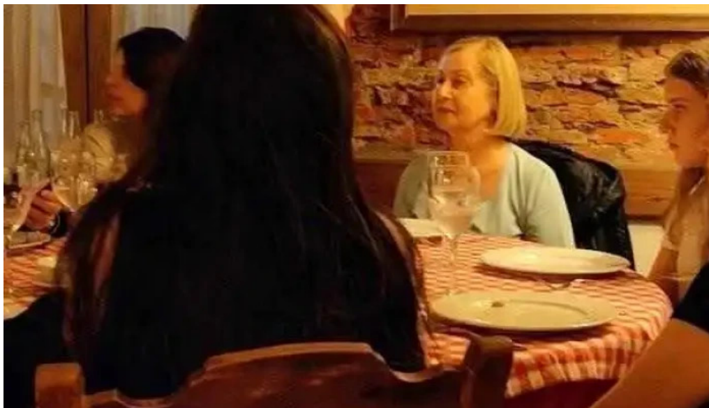
Taberna patxi videos