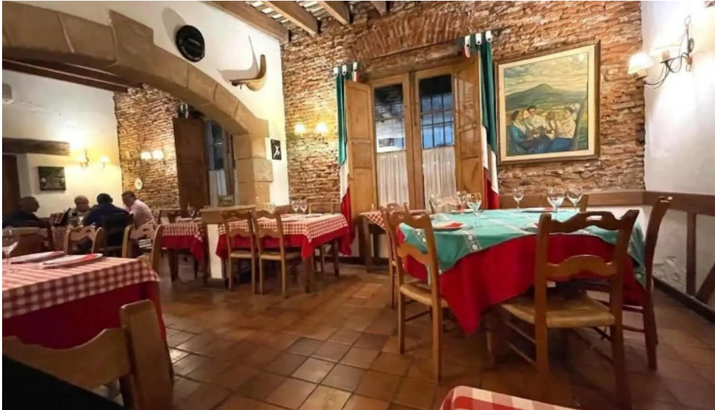
Taberna patxi ambiente