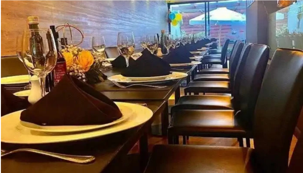
Uruguay natural parrilla gourmet todas