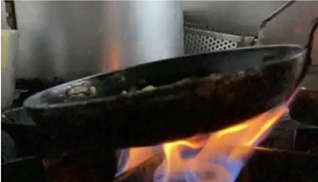
Uruguay natural parrilla gourmet del propietario