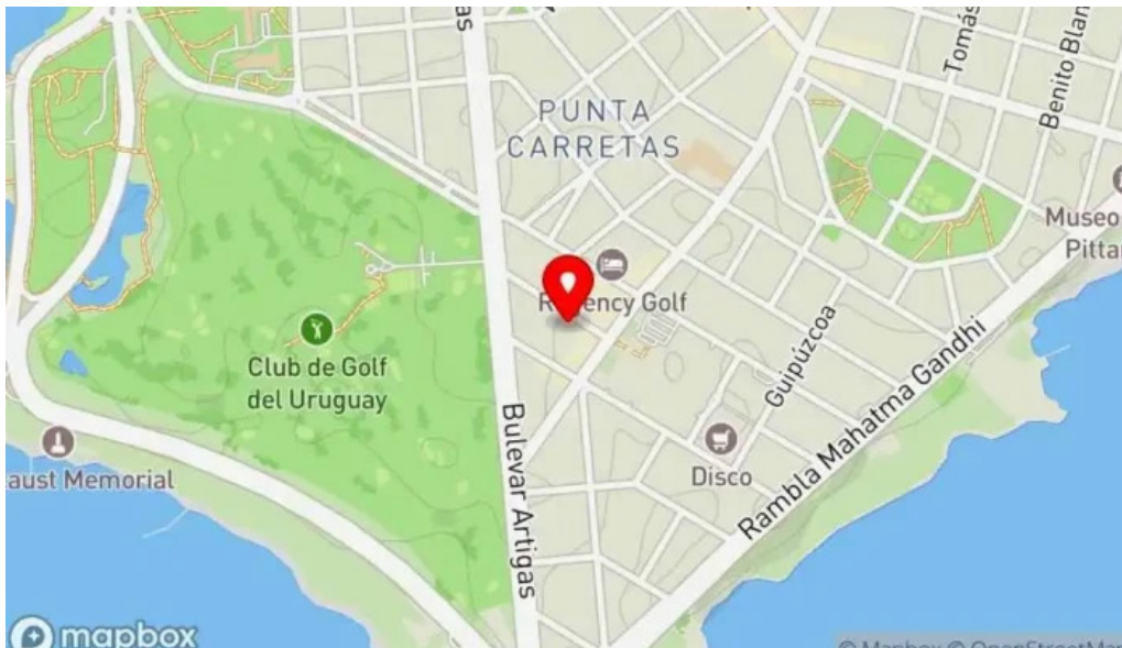
Uruguay natural parrilla gourmet mapa