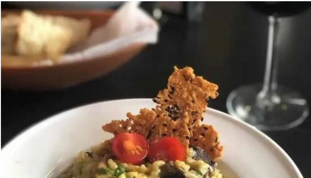
Uruguay natural parrilla gourmet risotto