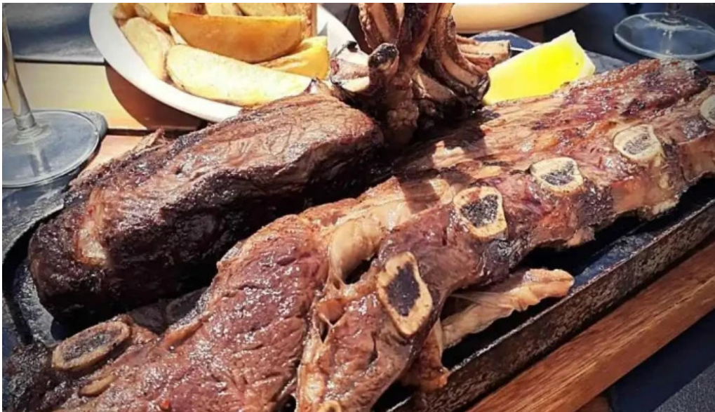
Uruguay natural parrilla gourmet churrasco