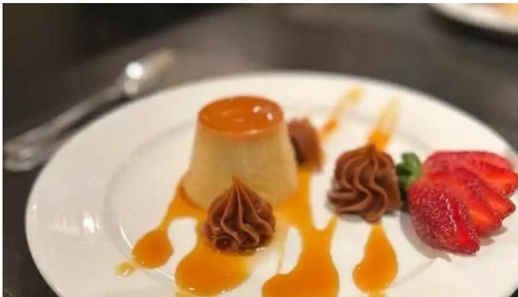
Uruguay natural parrilla gourmet flan