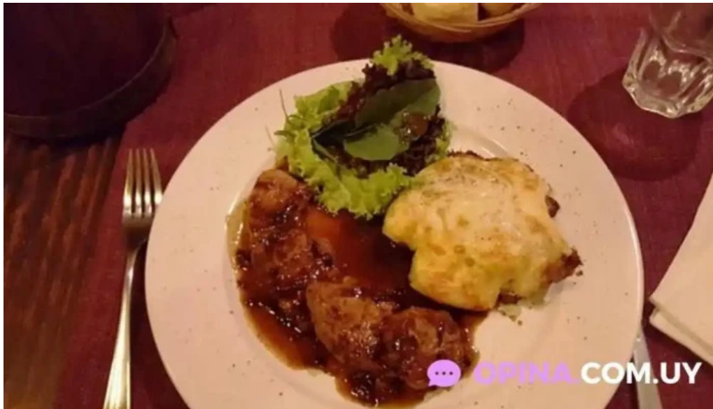
Lajau comida y bebida