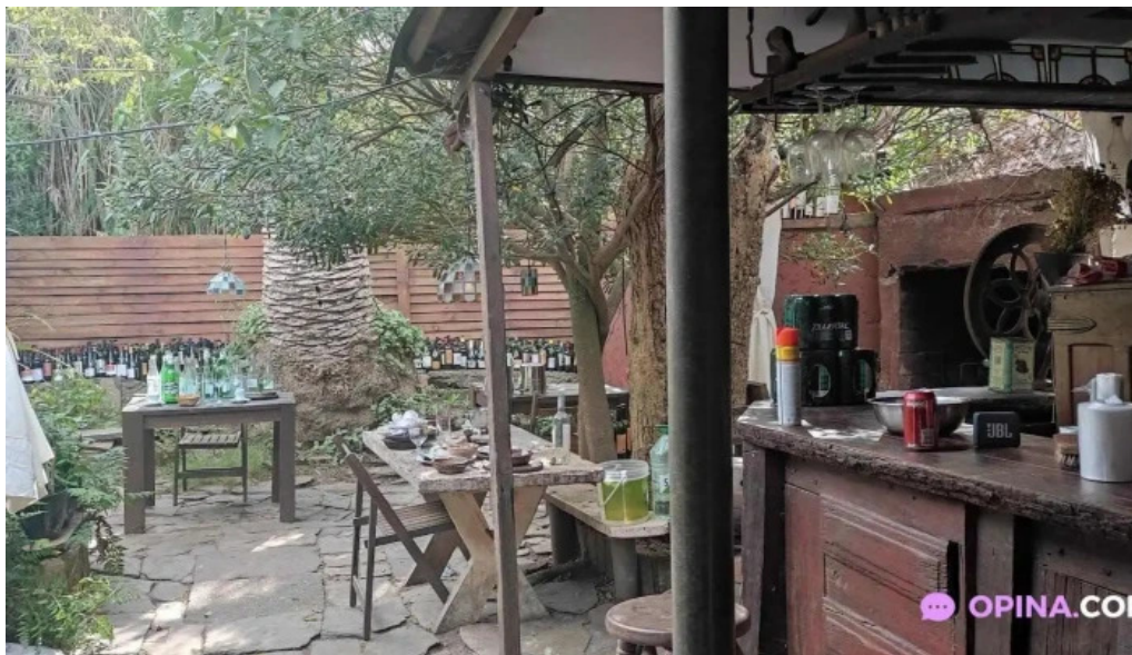
Lajau la pedrera