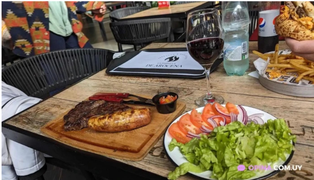
La parrilla de arocena comida y bebida