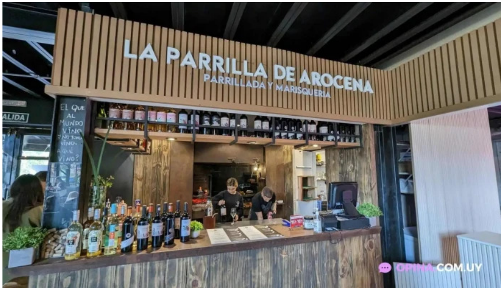
La parrilla de arocena todas