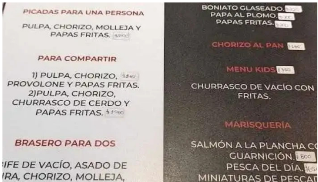
La parrilla de arocena menu