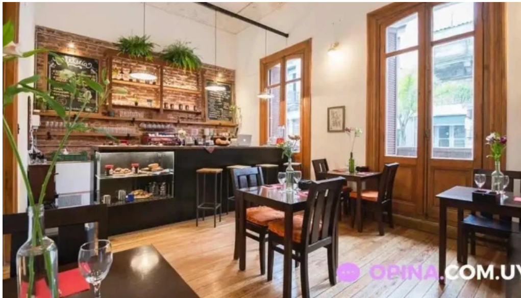
La fonda ambiente