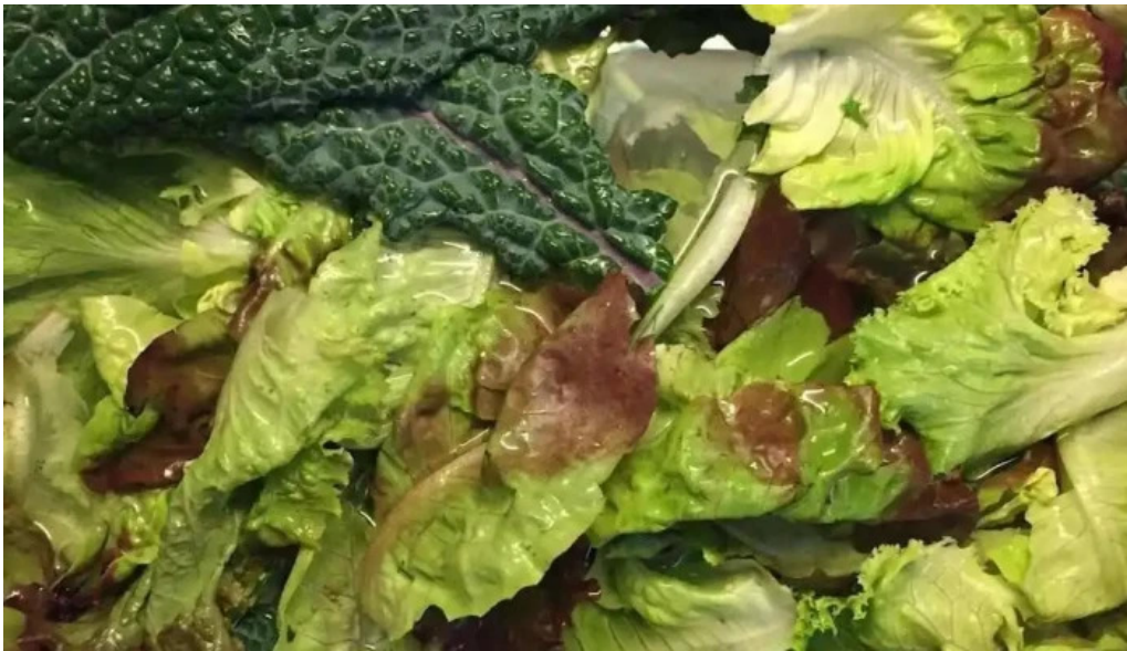
La fonda del propietario