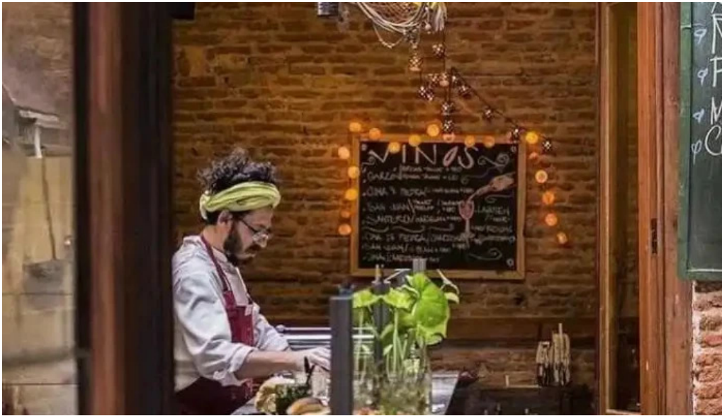
La fonda todas