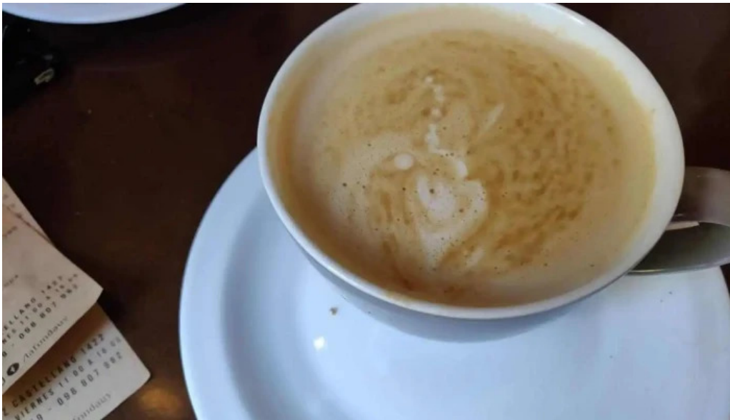
La fonda capuchino