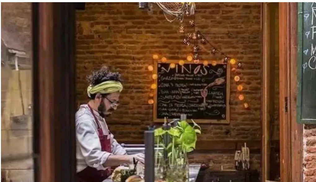
La fonda montevideo