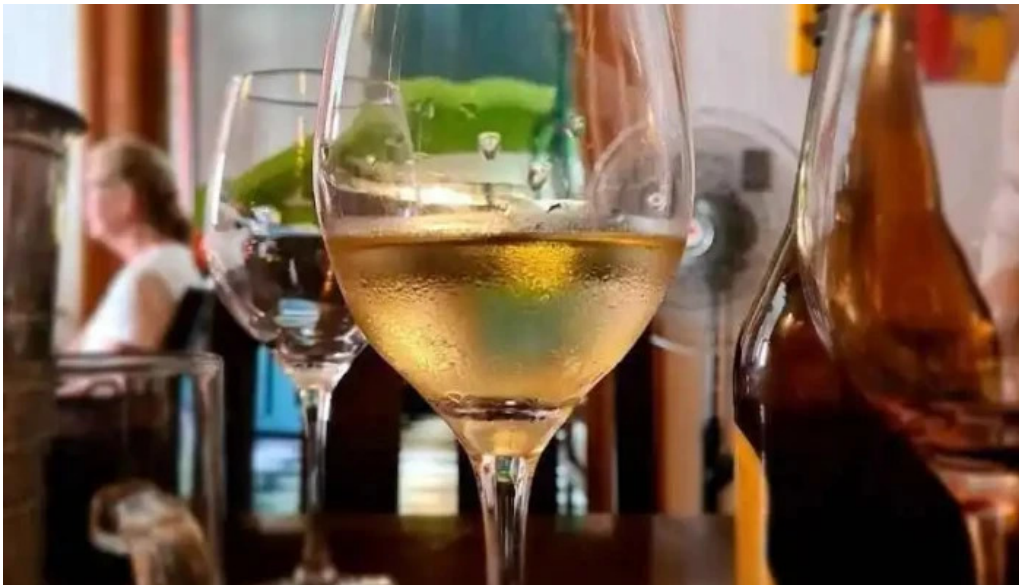
La fonda vino