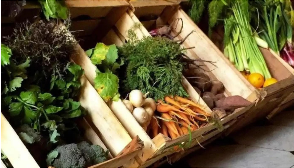
La fonda comida y bebida