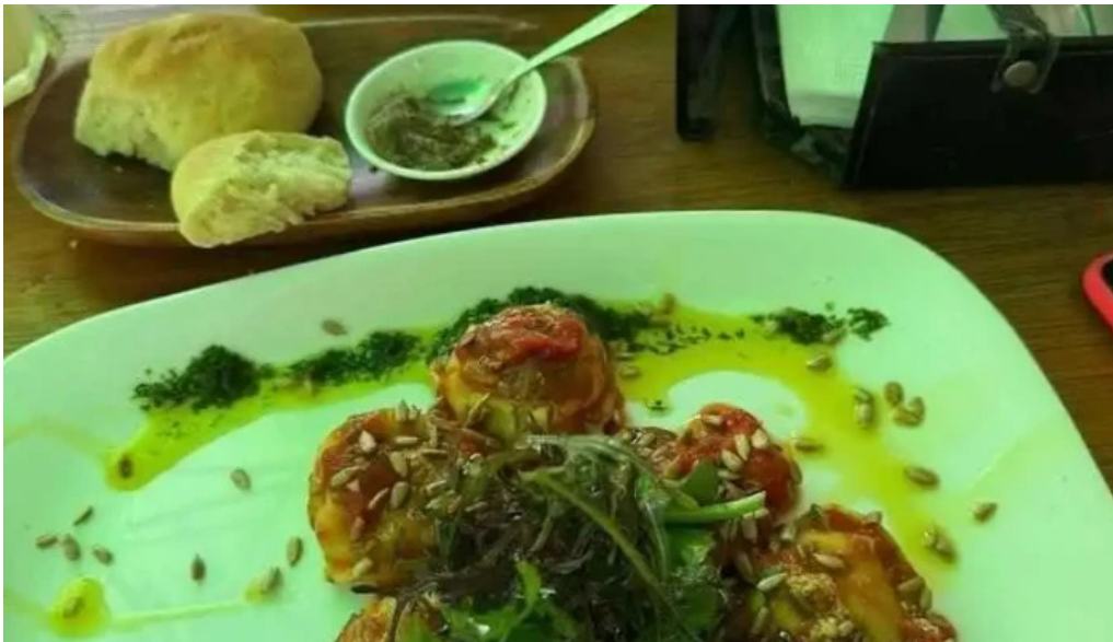
La fonda mas recientes