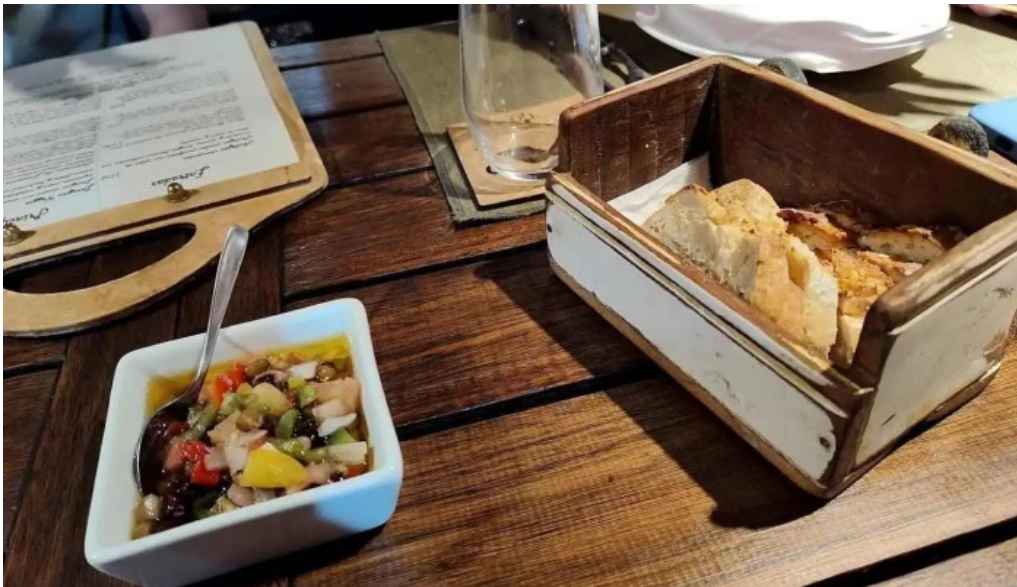
El tio bistro vino