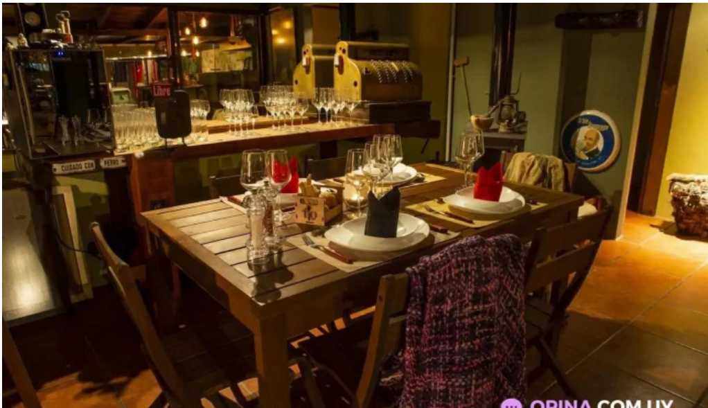
El tio bistro todas