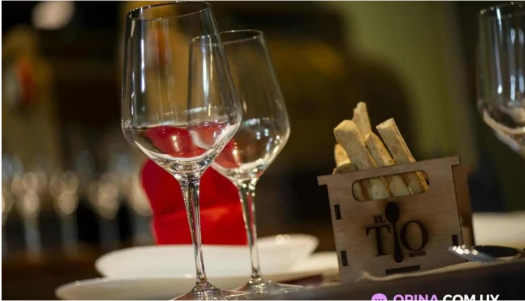
El tio bistro del propietario