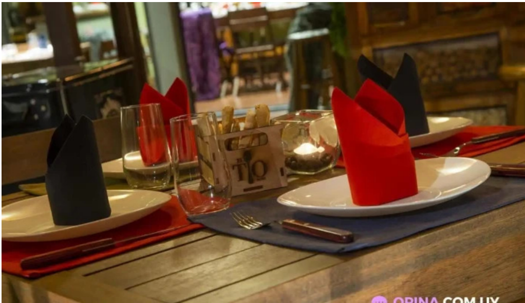
El tio bistro comida y bebida