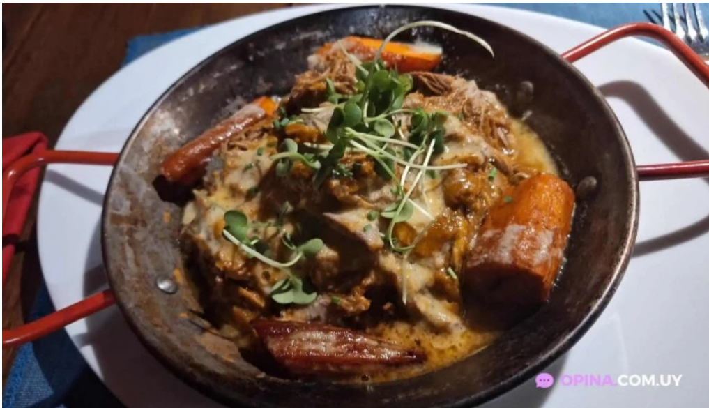
El tio bistro mas recientes