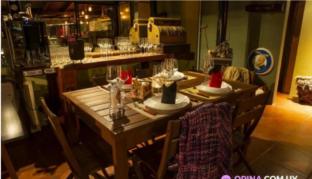
El tio bistro montevideo