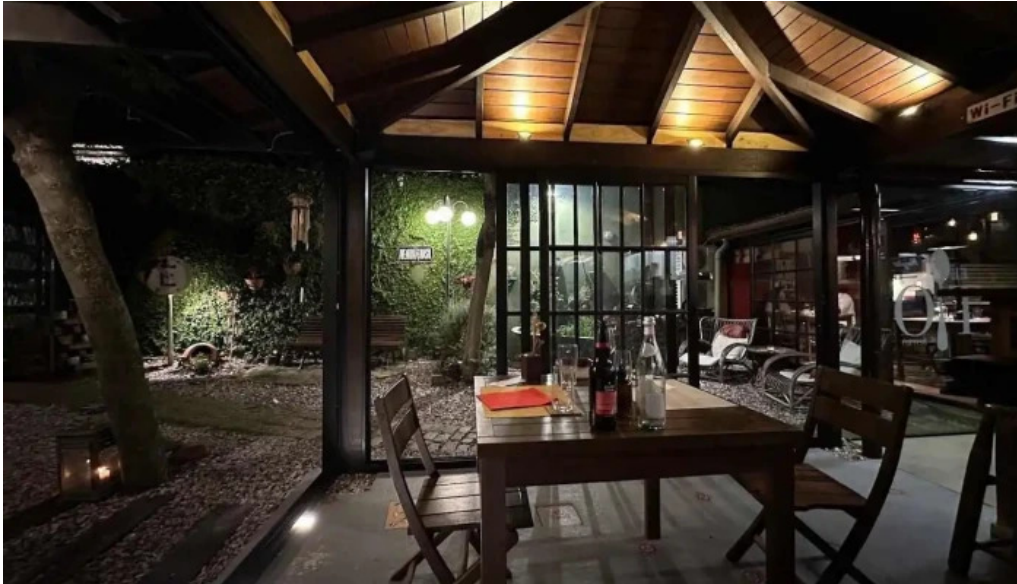
El tio bistro ambiente