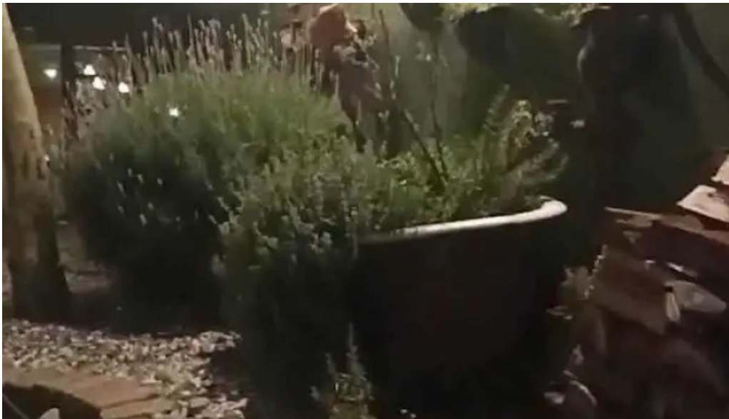
El tio bistro videos