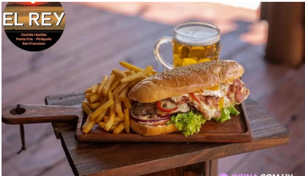
El rey de las hola comidas rapidas comida y bebida