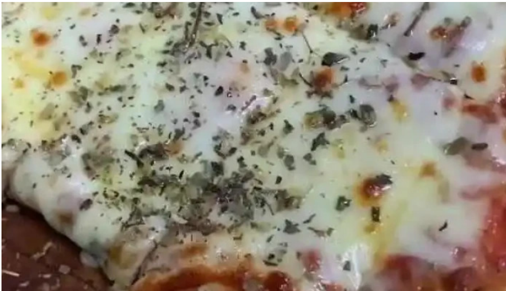
El rey de las hola comidas rapidas del propietario