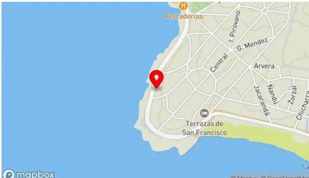
El rey de las hola comidas rapidas mapa