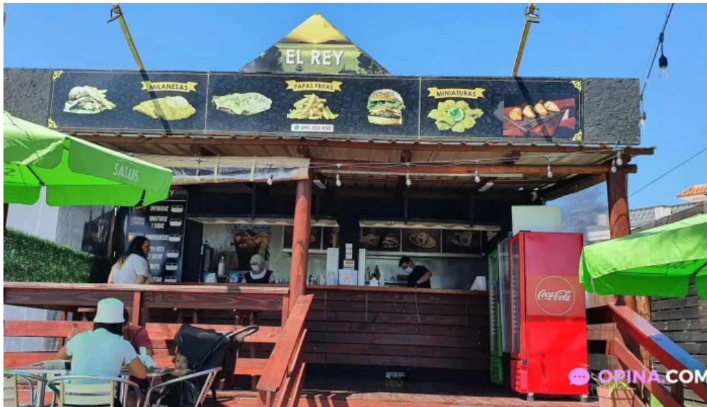
El rey de las hola comidas rapidas todas