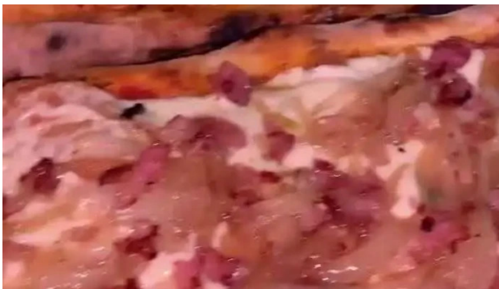
El rey de las hola comidas rapidas videos