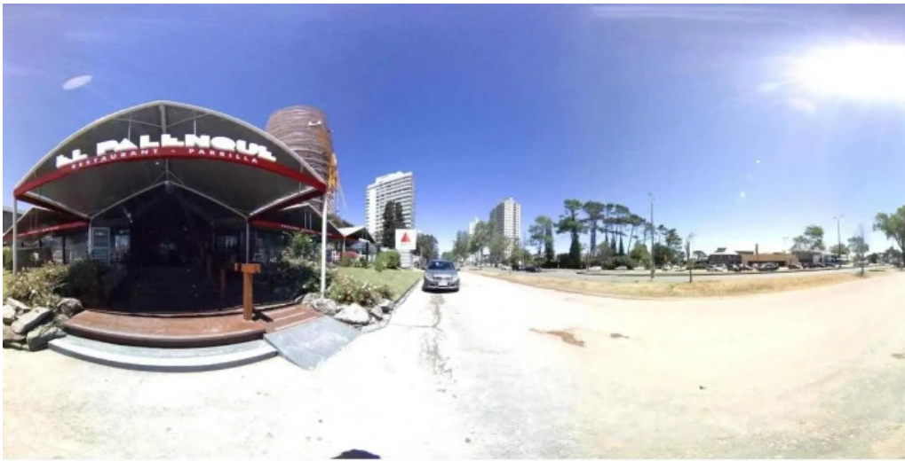
El palenque street view y 360