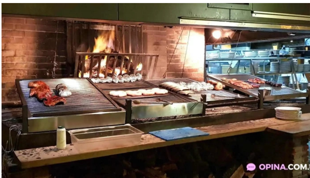
El palenque ambiente