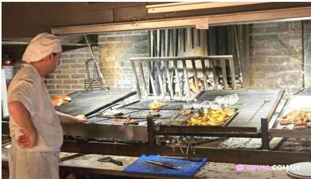
El palenque mas recientes