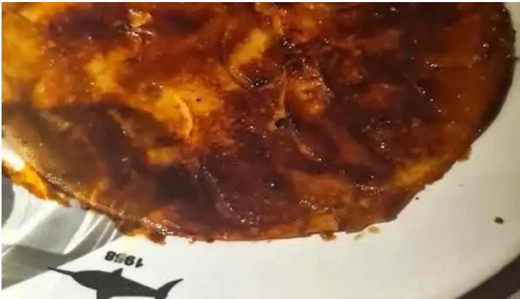
El palenque tarta de manzana