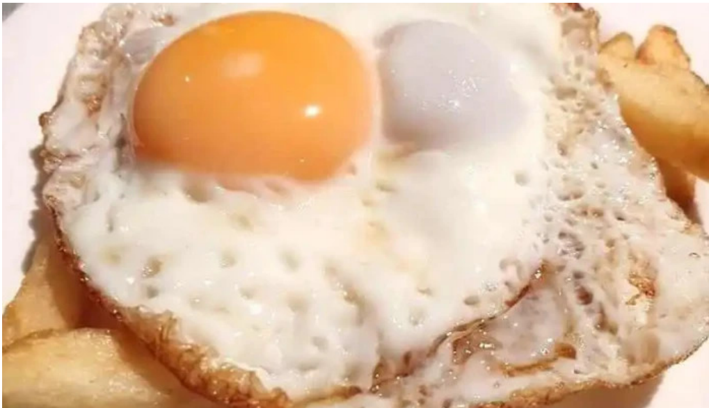
El palenque huevo frito