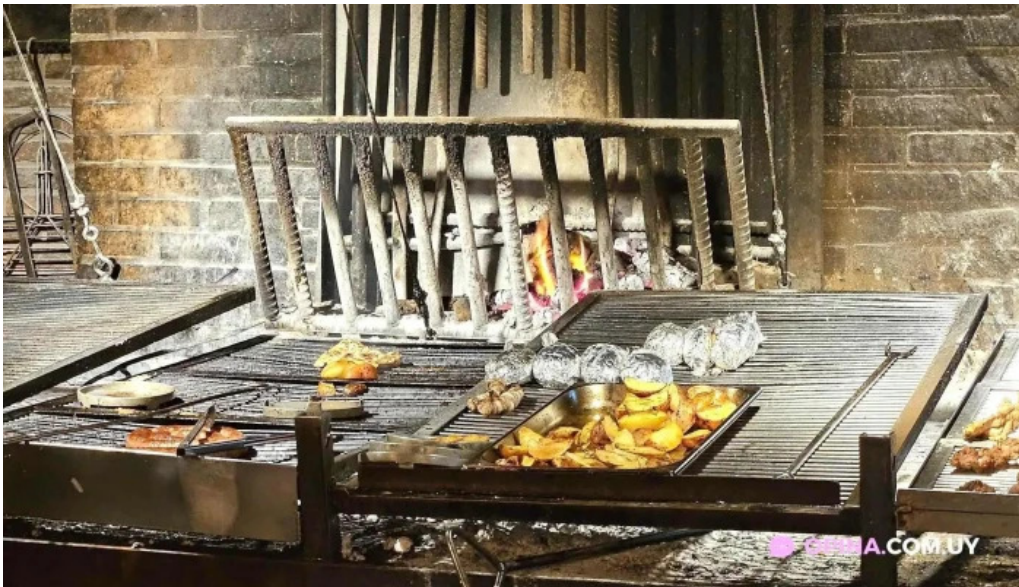
El palenque punta del este