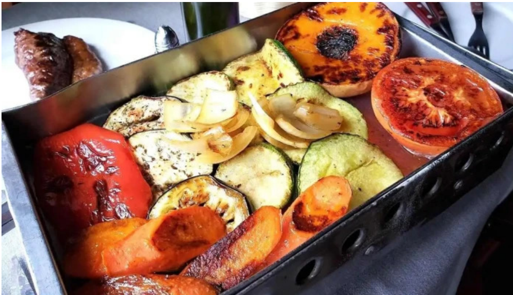
El palenque comida y bebida