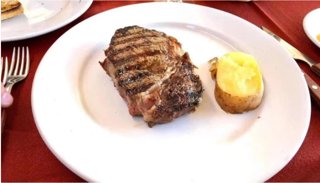
El palenque filete