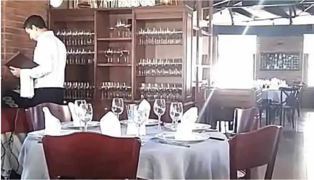
El palenque videos