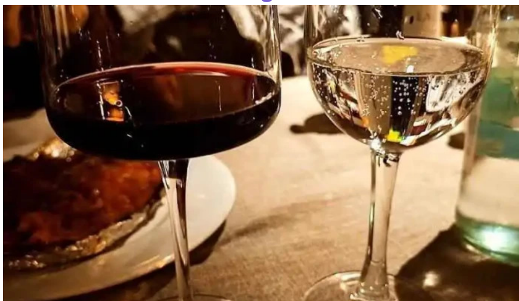
El palenque vino