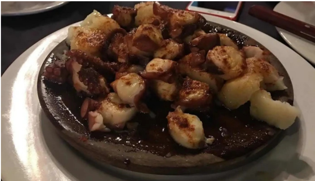
El palenque pulpo a la gallega