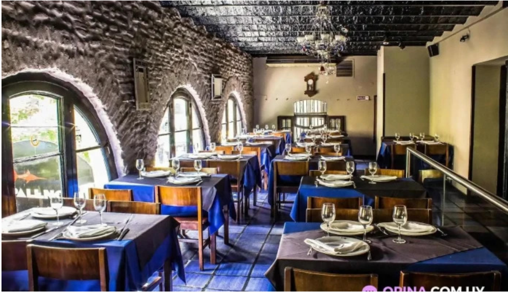
El palenque del propietario