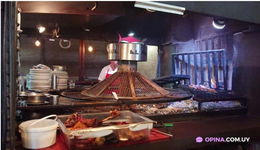
El palenque comida y bebida