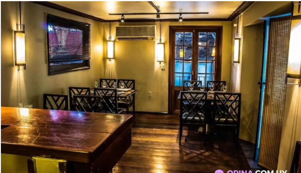
El palenque montevideo