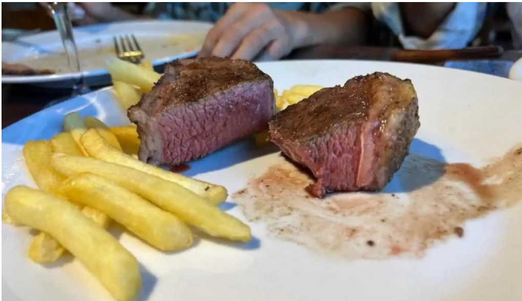
El palenque filet mignon