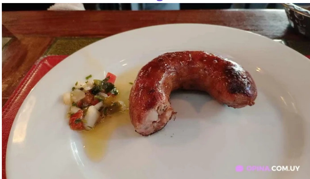
El palenque videos