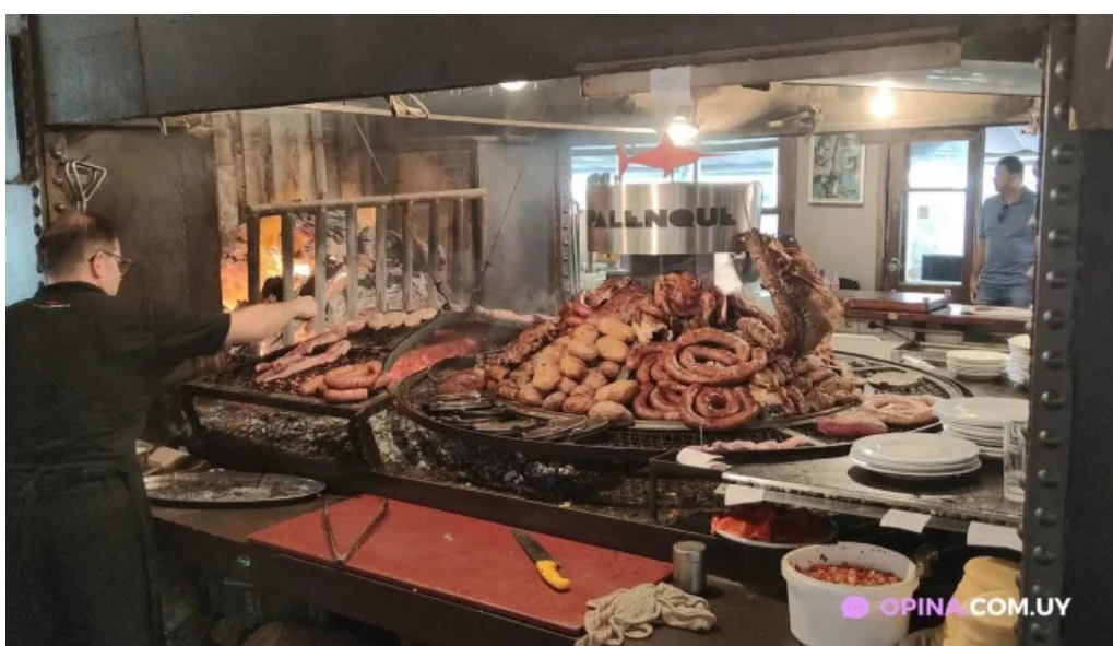
El palenque ambiente