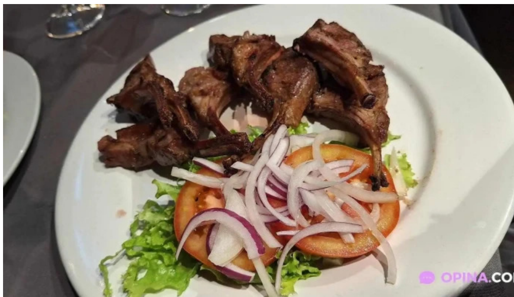
El palenque mas recientes