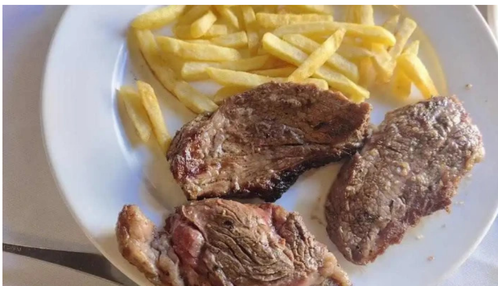
El palenque churrasco