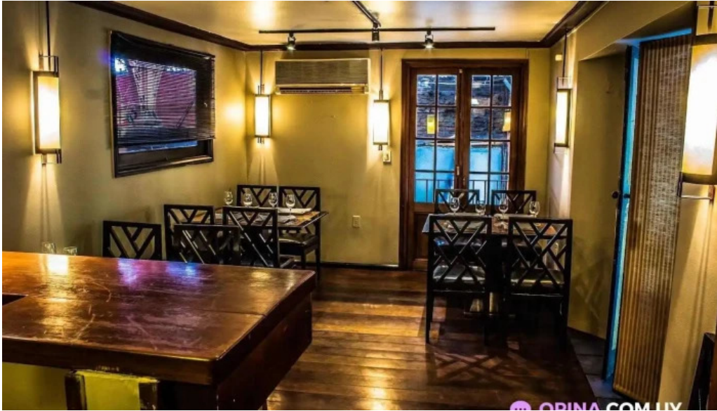
El palenque todas