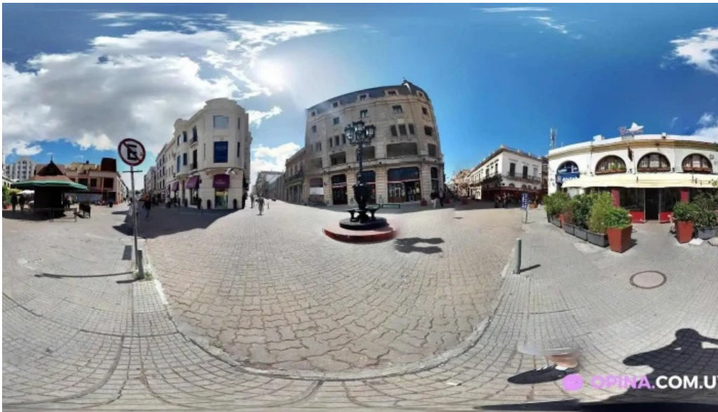
El palenque street view y 360