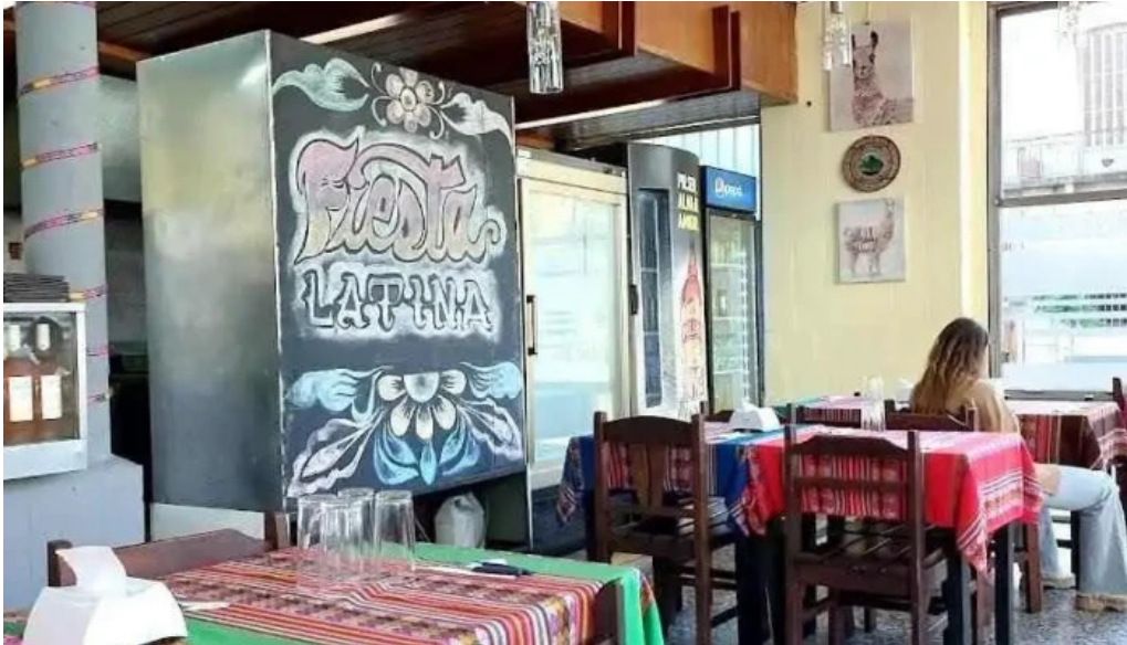
Caminos del inca aventura culinaria montevideo