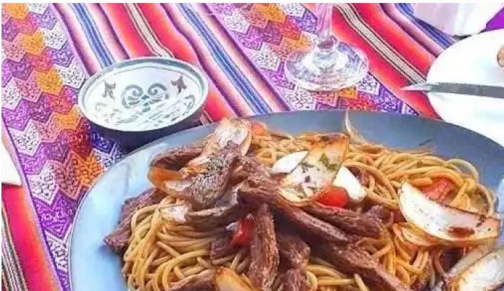
Caminos del inca aventura culinaria chow mein