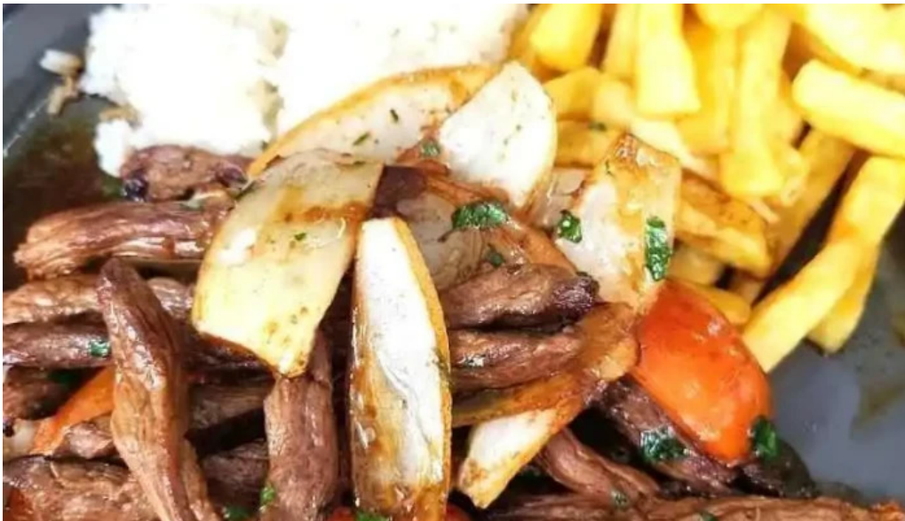
Caminos del inca aventura culinaria lomo saltado