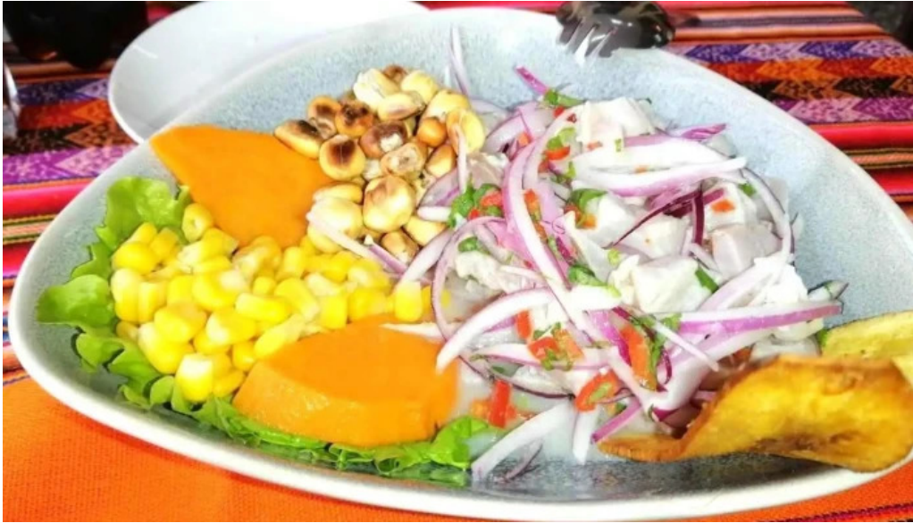
Caminos del inca aventura culinaria ceviche