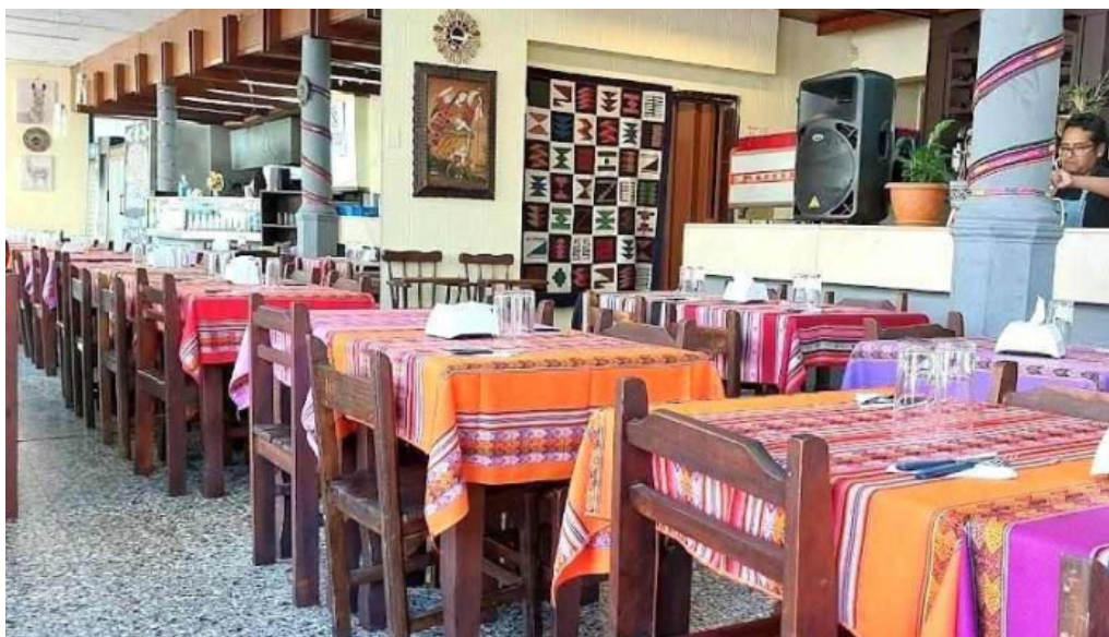
Caminos del inca aventura culinaria ambiente