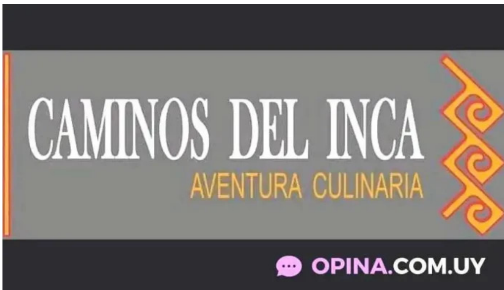
Caminos del inca aventura culinaria del propietario