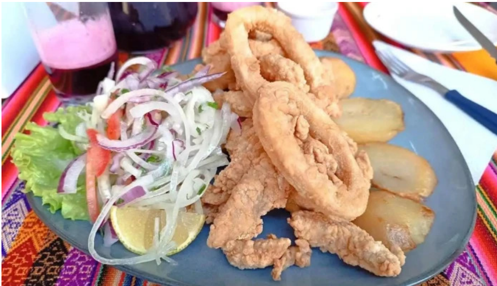
Caminos del inca aventura culinaria jalea