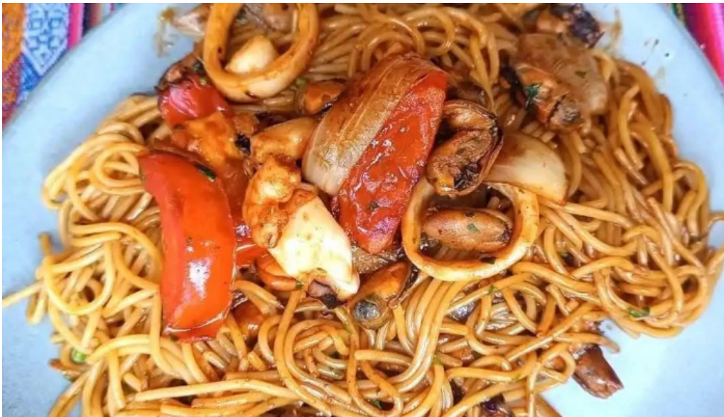
Caminos del inca aventura culinaria mas recientes