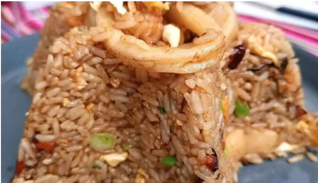
Caminos del inca aventura culinaria arroz frito