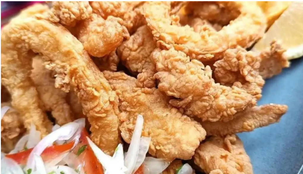
Caminos del inca aventura culinaria comida y bebida