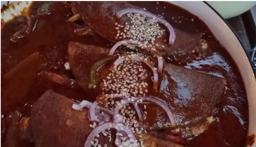
La cantina mexicana mole poblano