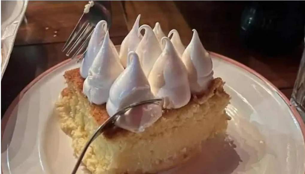
La cantina mexicana tarta de lima