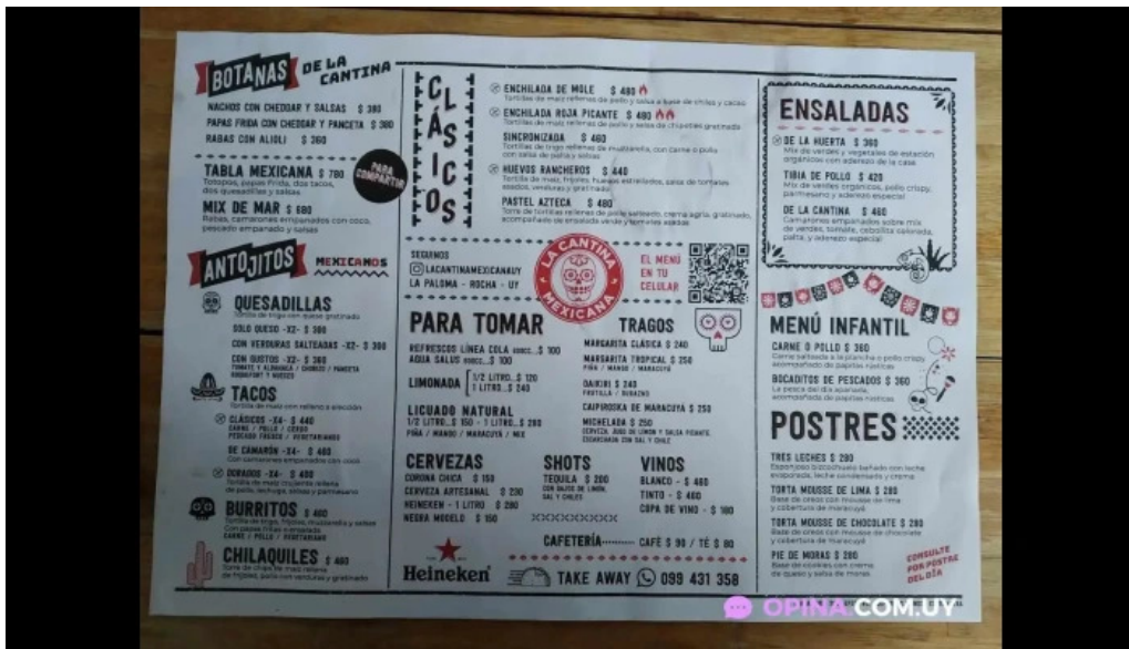
La cantina mexicana menu