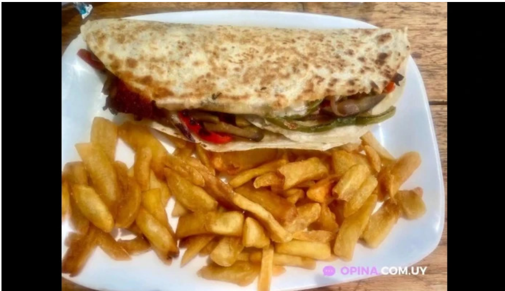
La cantina mexicana quesadilla