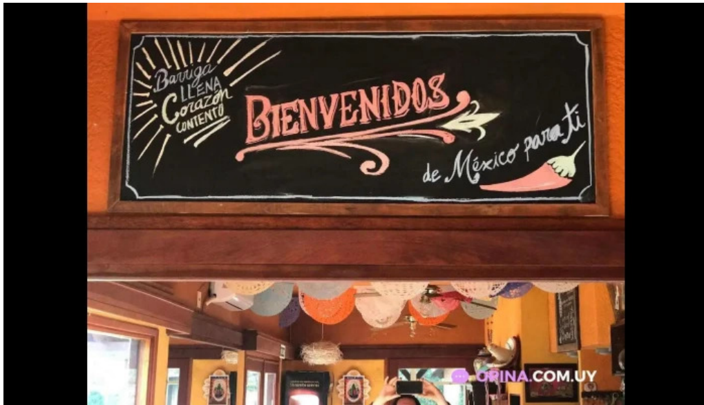
La cantina mexicana pub