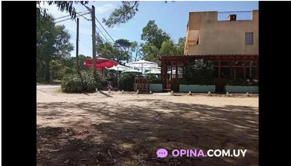
La cantina mexicana videos