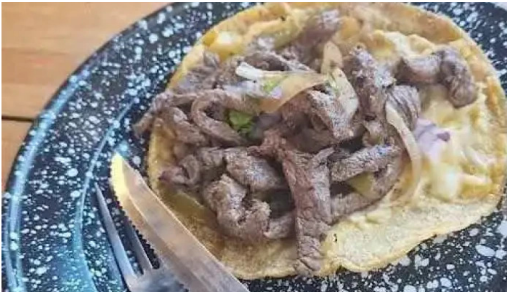
La cantina mexicana mas recientes