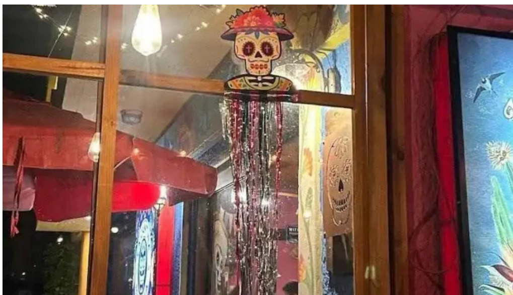
La cantina mexicana todas