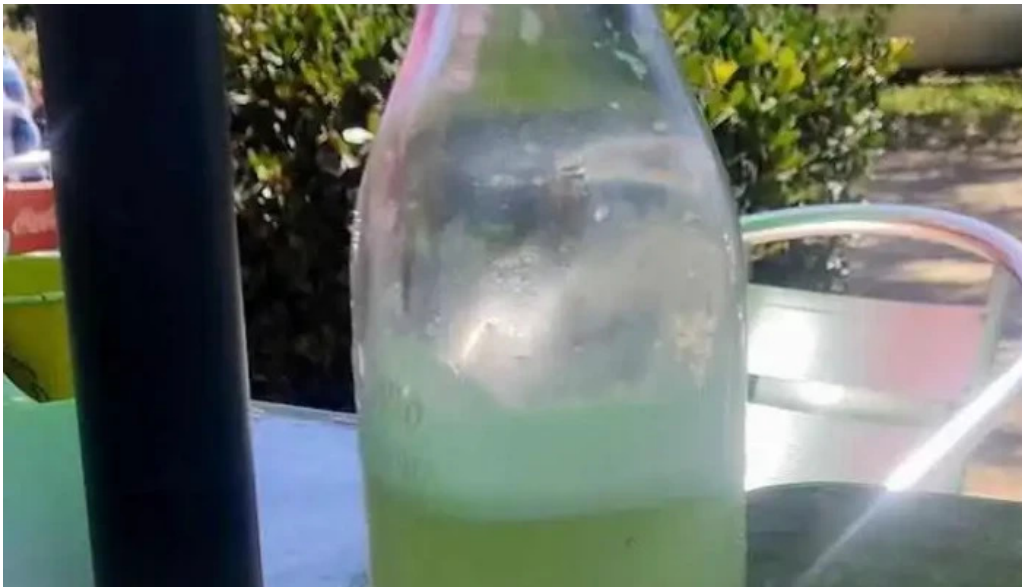
La cantina mexicana jugo