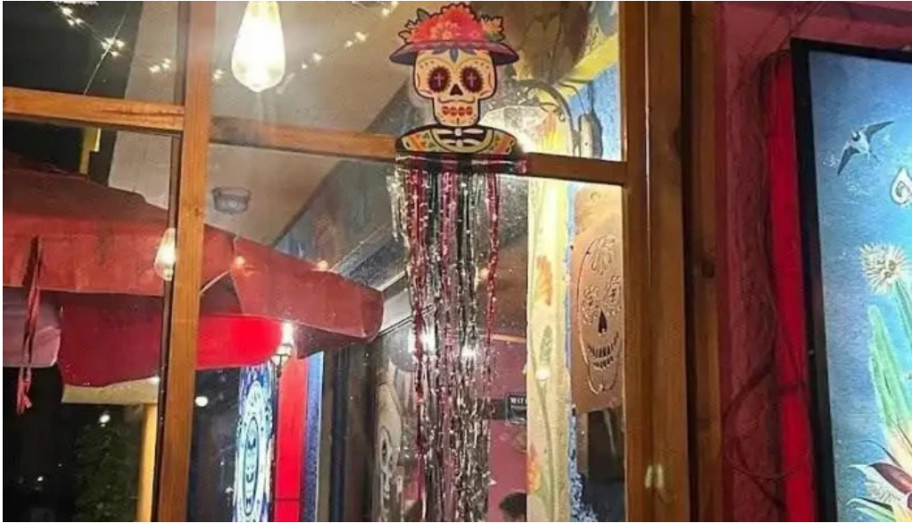
La cantina mexicana la paloma