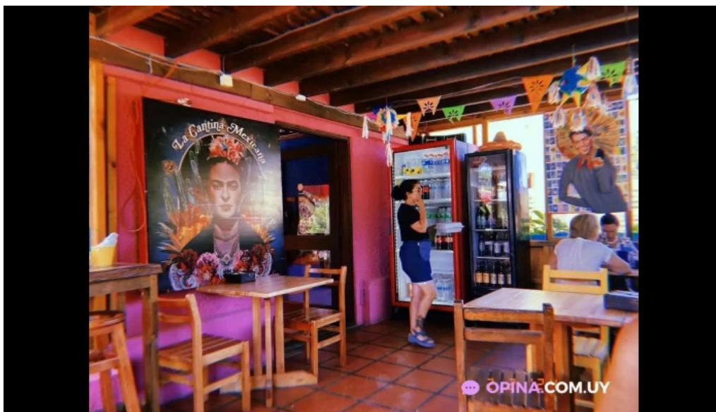
La cantina mexicana ambiente