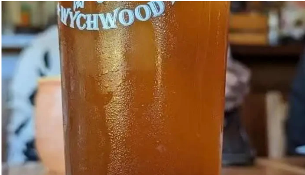
La cantina mexicana michelada