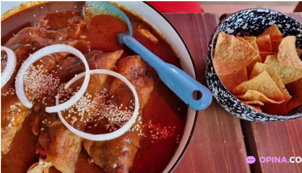
La cantina mexicana comida y bebida