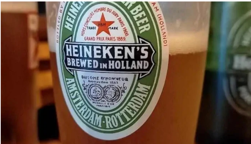
La cantina mexicana cerveza