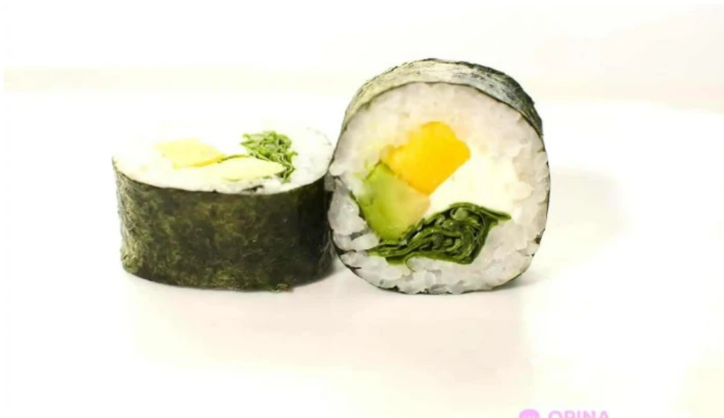
Misushi del propietario