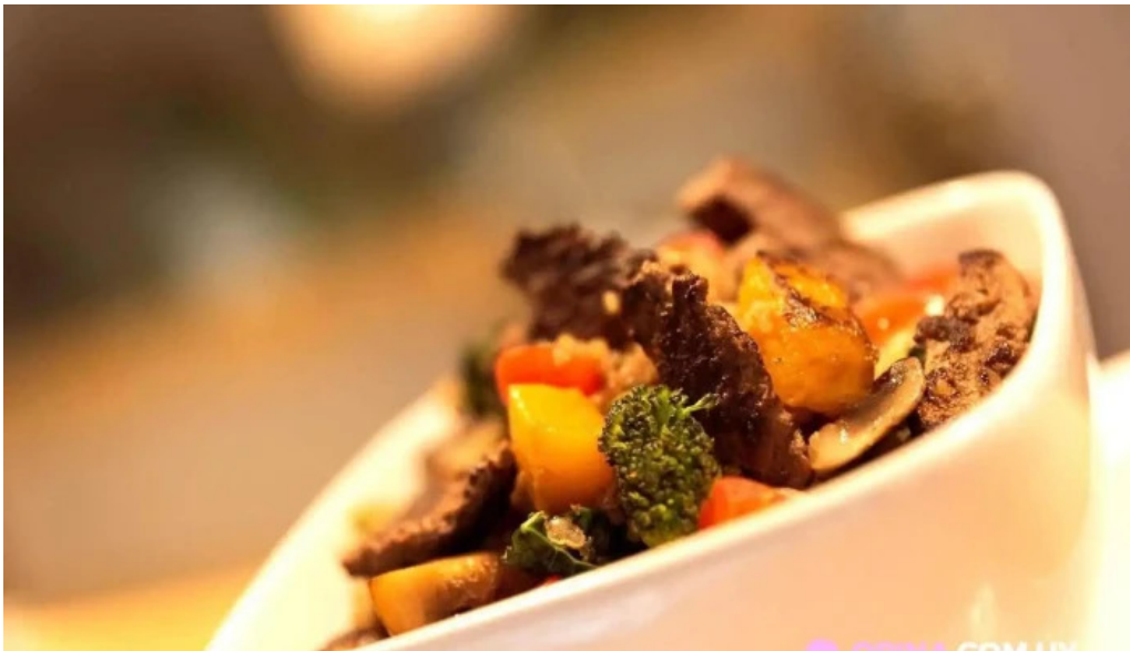
Misushi carne de res