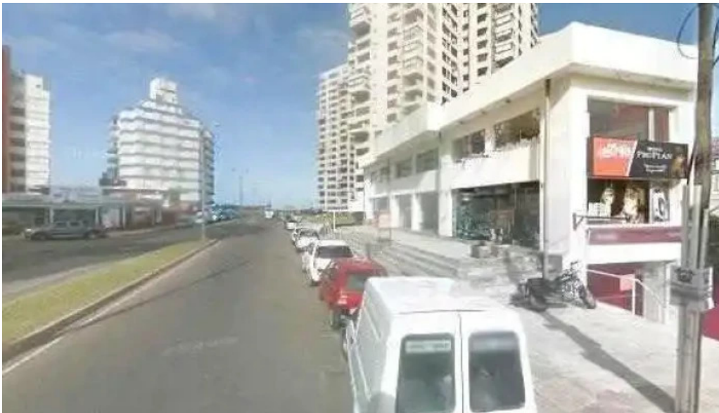
Misushi street view y 360