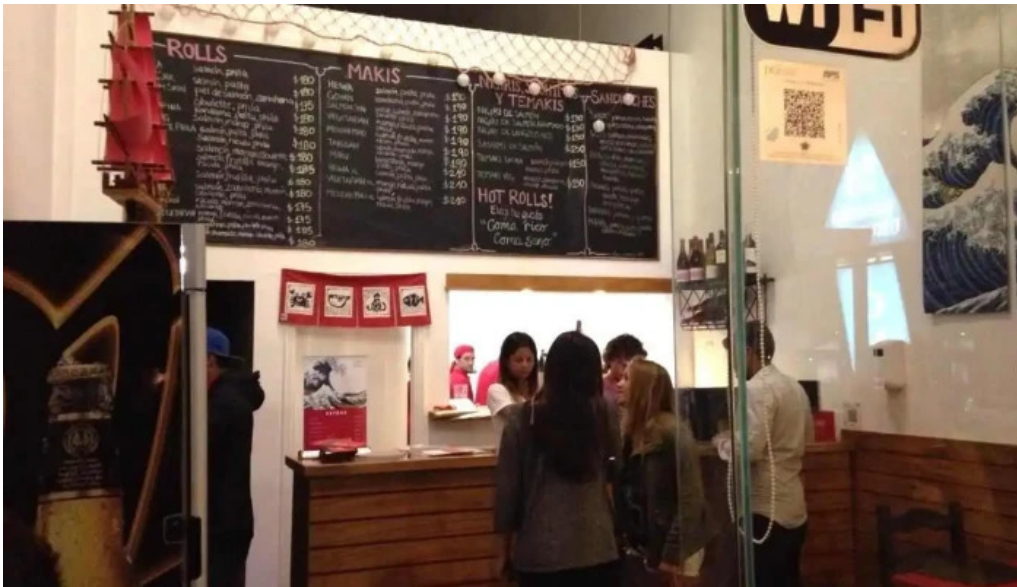
Misushi punta del este