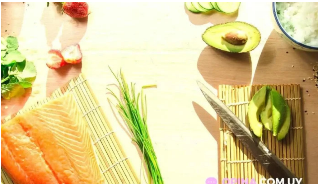
Misushi salmon ahumado