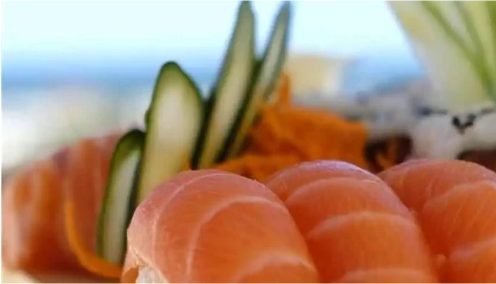
Misushi comida y bebida