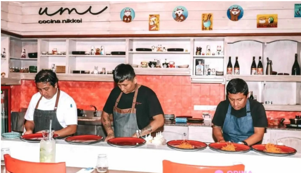
Umi cocina nikkei punta del este