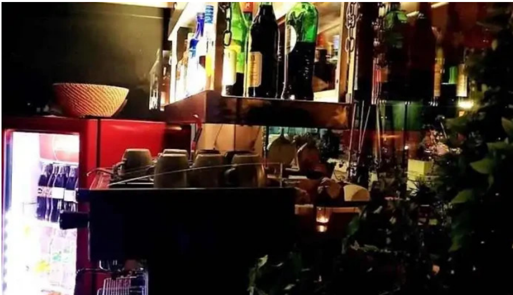
Umi cocina nikkei ambiente