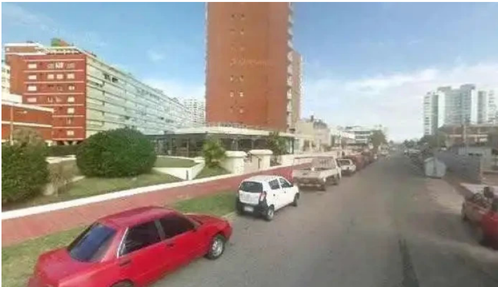
Umi cocina nikkei street view y 360