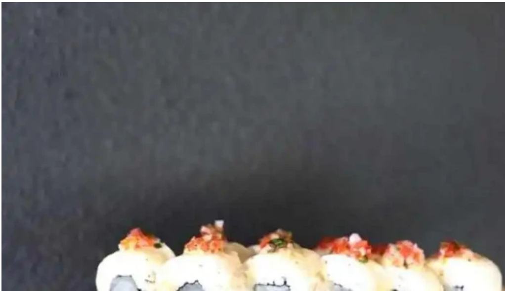
Umi cocina nikkei del propietario