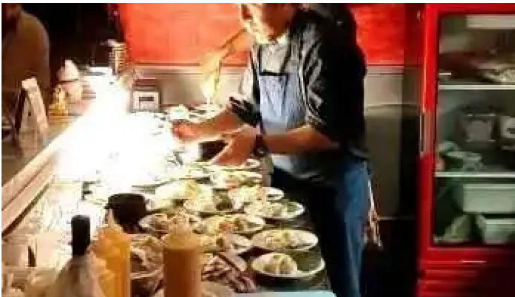
Umi cocina nikkei videos