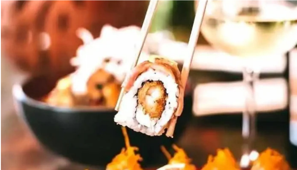
Umi cocina nikkei comida y bebida