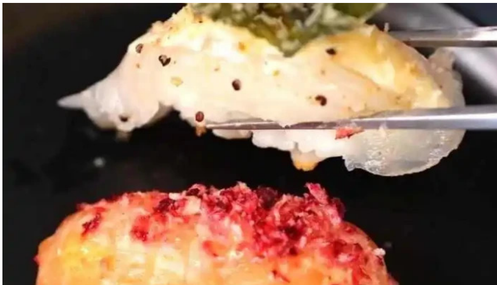
Umi cocina nikkei sushi