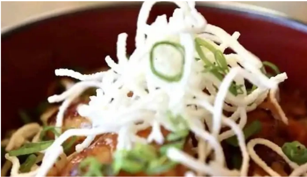
Umi cocina nikkei fideo