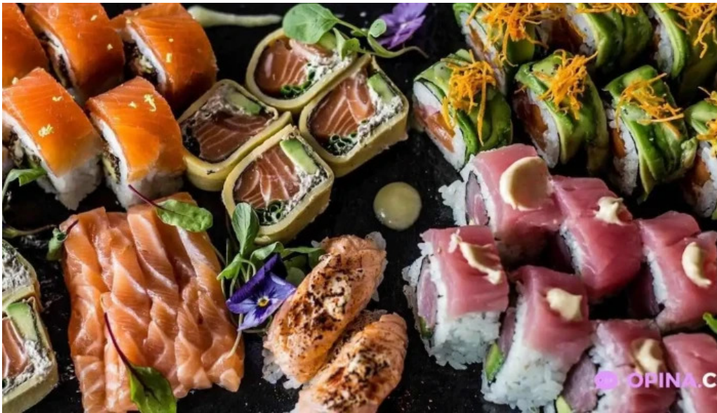
Umami sushi sushi