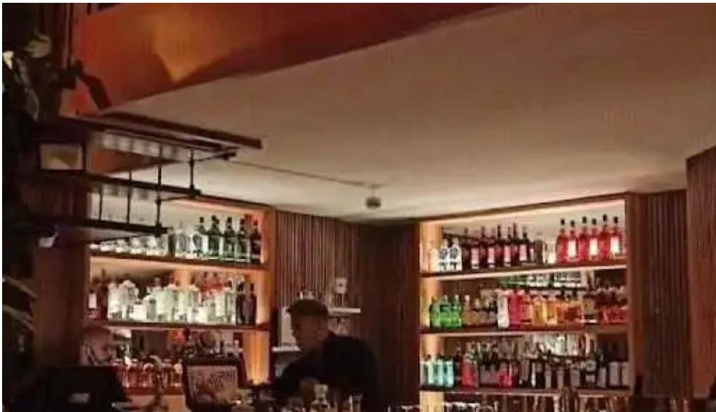
Umami sushi montevideo