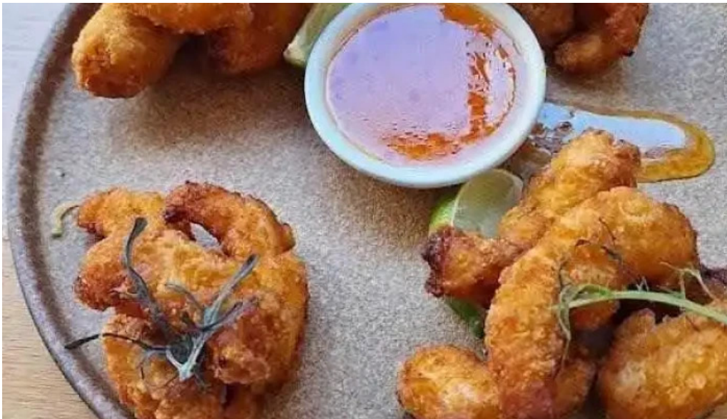
Umami sushi gamba frita