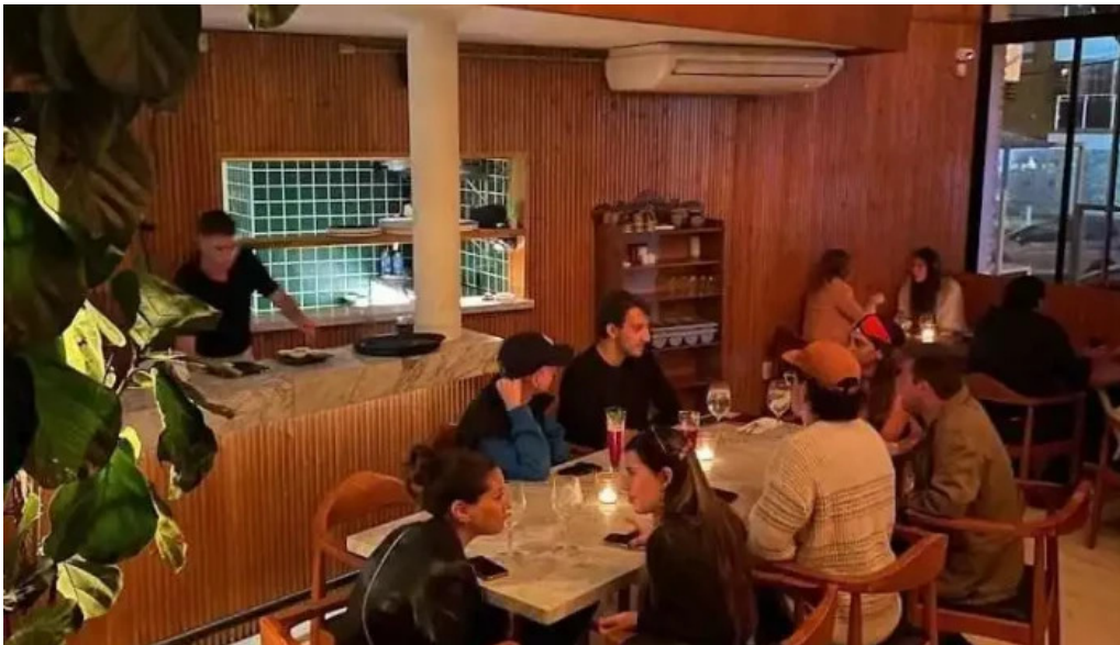
Umami sushi ambiente