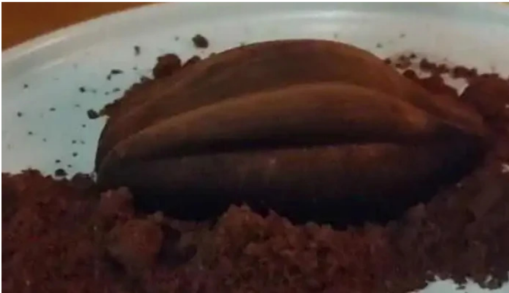
Umami sushi videos