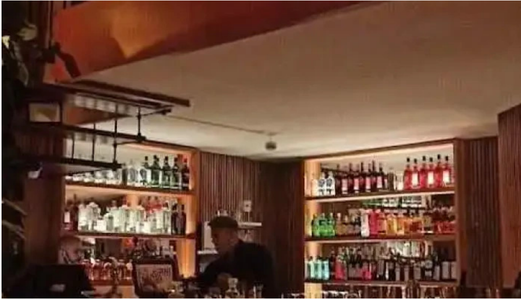
Umami sushi todas