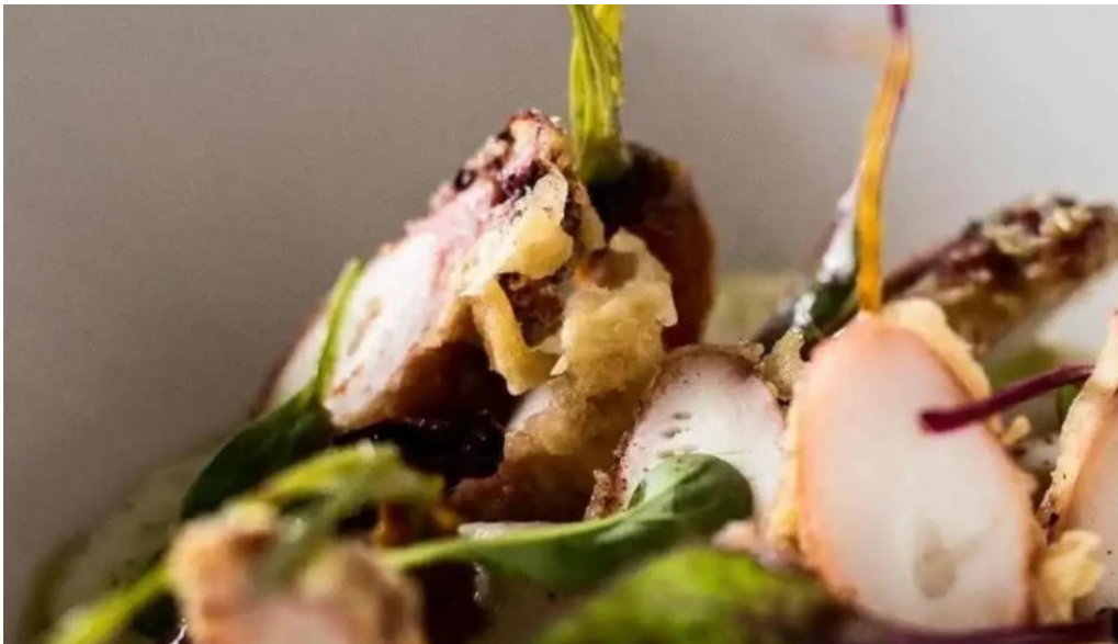
Umami sushi del proprietario