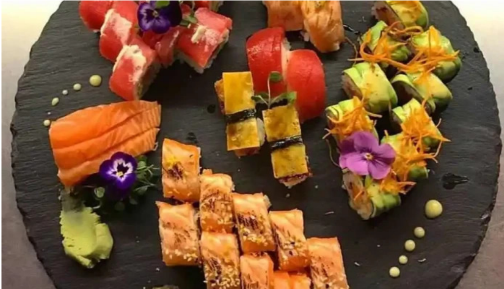
Umami sushi comida y bebida