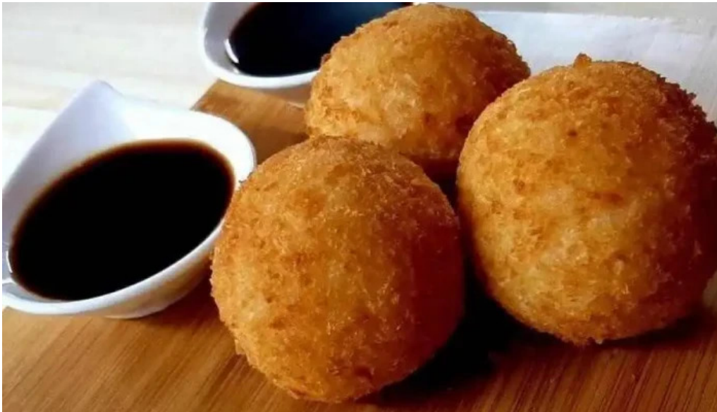
Kami sushi la union todas