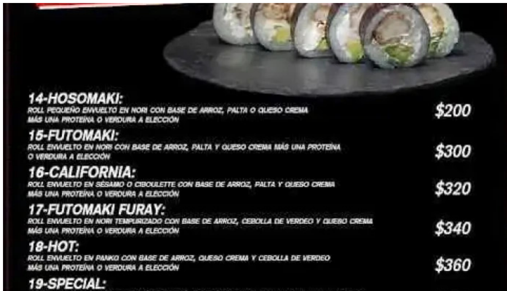
Kami sushi la union menu