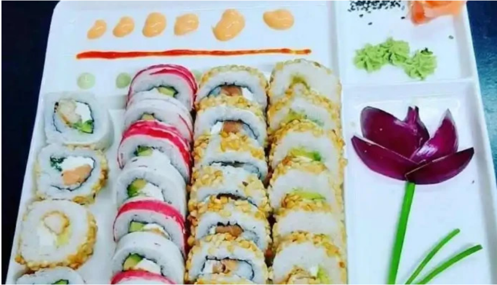
Kami sushi la union sushi