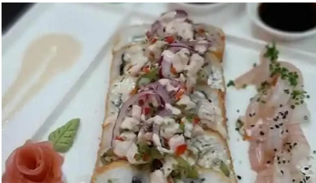
Kami sushi la union del propietario