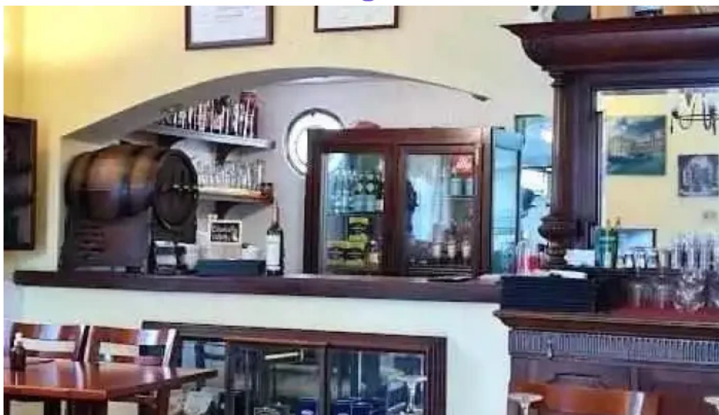
La hostaria todas