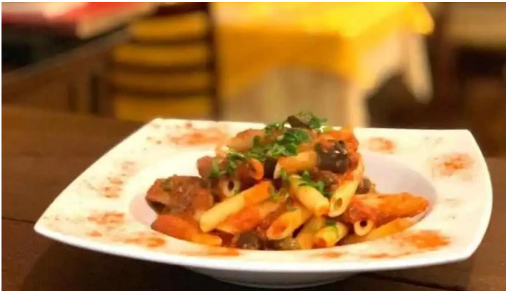
La hostaria del propietario