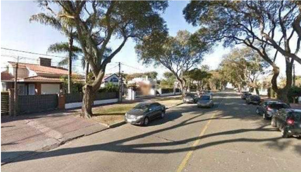
La hostaria street view y 360