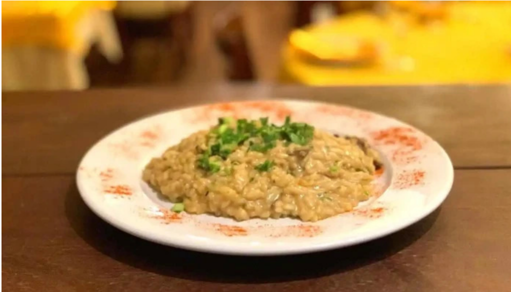
La hostaria comida y bebida