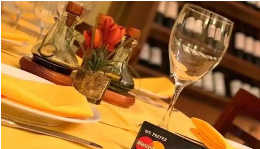
La hostaria bar