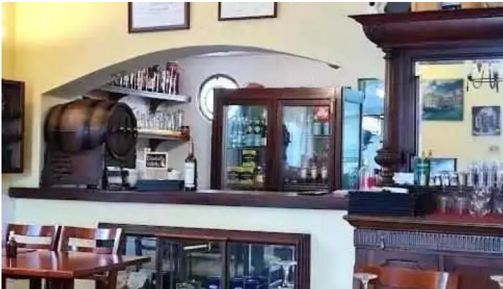
La hostaria montevideo