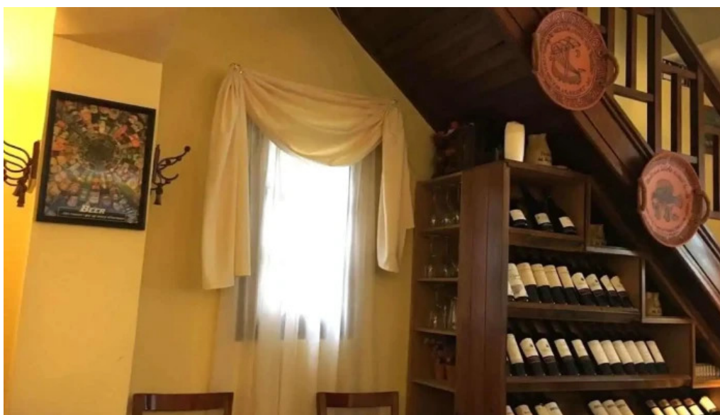
La hostaria ambiente