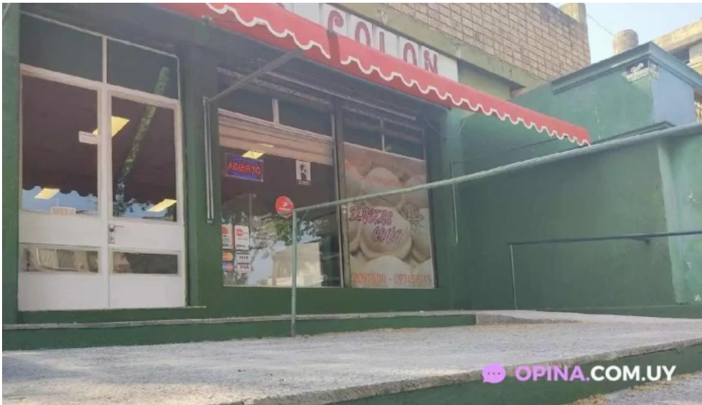
Fabrica de pastas colon todas