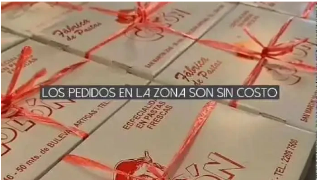
Fabrica de pastas colon videos