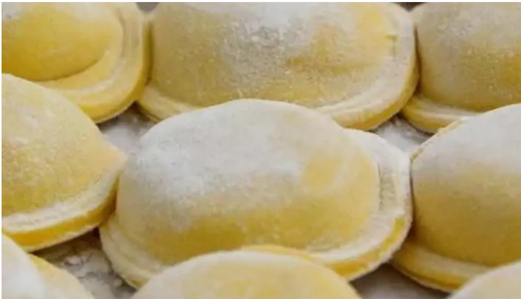
Fabrica de pastas colon del propietario