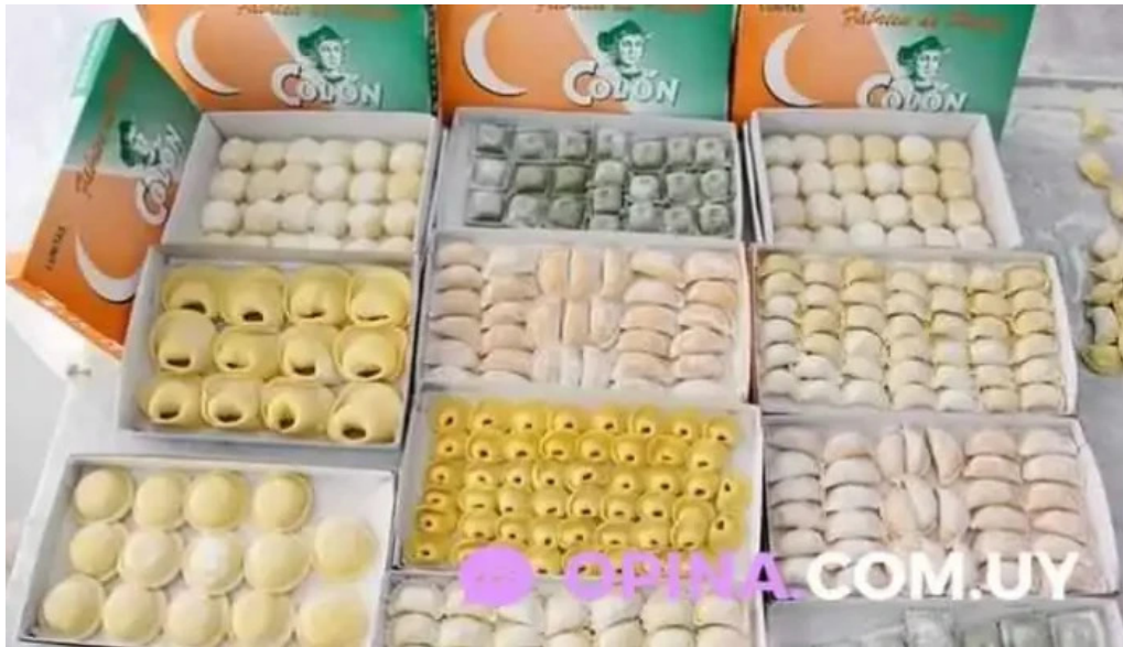
Fabrica de pastas colon comida y bebida