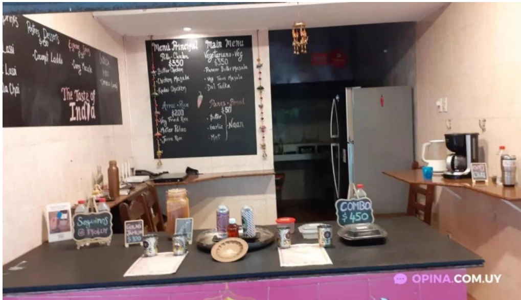
The taste of india menu