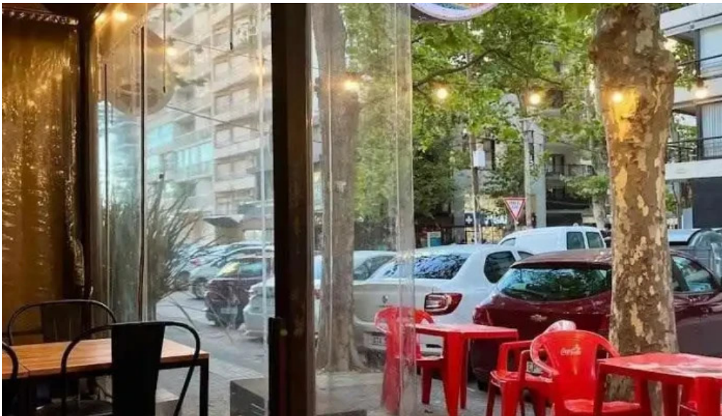
The taste of india todas