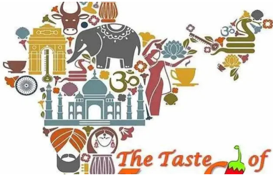
The taste of india del proprietario