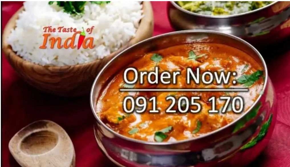
The taste of india curry