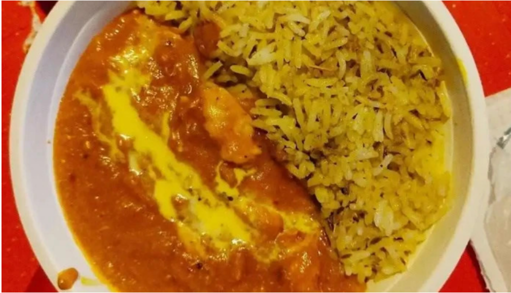
The taste of india pollo con mantequilla