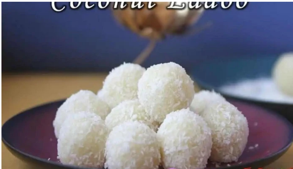
The taste of india comida y bebida