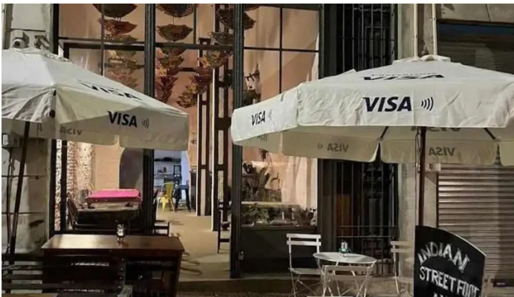
Moksha indian street food and curry bar montevideo