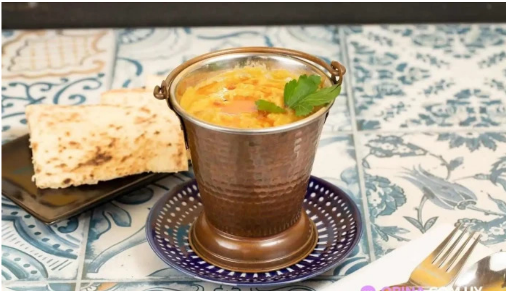
Moksha indian street food and curry bar curry