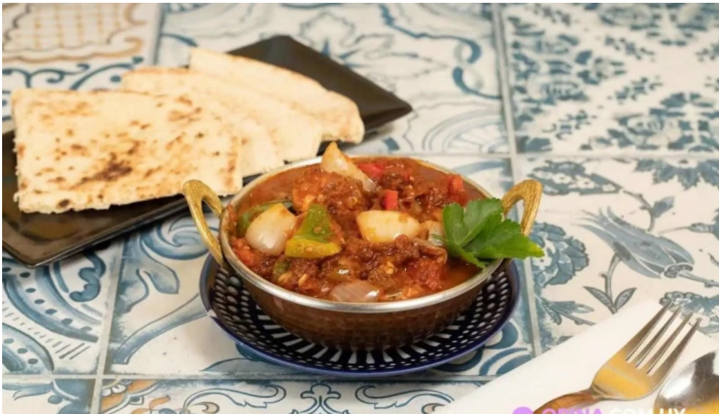
Moksha indian street food and curry bar comida y bebida