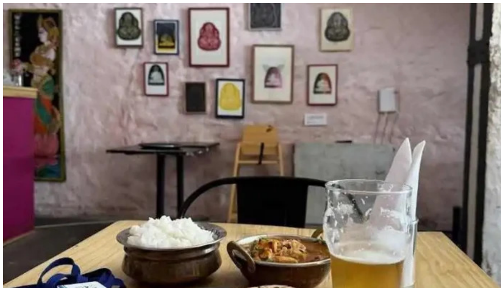
Moksha indian street food and curry bar mas recientes