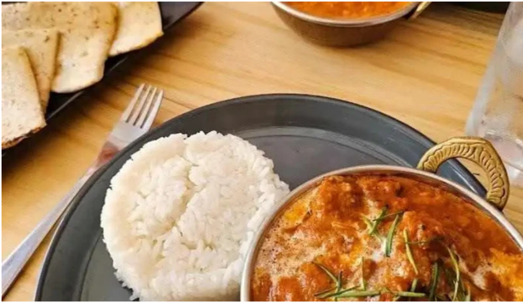
Moksha indian street food and curry bar pollo con mantequilla