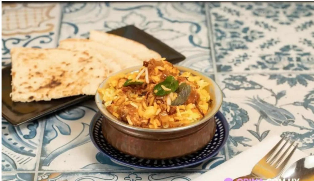
Moksha indian street food and curry bar del propietario