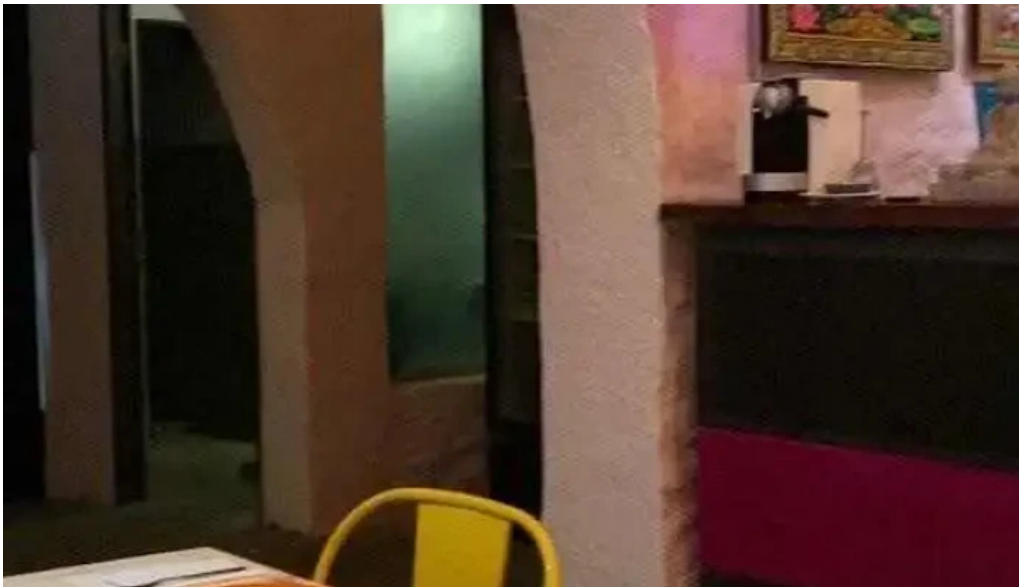
Moksha indian street food and curry bar videos