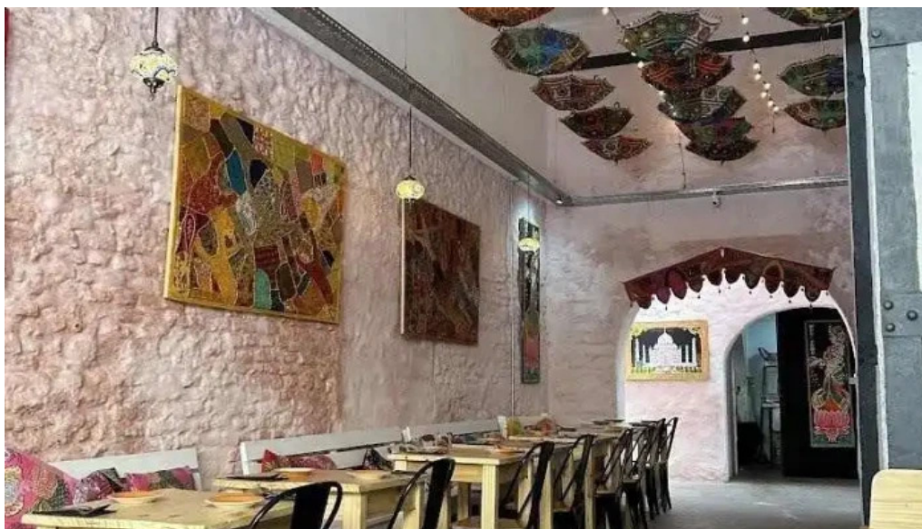
Moksha indian street food and curry bar ambiente