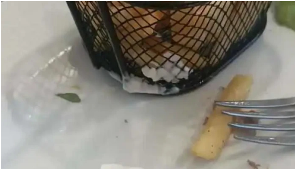
Don napolitano videos