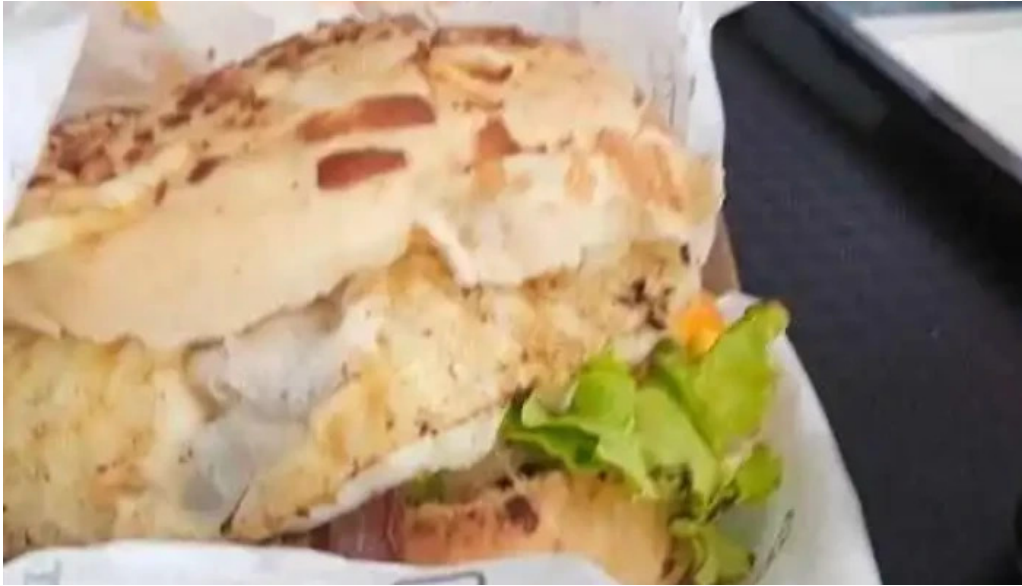
Don napolitano papas fritas