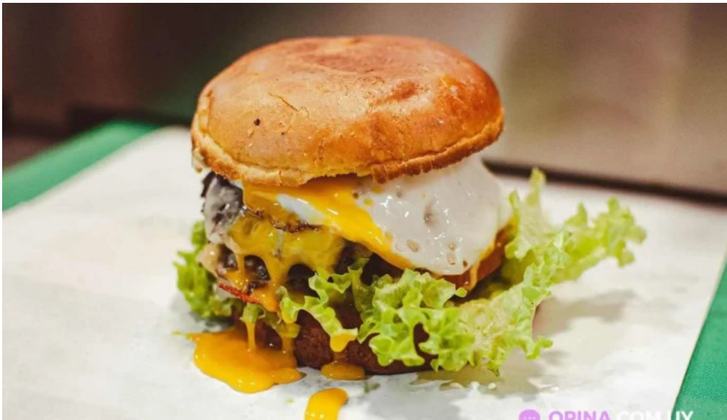
Don napolitano comida y bebida