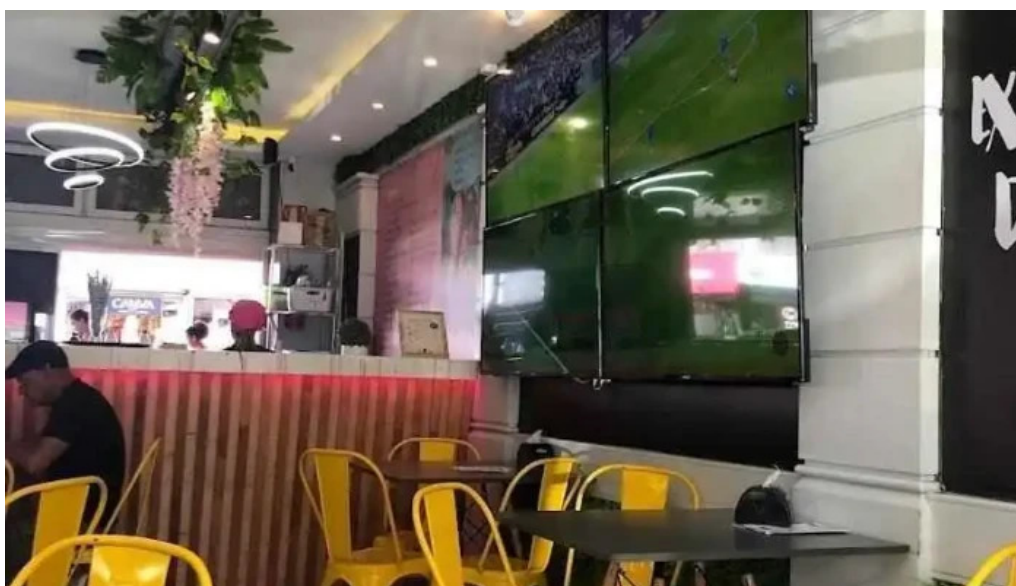
Don napolitano ambiente