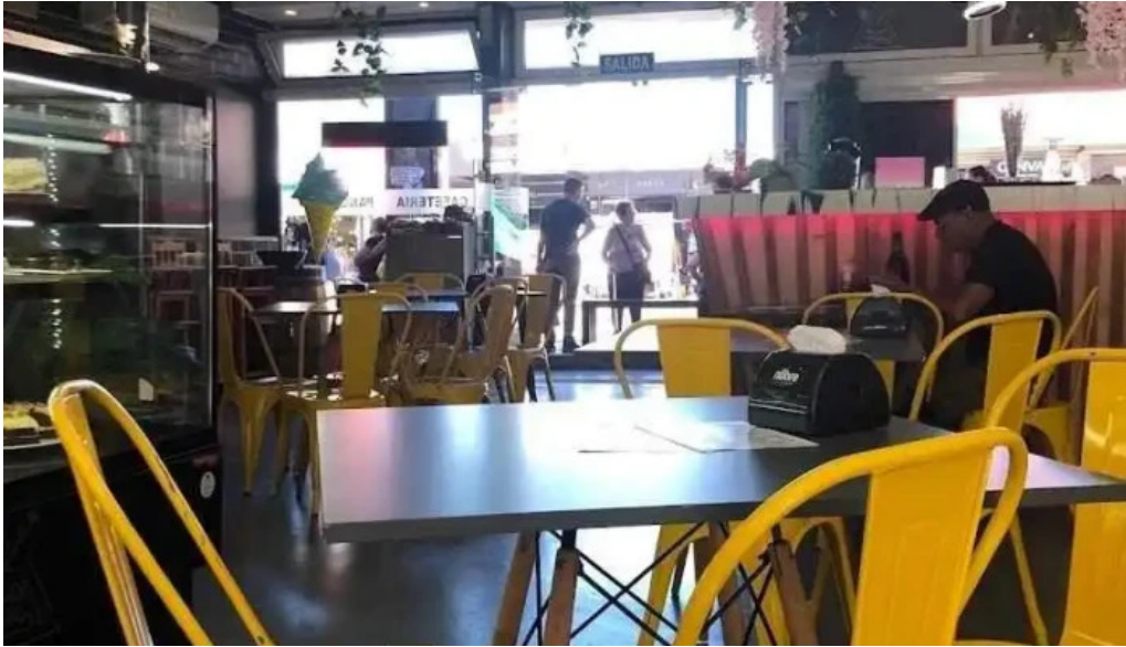
Don napolitano mas recientes