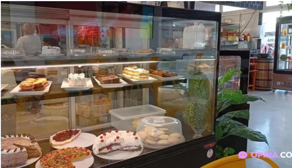
Don napolitano todas