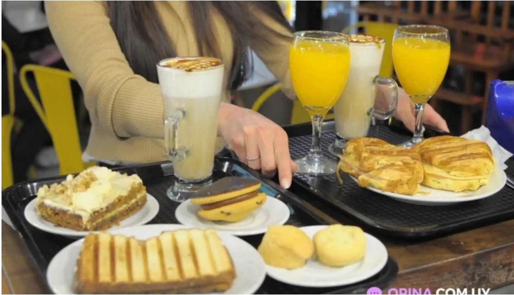
Don napolitano del propietario