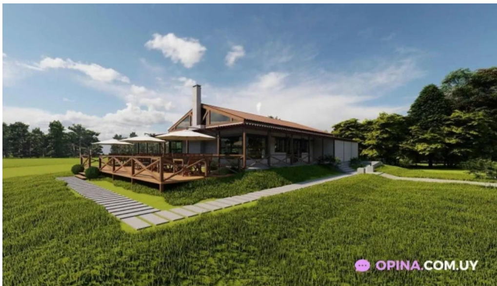
Macondo restaurante chacra eventos del propietario