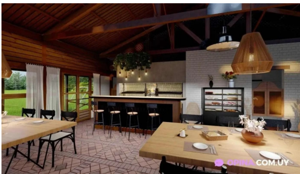
Macondo restaurante chacra eventos ambiente