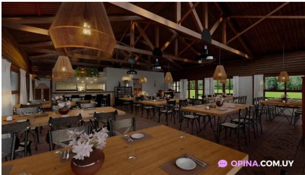
Macondo restaurante chacra eventos todas