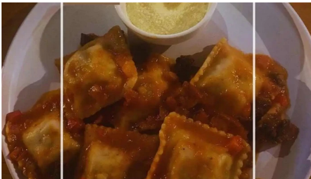
Macondo restaurante chacra eventos comida y bebida