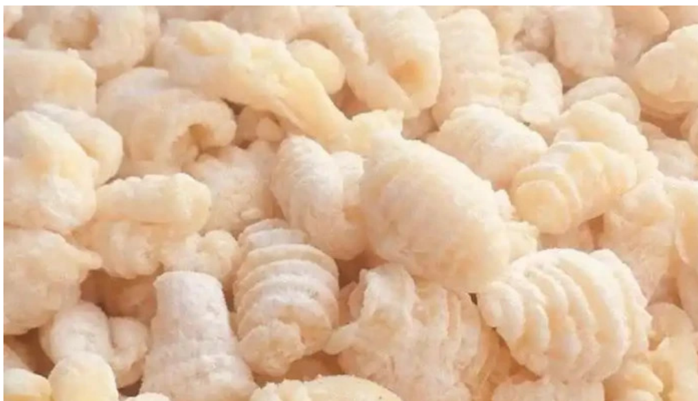
Pastas del plata comida y bebida