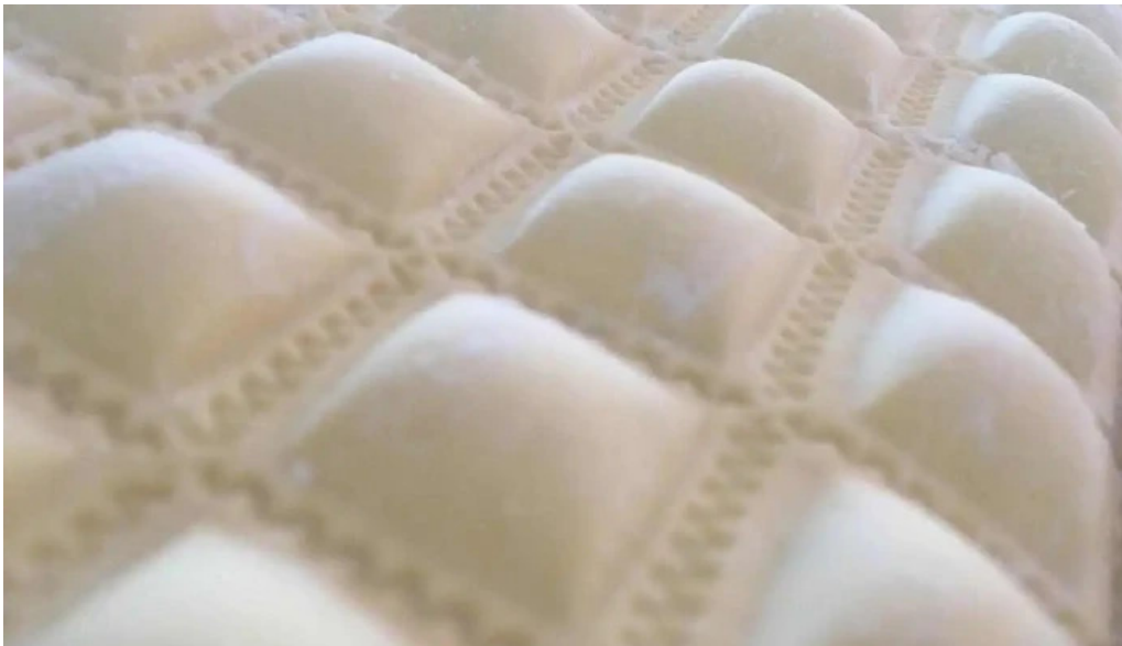
Pastas del plata del propietario