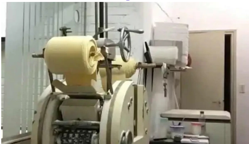
Pastas del plata videos