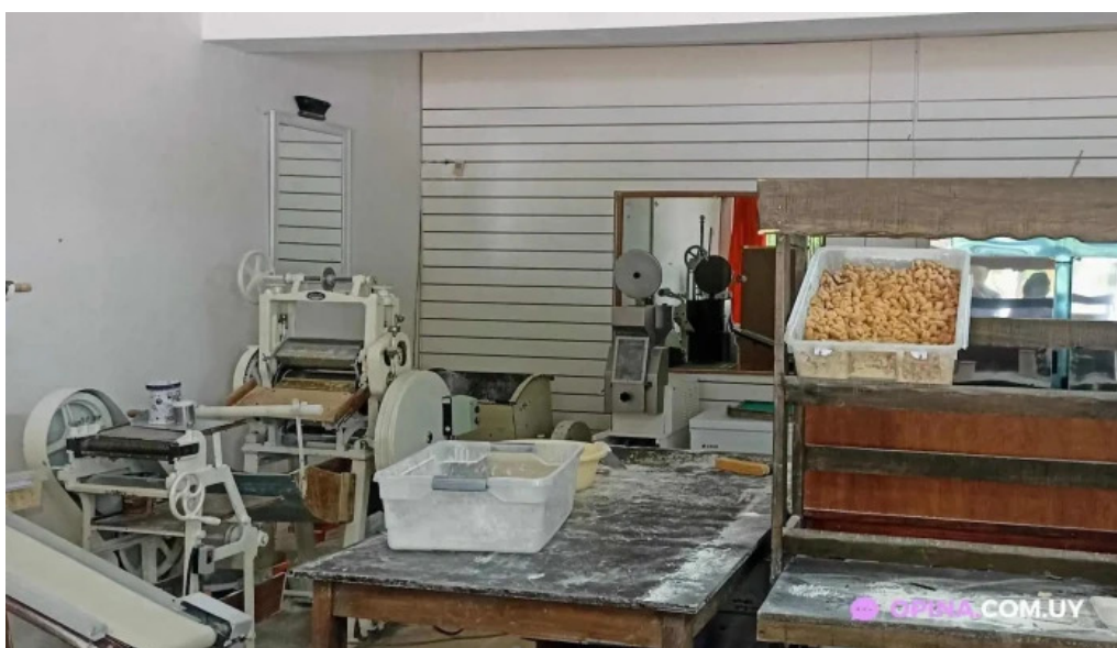
Pastas del plata ambiente