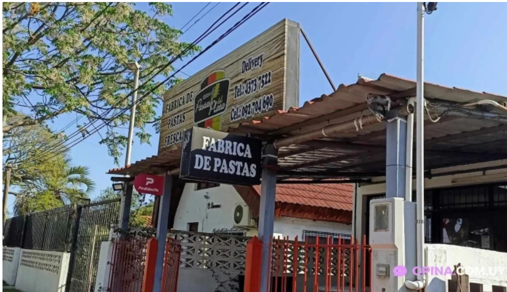
Pastas del plata parque del plata