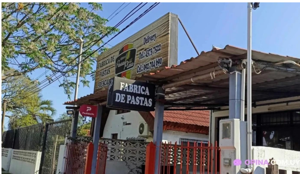
Pastas del plata todas