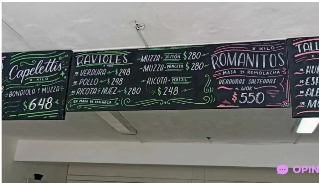
Pastas del plata menu