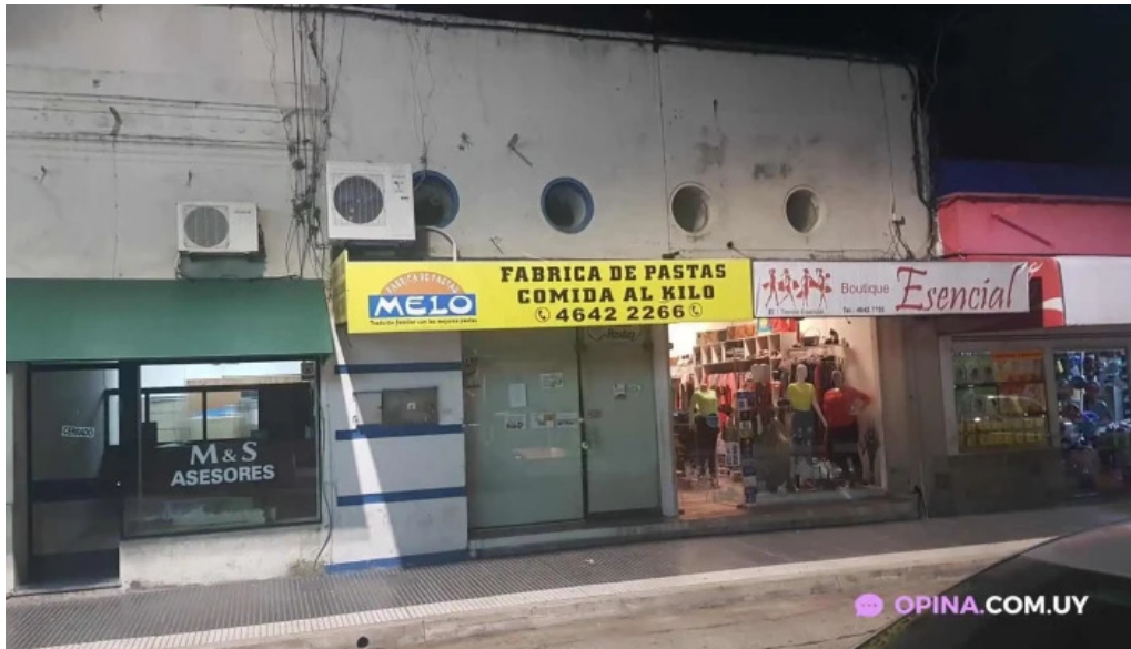
Fabrica de pastas melo melo