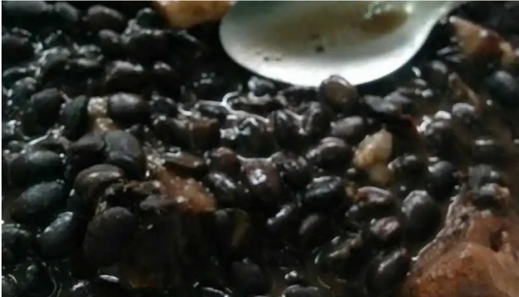
Fabrica de pastas melo comida y bebida