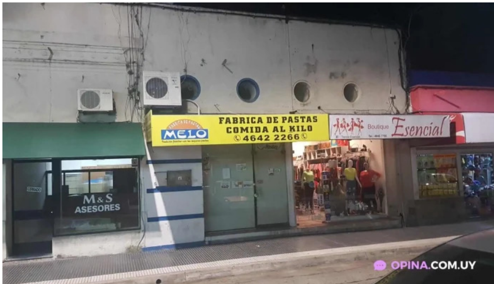
Fabrica de pastas melo todas