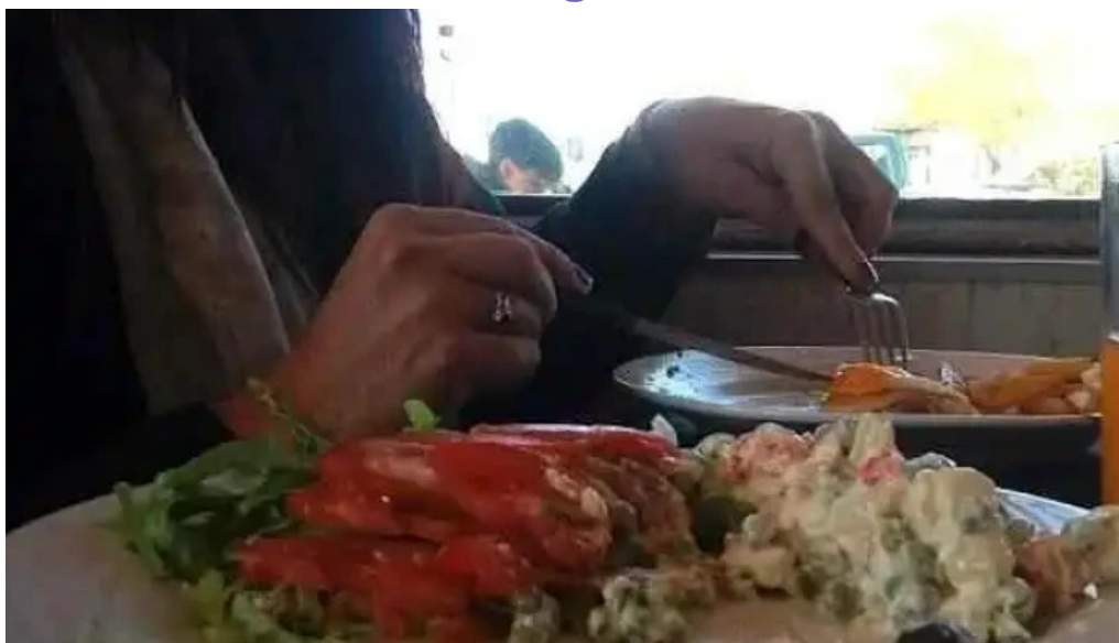
Fabrica de pastas los paraissos todas