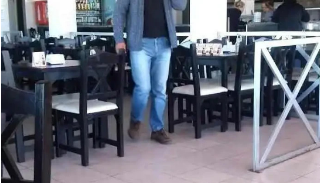
Fabrica de pastas los paraísos ambiente