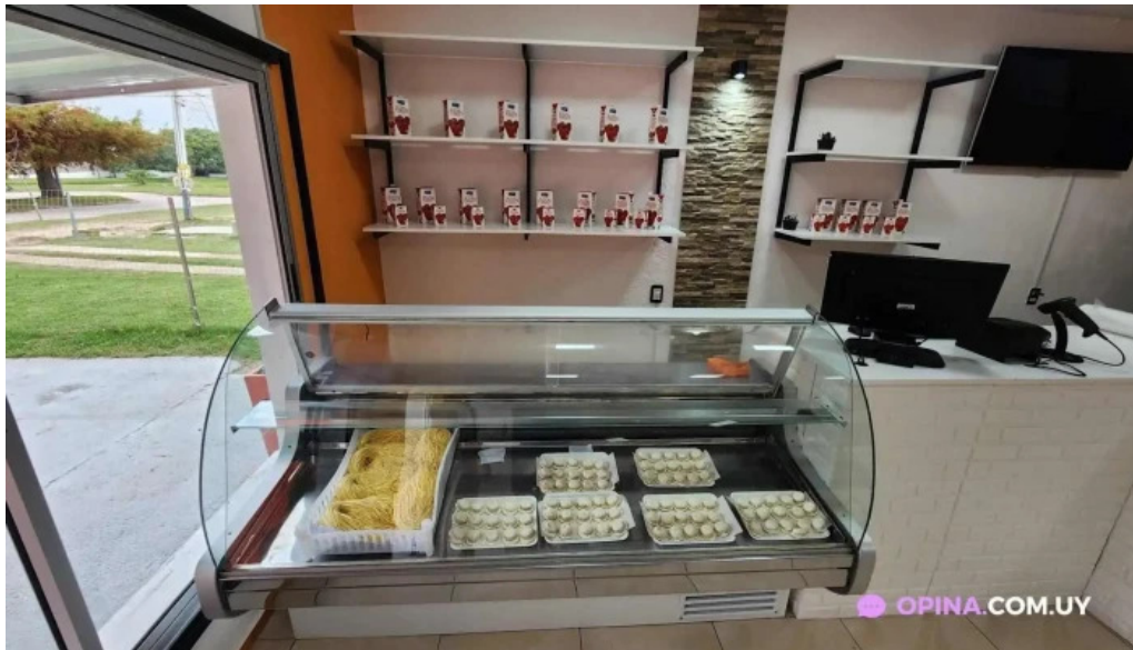
Fabrica de pastas la pasta suc suarez joaquin suarez