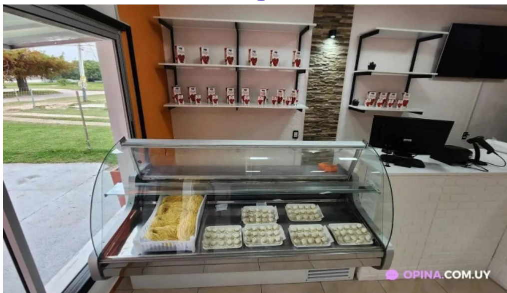
Fabrica de pastas la pasta suc suarez todas