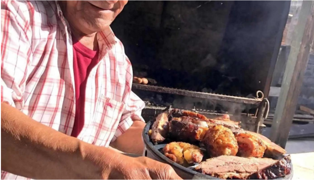
Parrillada el cencerro comidas y bebidas