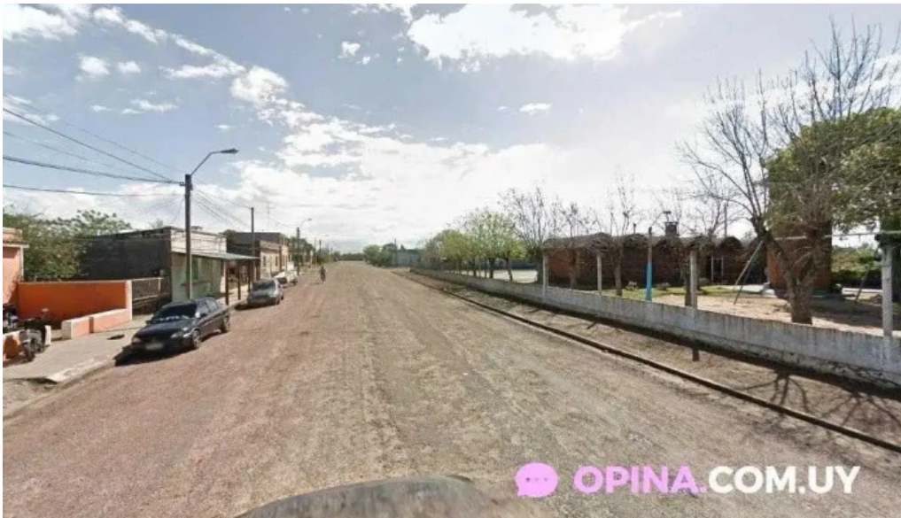
Parrillada el cencerro paso de los toros