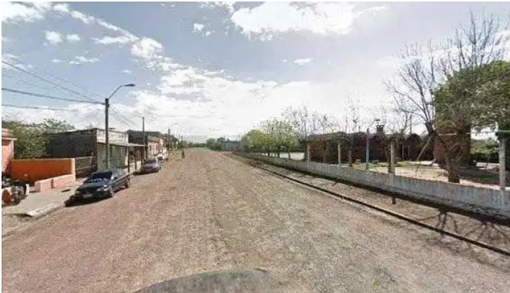
Parrillada el cencerro todo