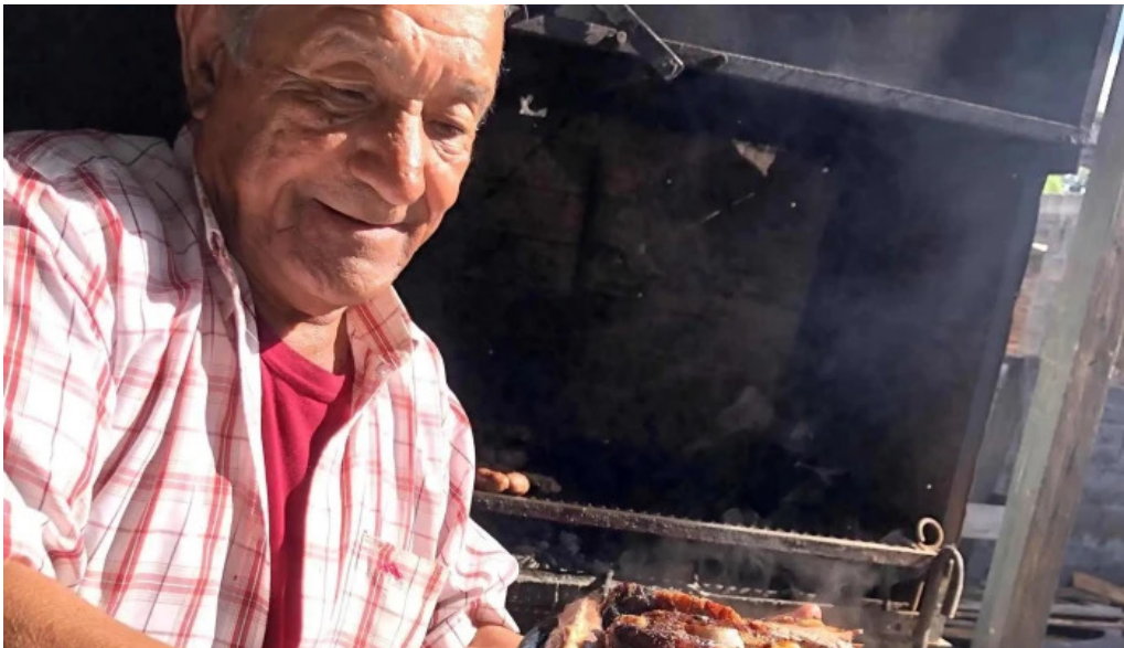
Parrillada el cencerro comentario 1