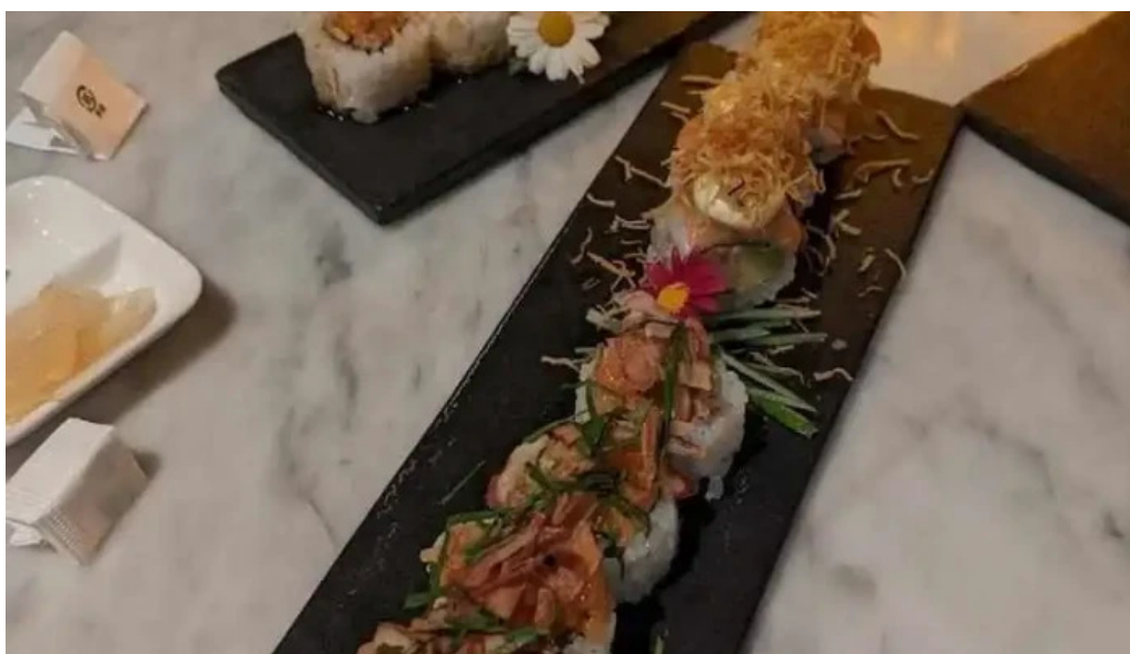
Sushiclub carrasco sushi