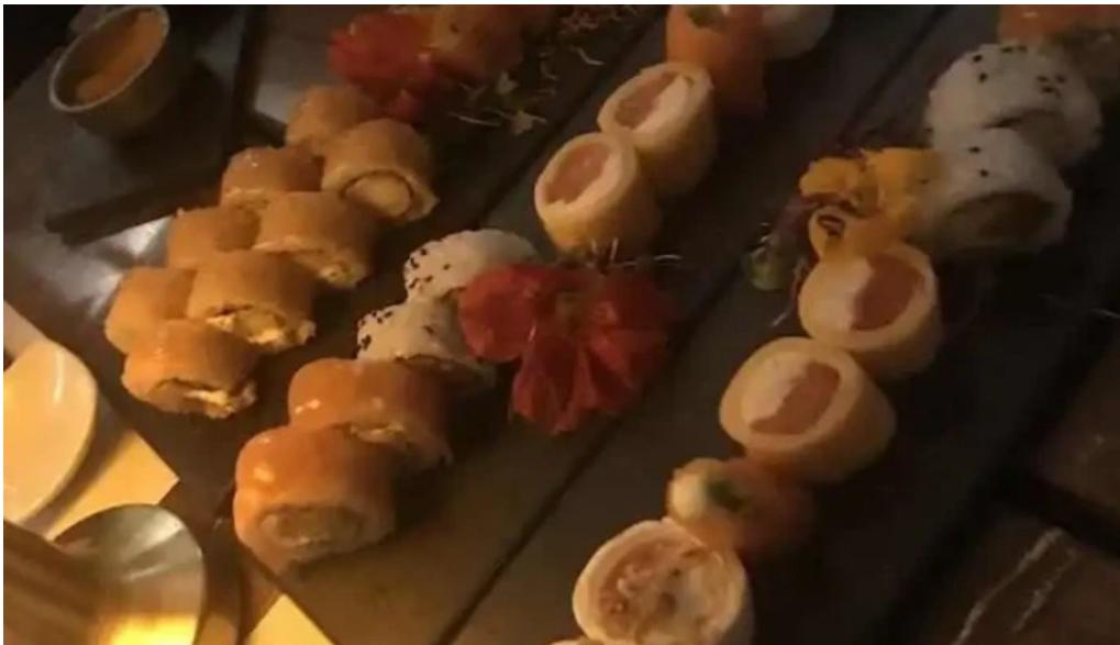
Sushiclub carrasco mas recientes