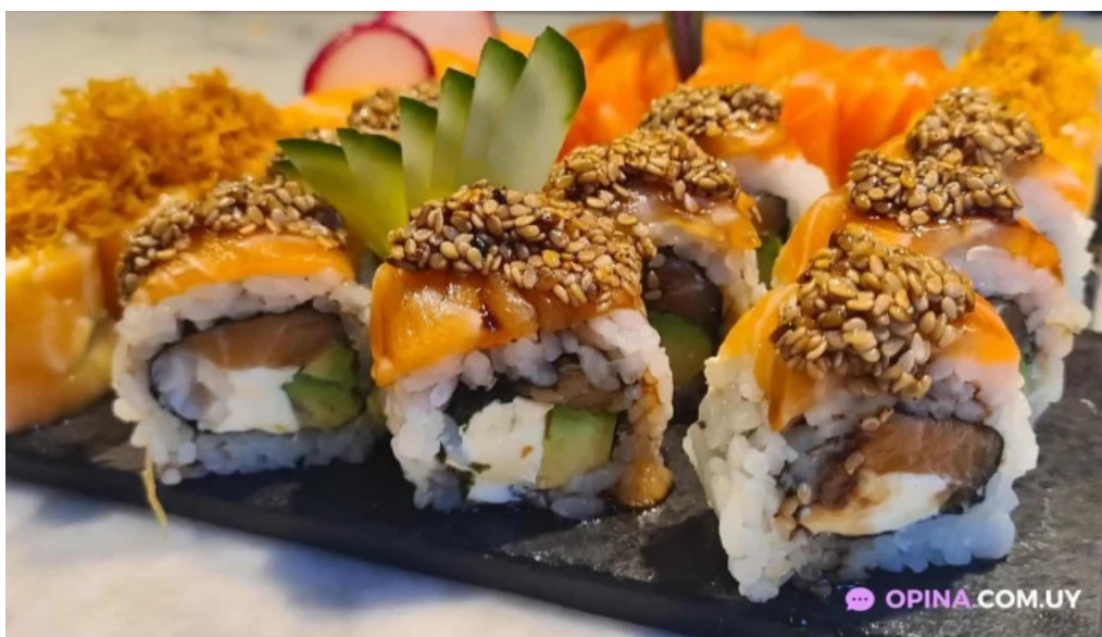
Sushiclub carrasco comida y bebida