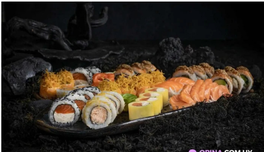
Sushiclub carrasco del propietario