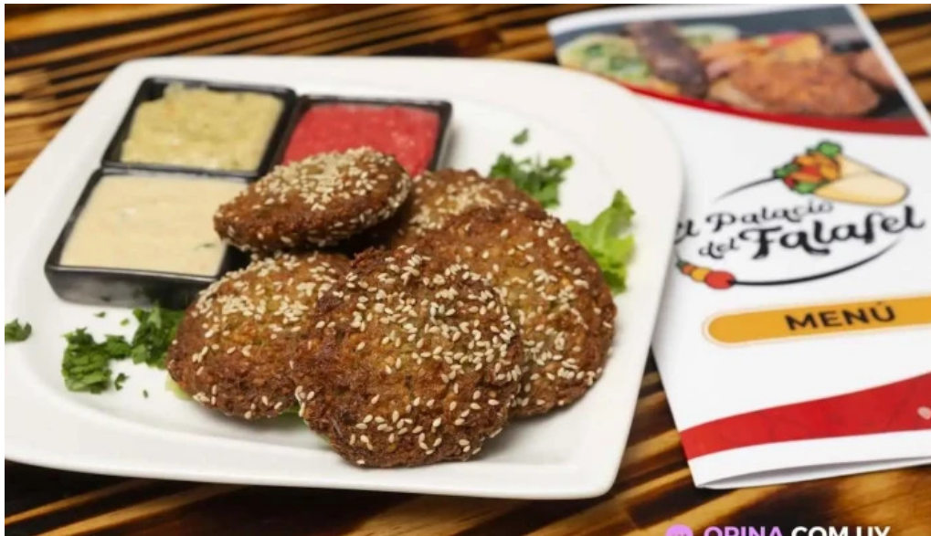
El palacio del falafel comida y bebida