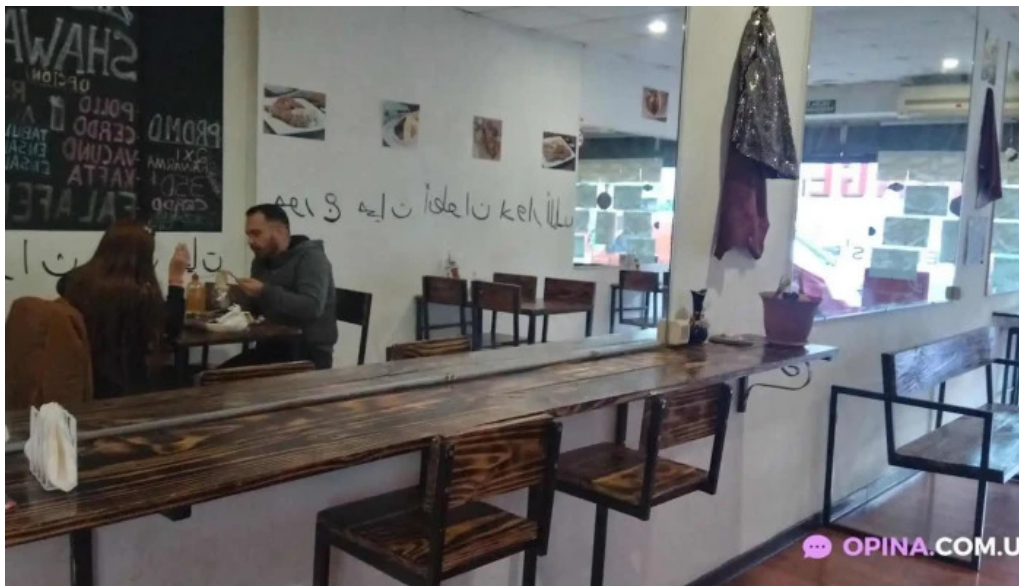
El palacio del falafel bar