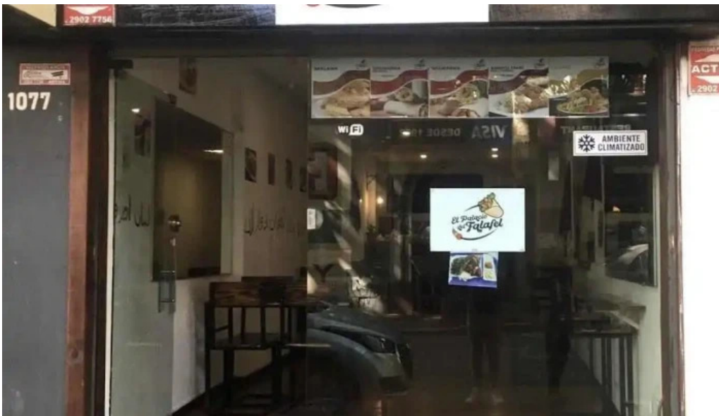
El palacio del falafel del propietario