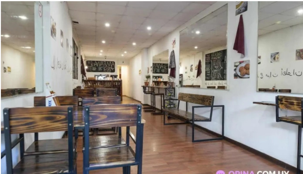
El palacio del falafel montevideo