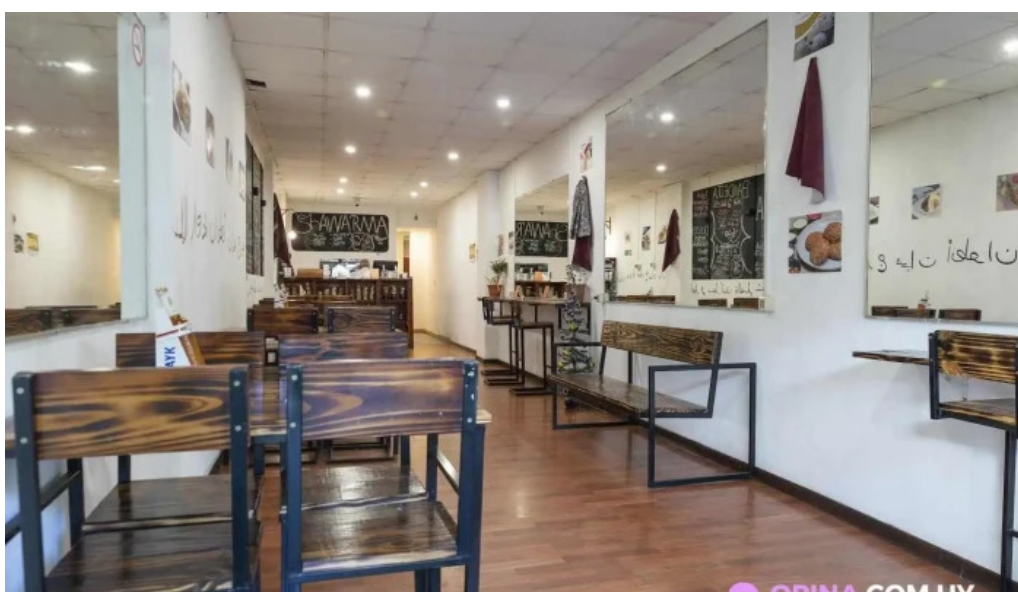
El palacio del falafel todas