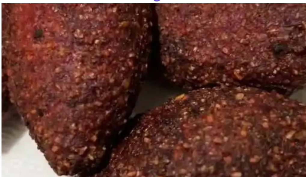
El palacio del falafel videos