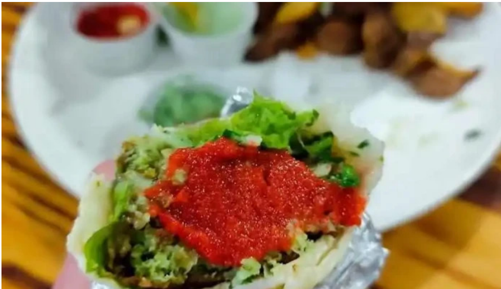
El palacio del falafel mas recientes