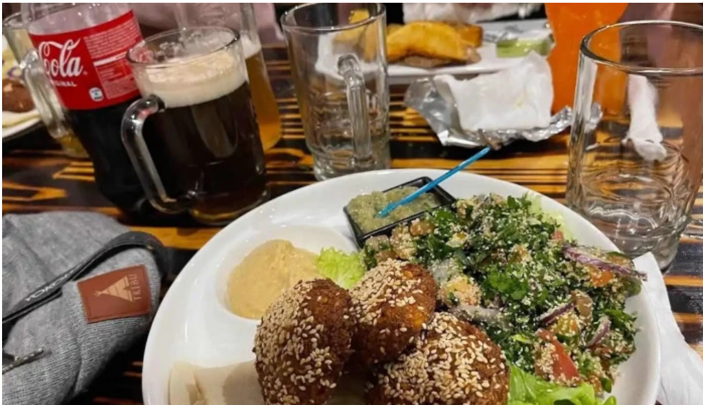
El palacio del falafel falafel