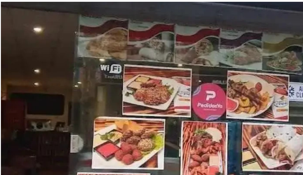
El palacio del falafel menu