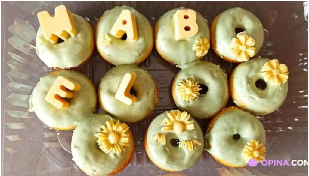
Dulce despertar todas