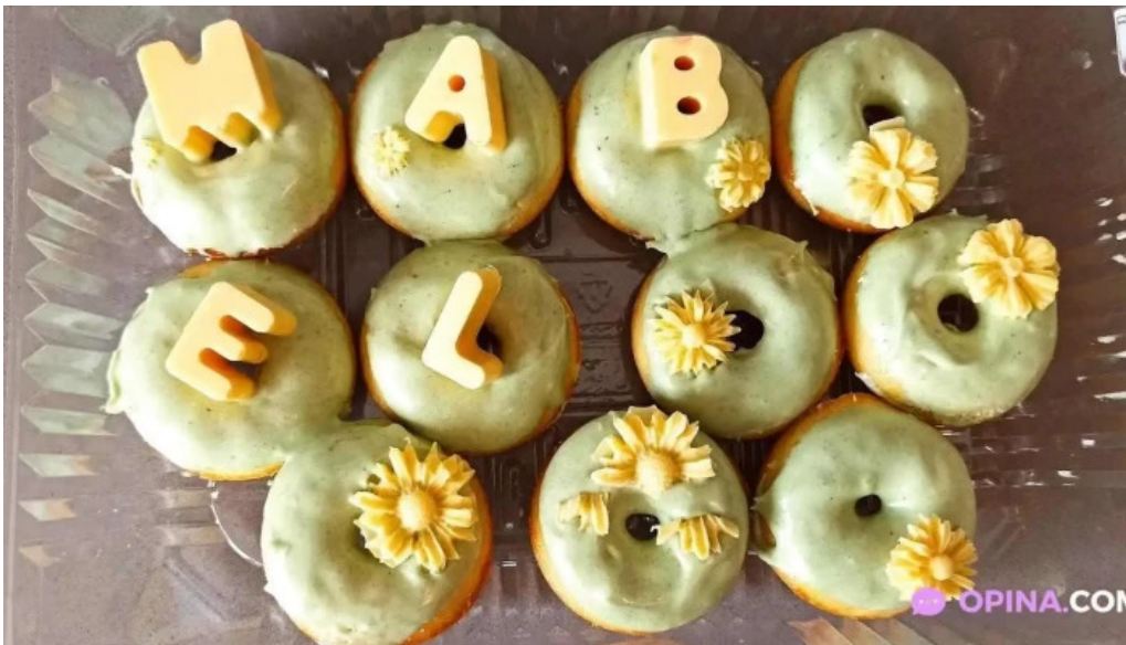
Dulce despertar villa argentina