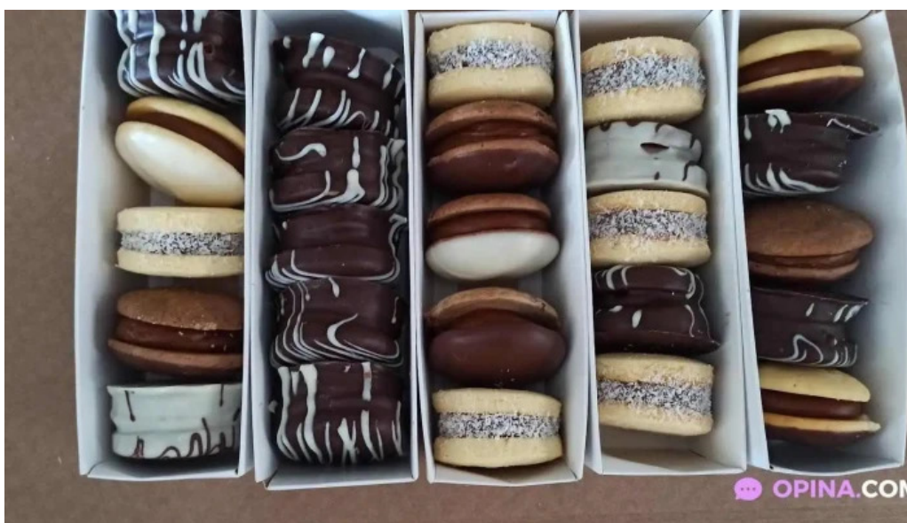
Dulce despertar comida y bebida