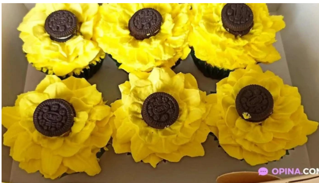
Dulce despertar del propietario