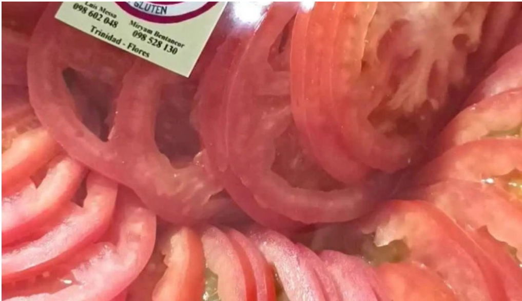
Lumiro sin gluten videos