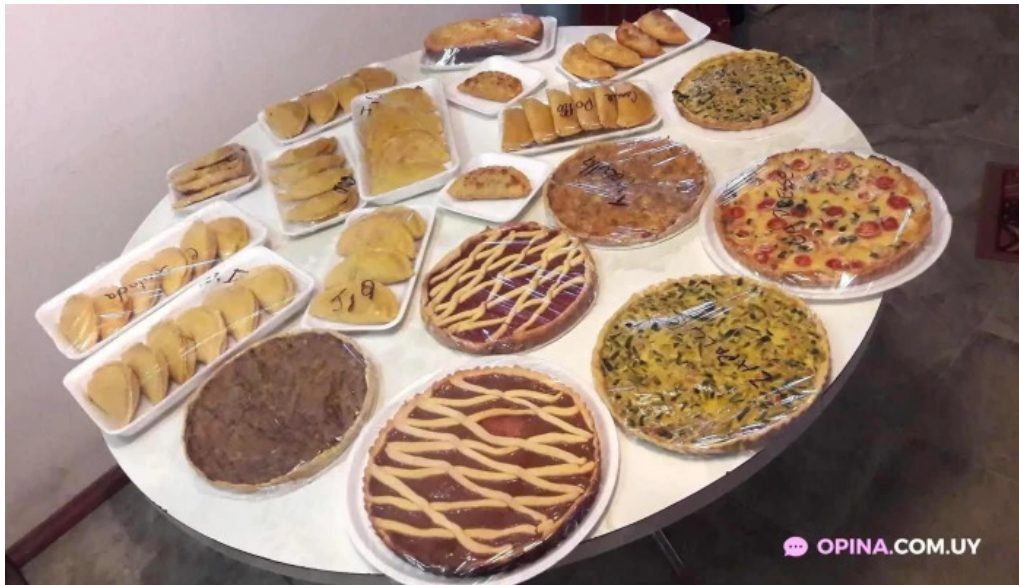
Lumiro sin gluten comidas y bebidas