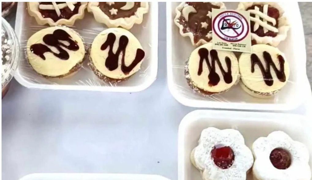
Lumiro sin gluten del propietario