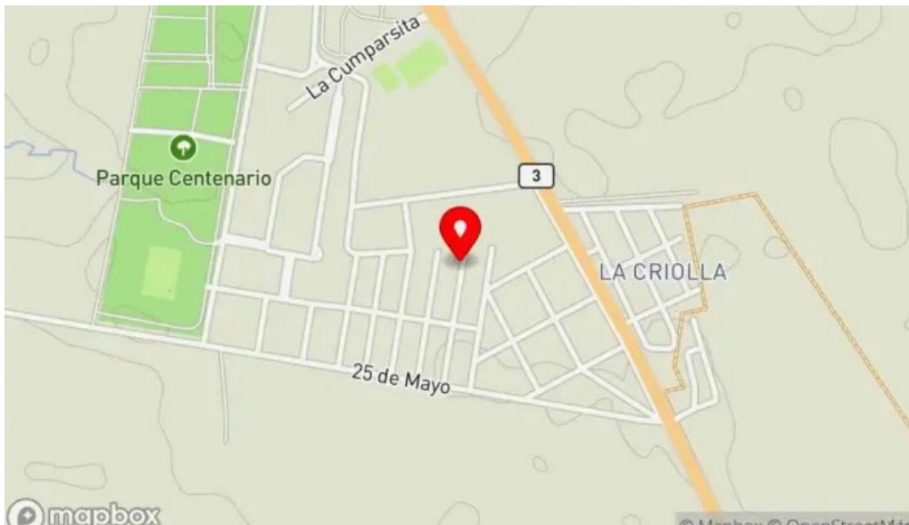
Lumiro sin gluten mapa