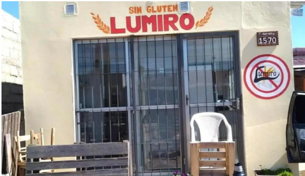
Lumiro sin gluten todo