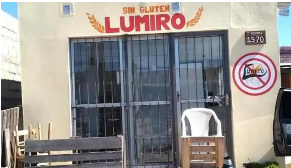
Lumiro sin gluten trinidad