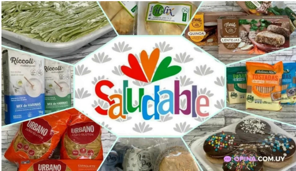
Restaurante saludable comida y bebida