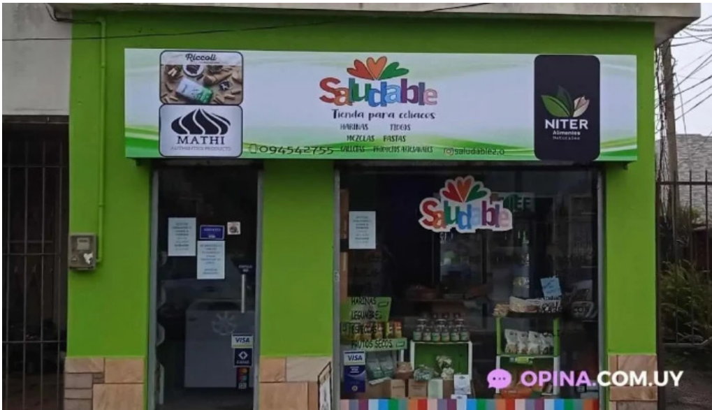
Restaurante saludable todas