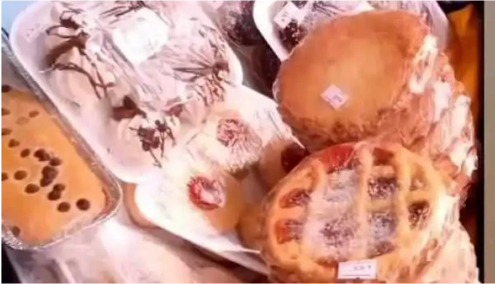
Restaurante saludable videos