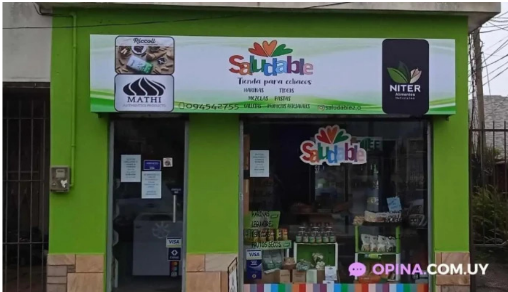
Restaurante saludable las piedras