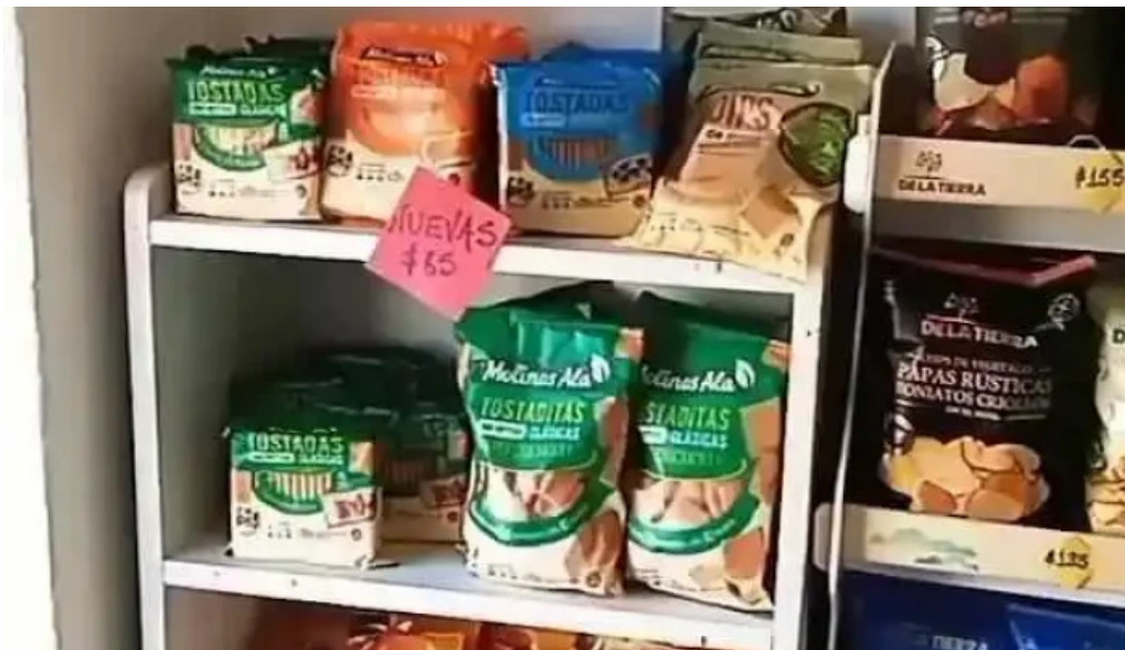
Restaurante saludable ambiente