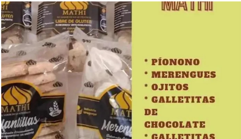
Restaurante saludable del propietario