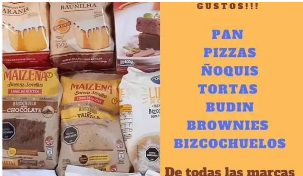
Restaurante saludable menu