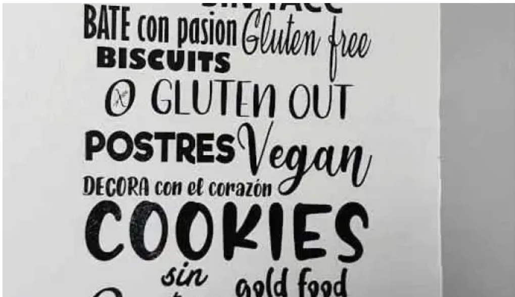
Gluten out menu