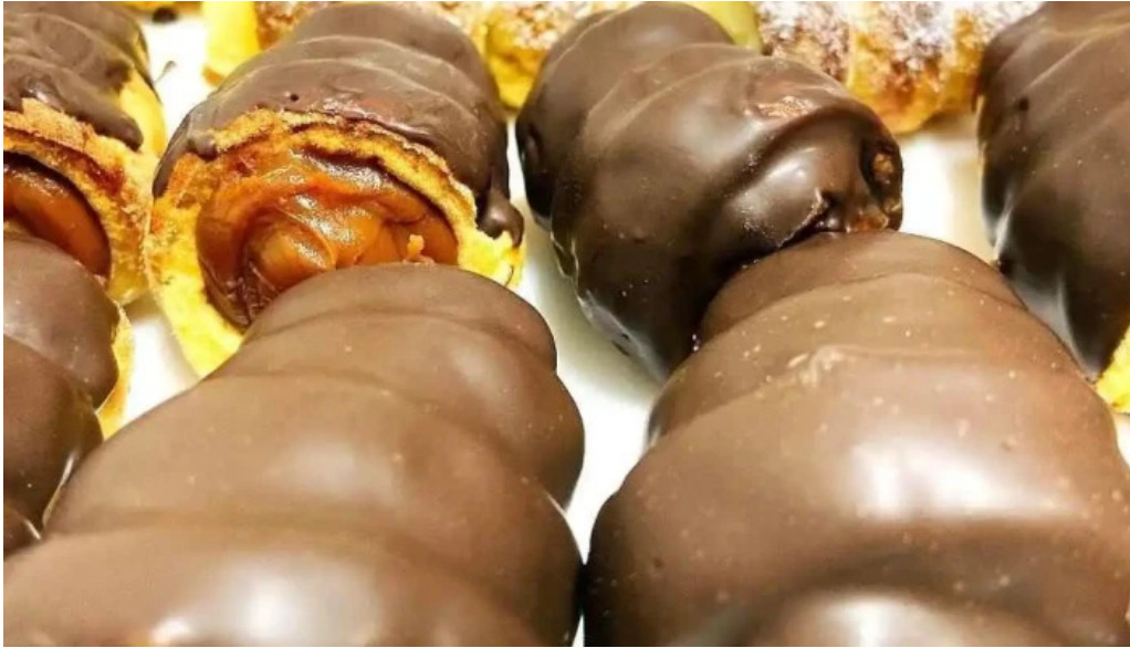
Gluten out del propietario