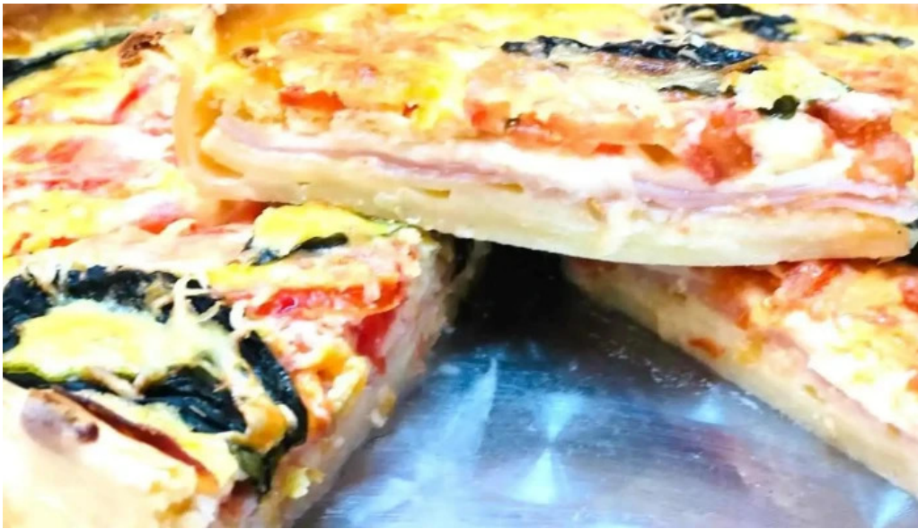
Gluten out quiche