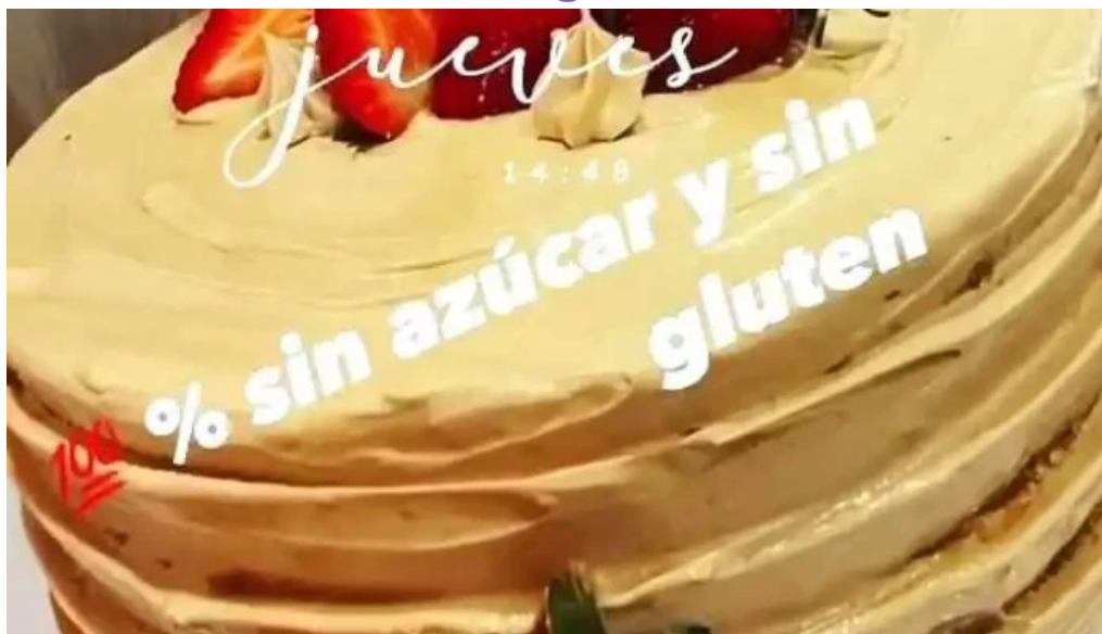
Gluten out videos