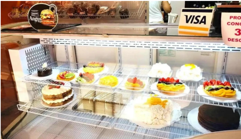
Gluten out minas