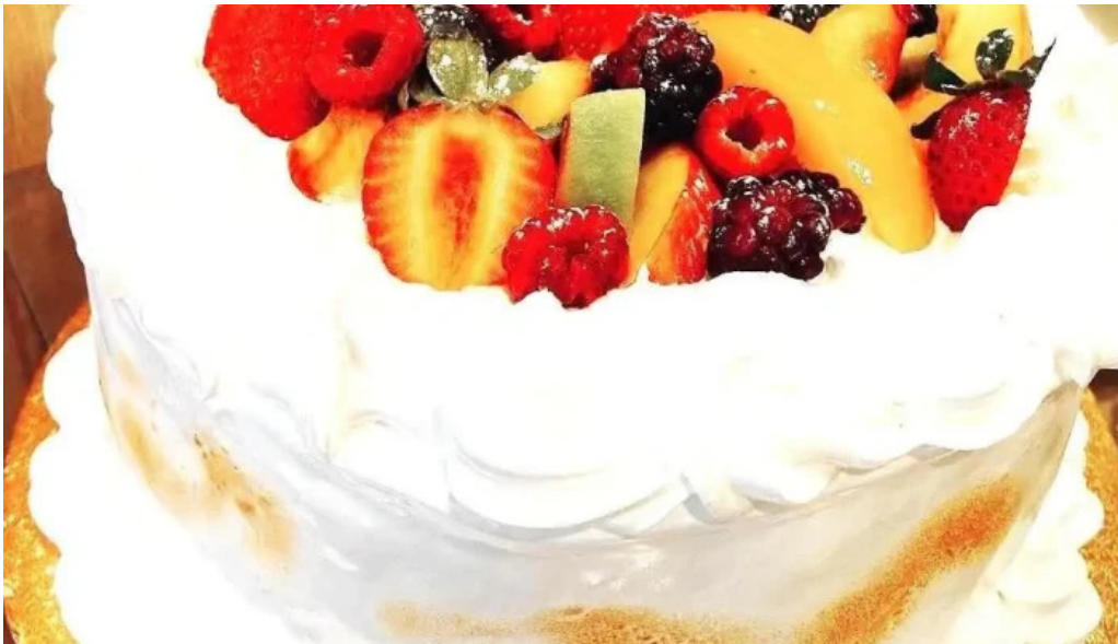
Gluten out comida y bebida