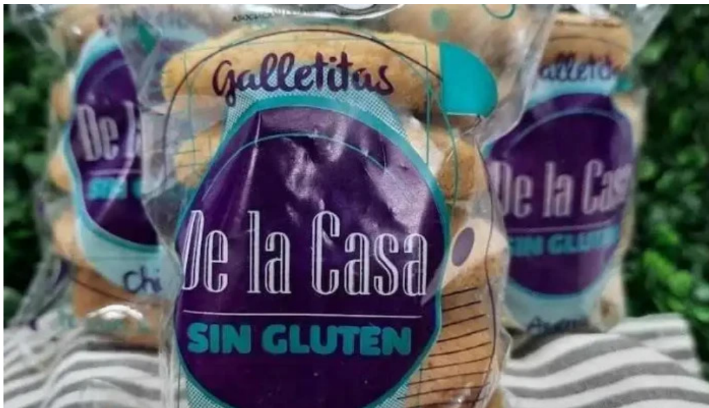
De la casa sin gluten comida y bebida