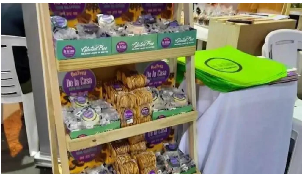
De la casa sin gluten ambiente