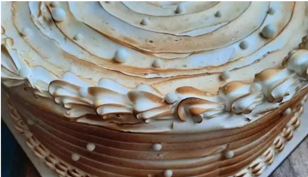
De la casa sin gluten paysandu