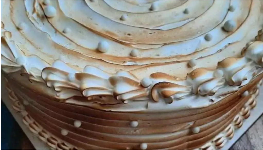
De la casa sin gluten todas