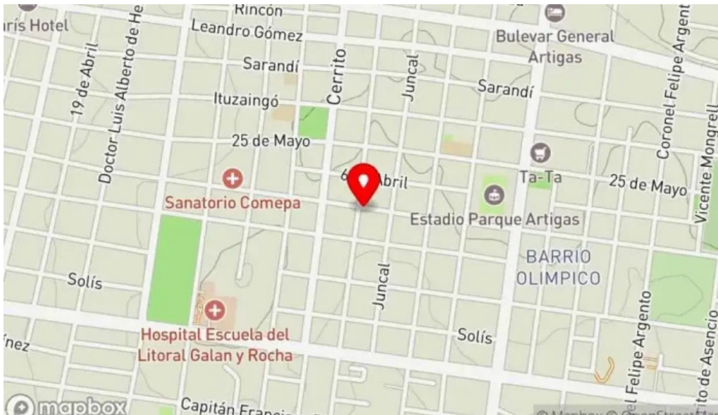
De la casa sin gluten mapa