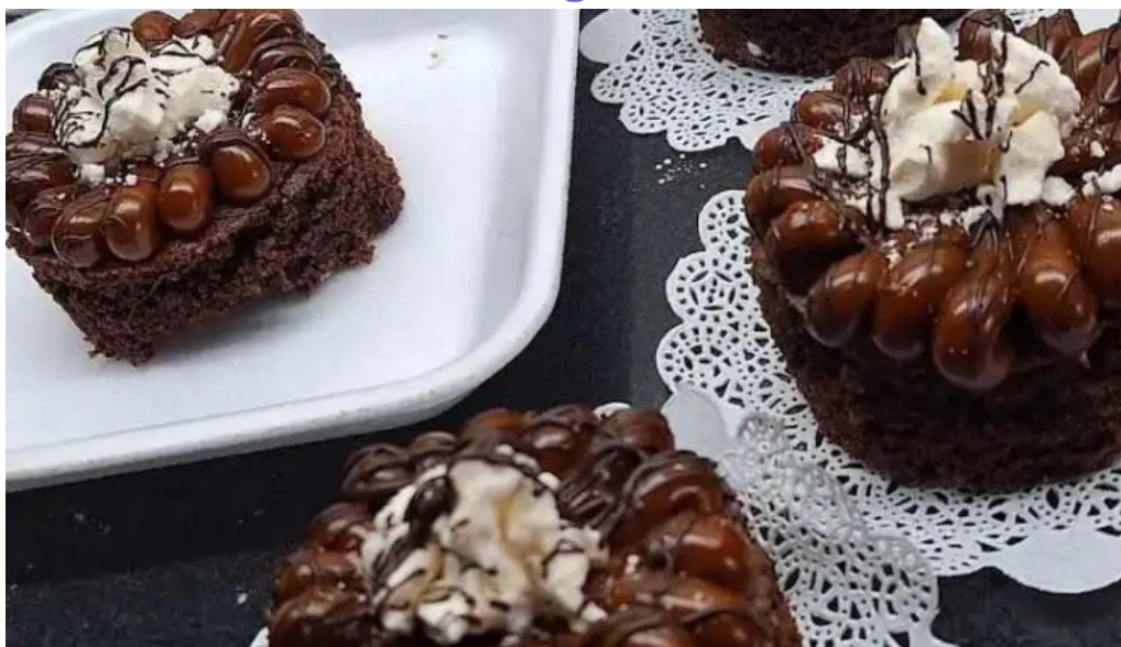
Comidas sin tacc perdomo todas