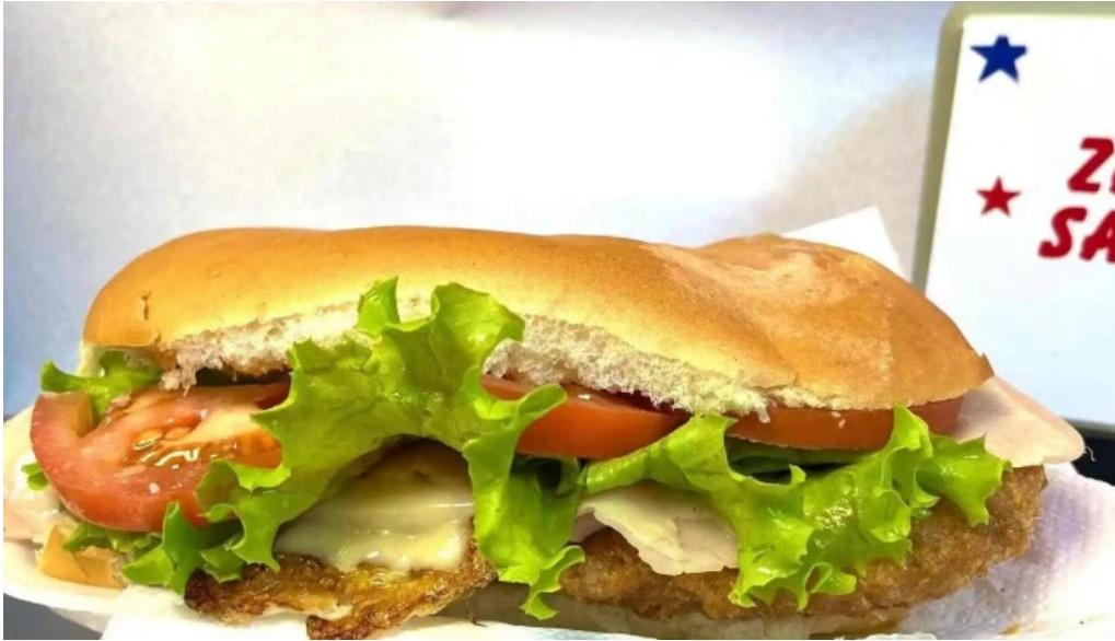
Za za sabor terminal comidas y bebidas