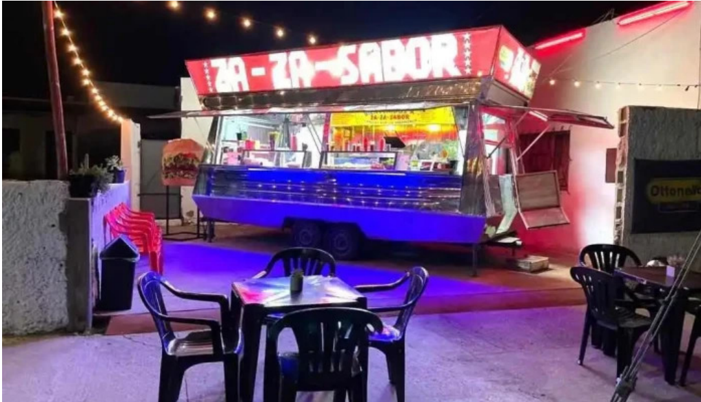
Za za sabor terminal ambiente