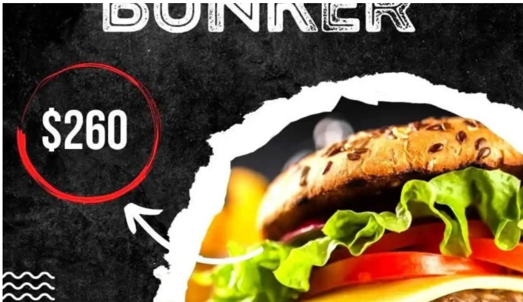
Za za sabor terminal hamburguesa