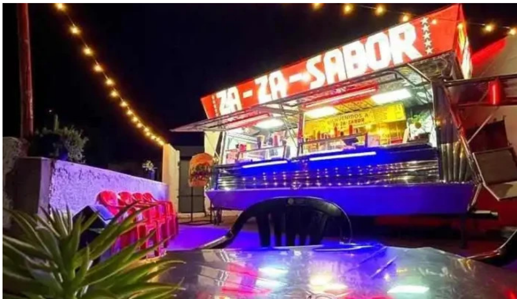
Za za sabor terminal del propietario