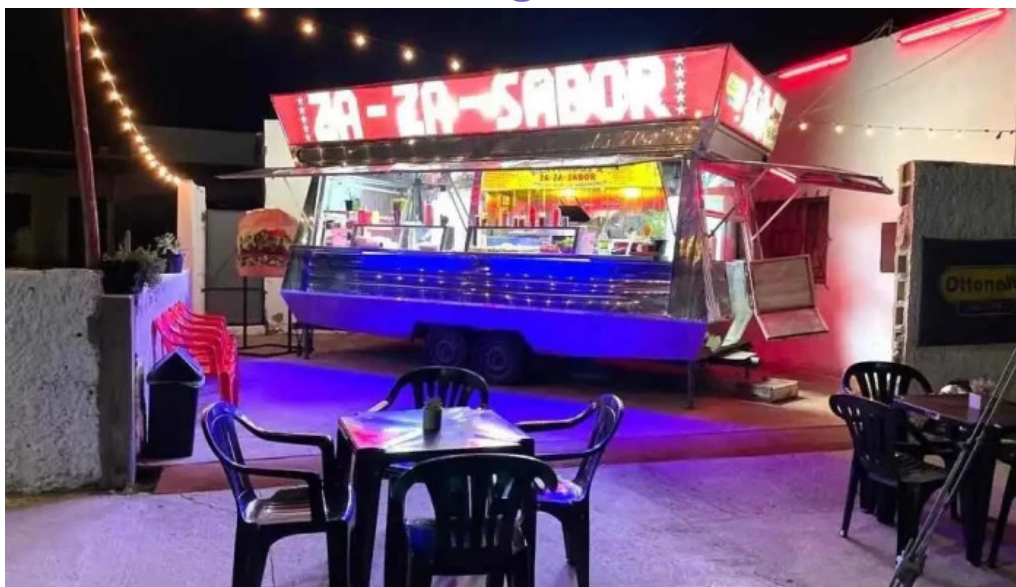
Za za sabor terminal todo