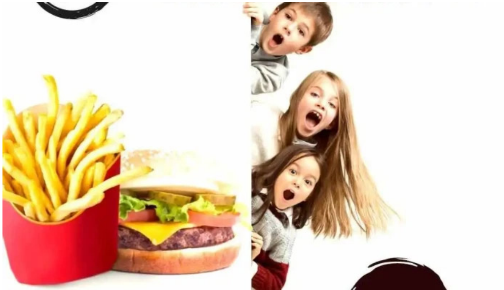
Za za sabor terminal papas fritas