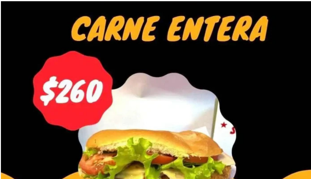
Za za sabor terminal comida reconfortante