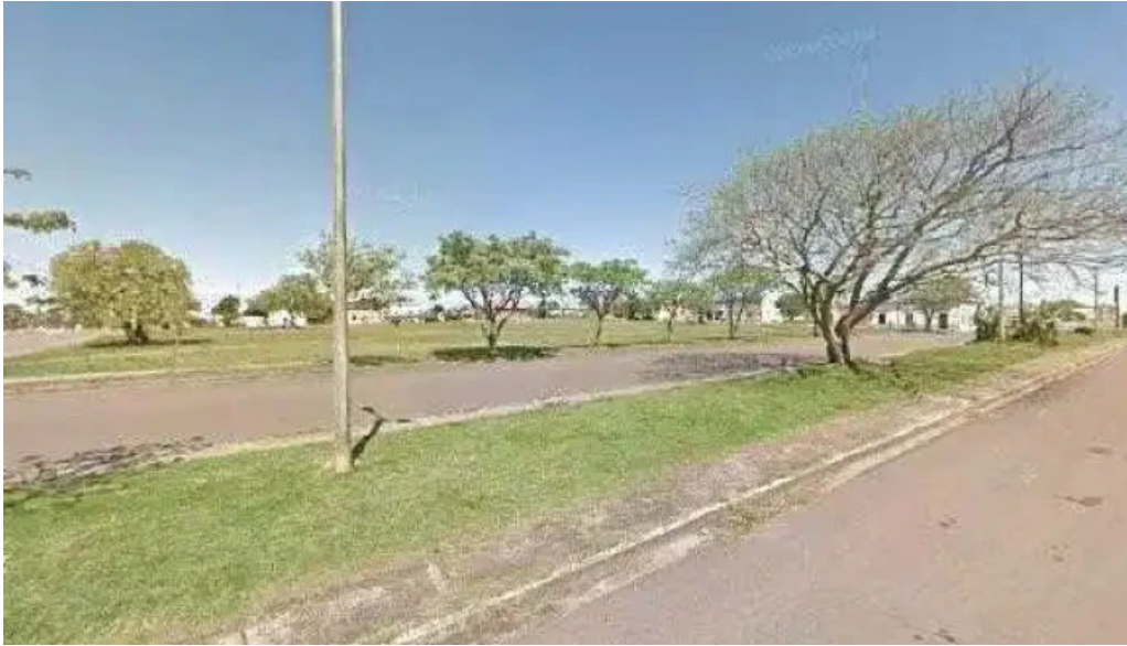
Za za sabor terminal street view y 360