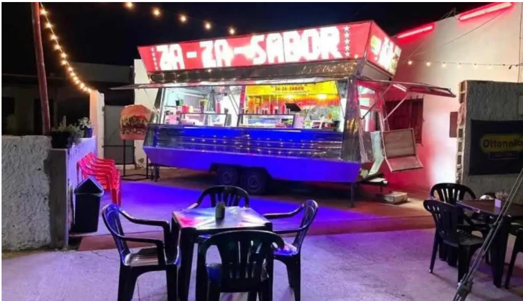
Za za sabor terminal paso de los toros