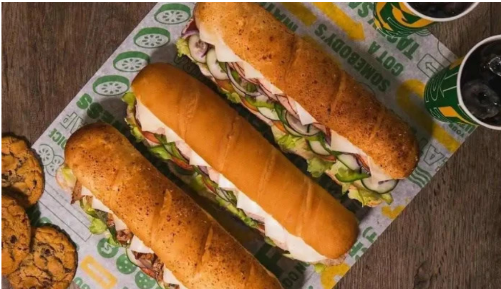
Subway comida reconfortante