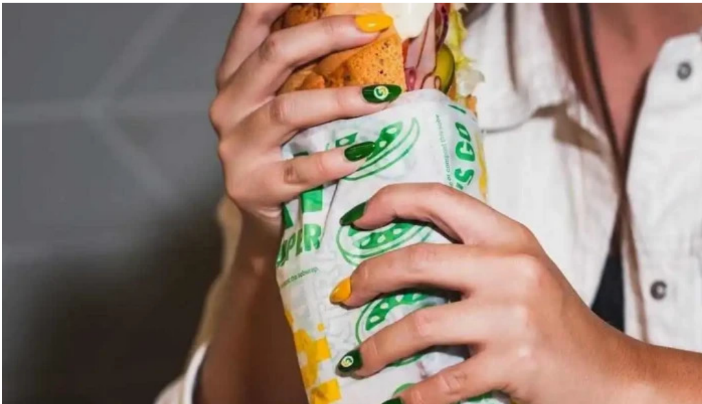
Subway del propietario