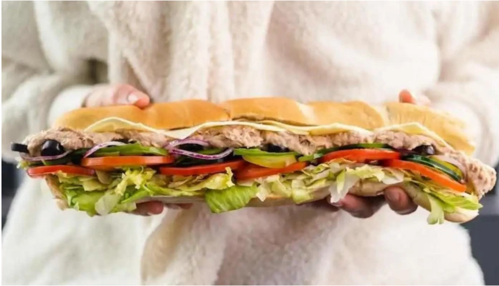
Subway comida y bebida