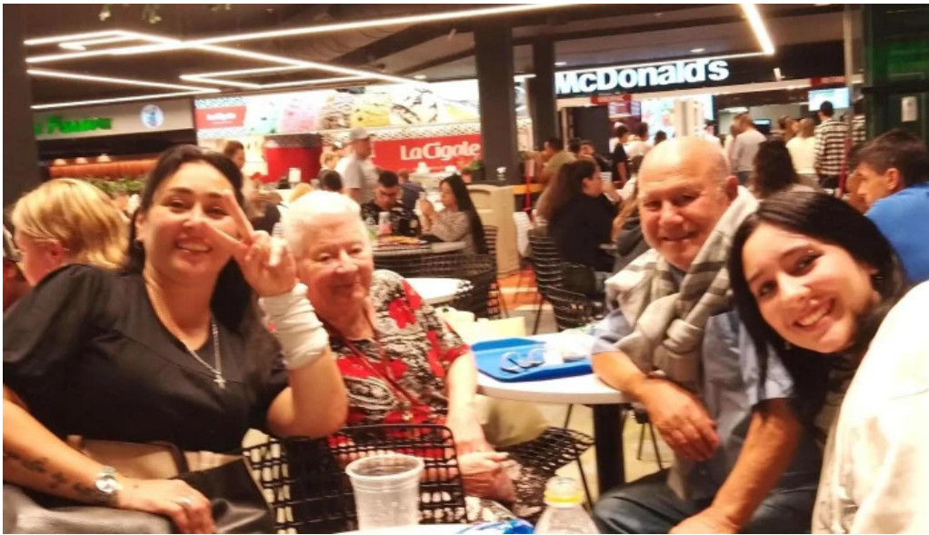
Subway comentario 8