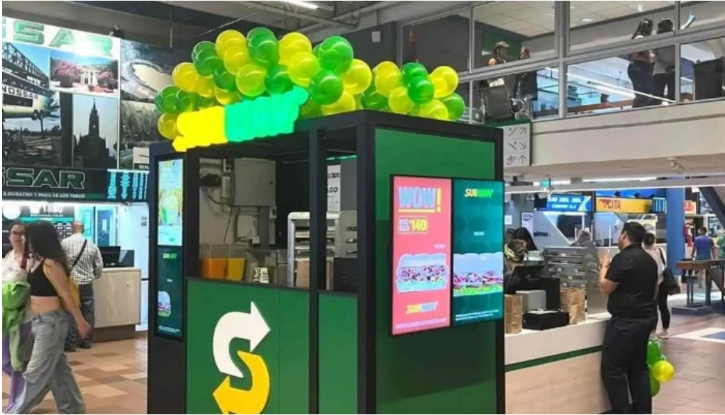
Subway del propietario