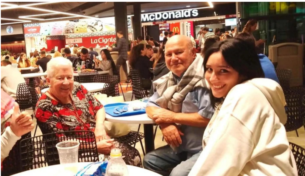
Subway comentario 7