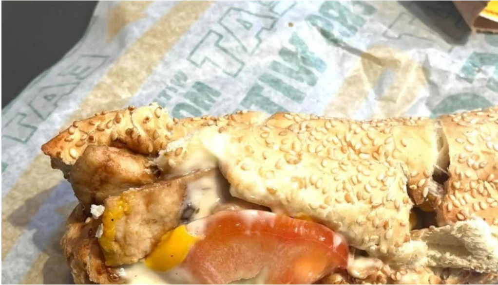
Subway comentario 2