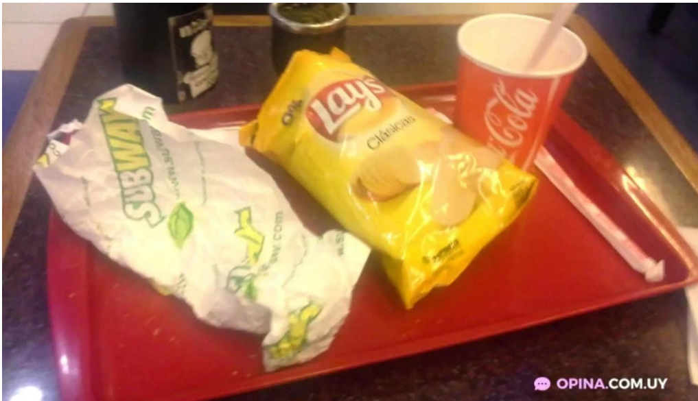
Subway comida reconfortante