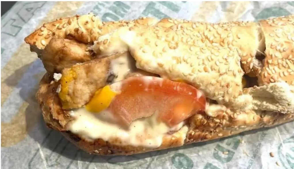
Subway comidas y bebidas