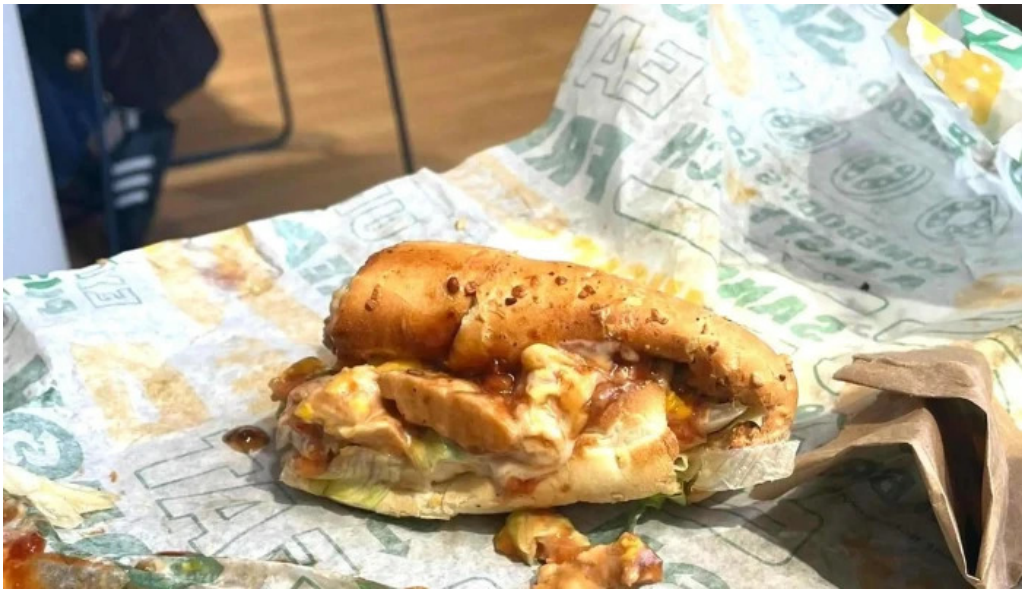
Subway comentario 1