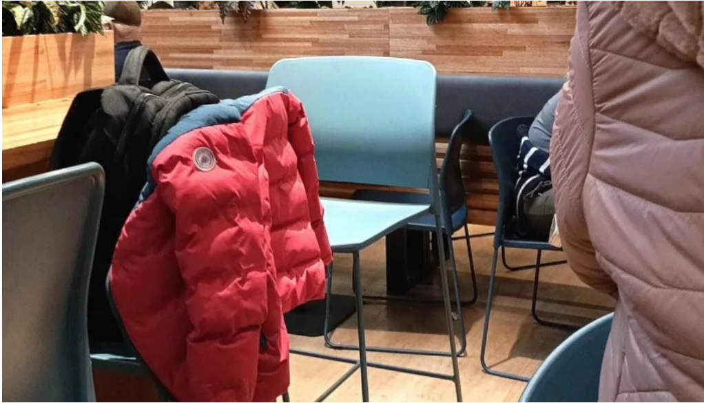
Subway comentario 4