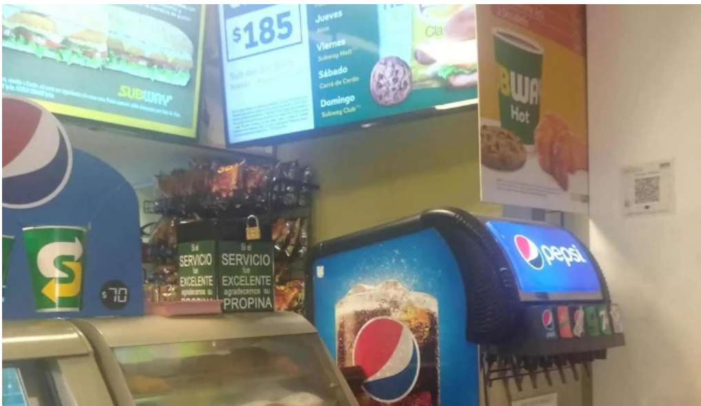
Subway comentario 5