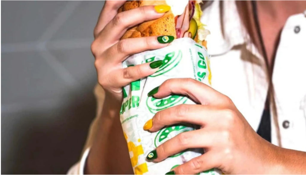
Subway del propietario