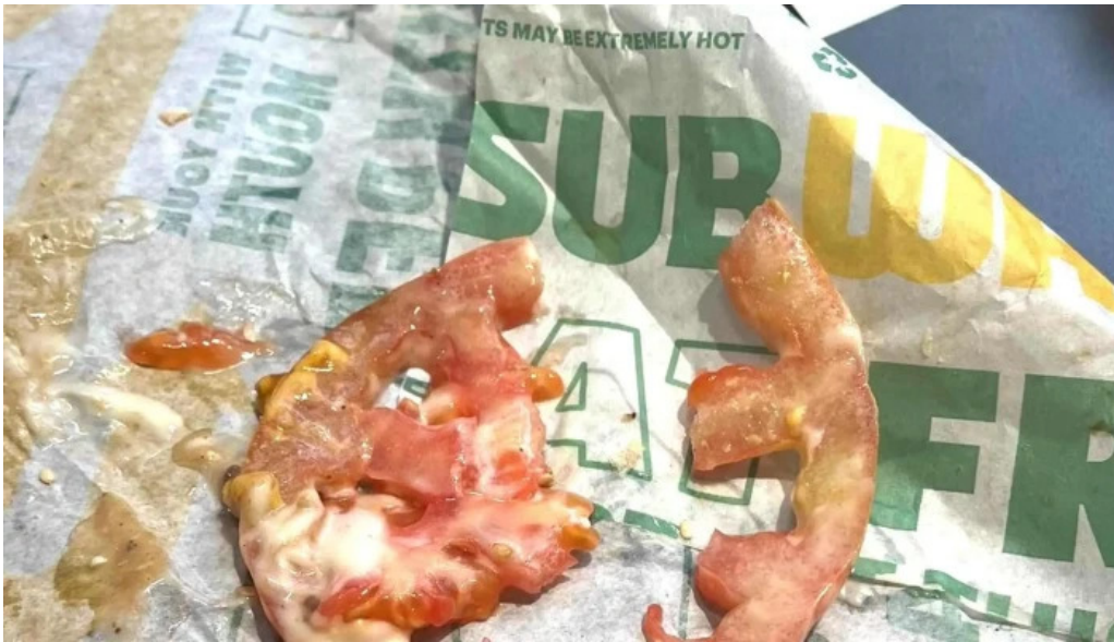
Subway comentario 3