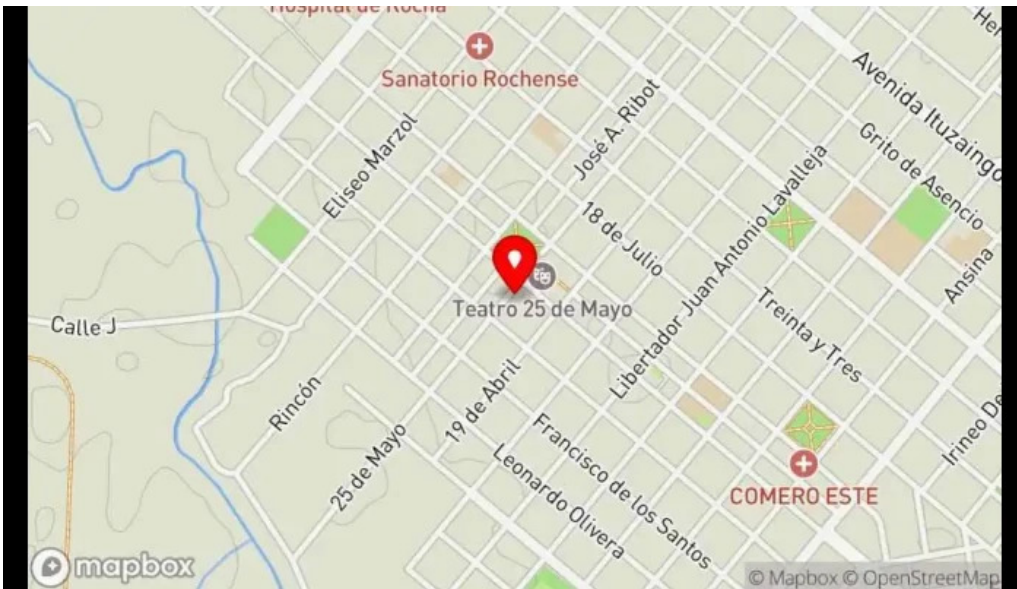
La cocina mapa