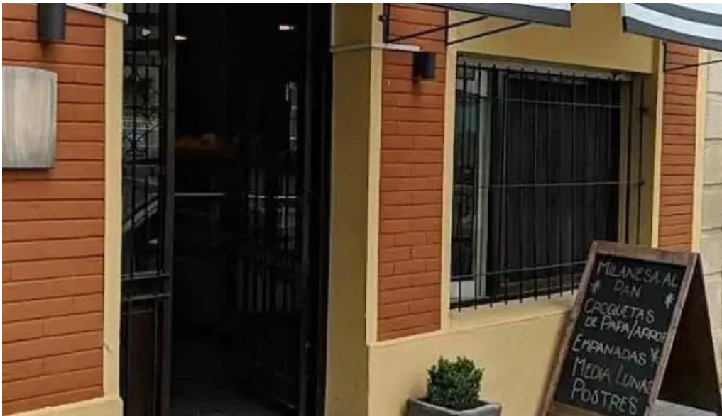
La cocina rocha