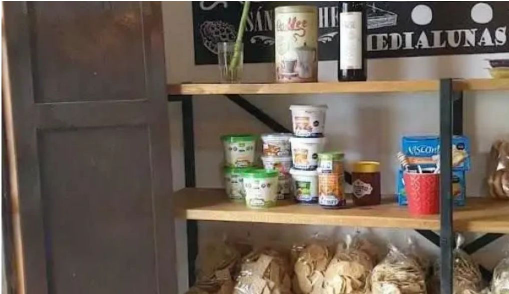
La cocina videos