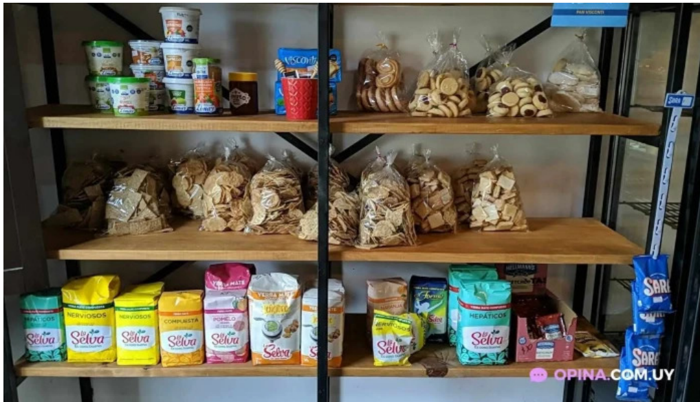
La cocina ambiente