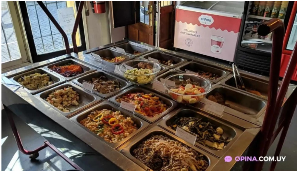
La cocina comida y bebida