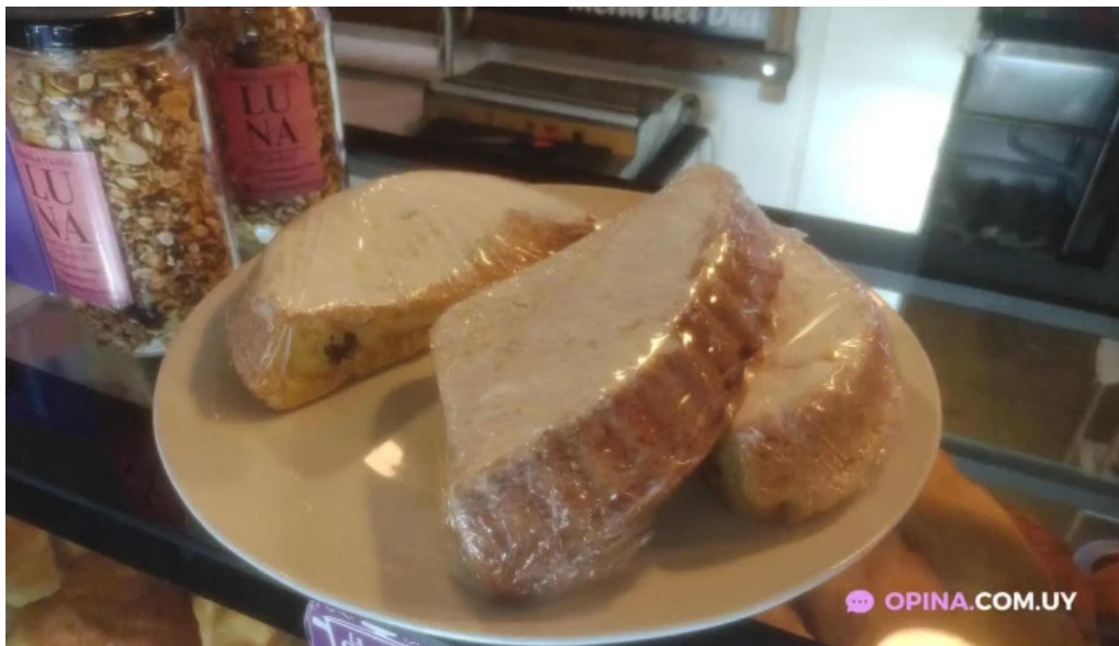
La cocina comida reconfortante