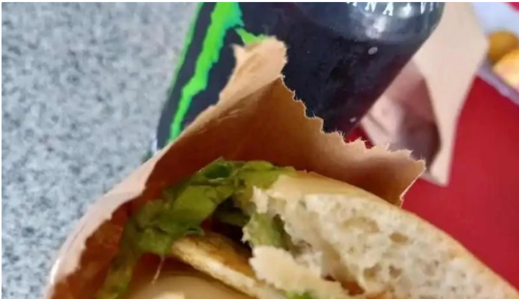
Ro ni mat comida y bebida