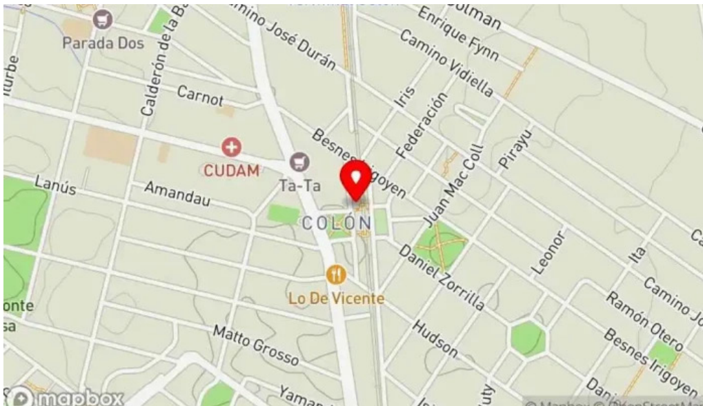
Ro ni mat mapa