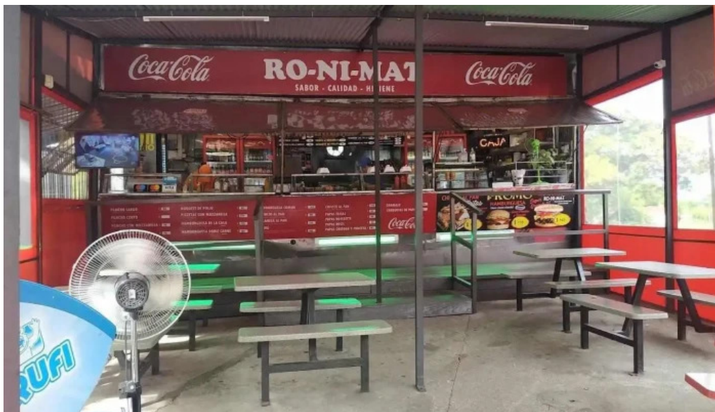
Ro ni mat montevideo