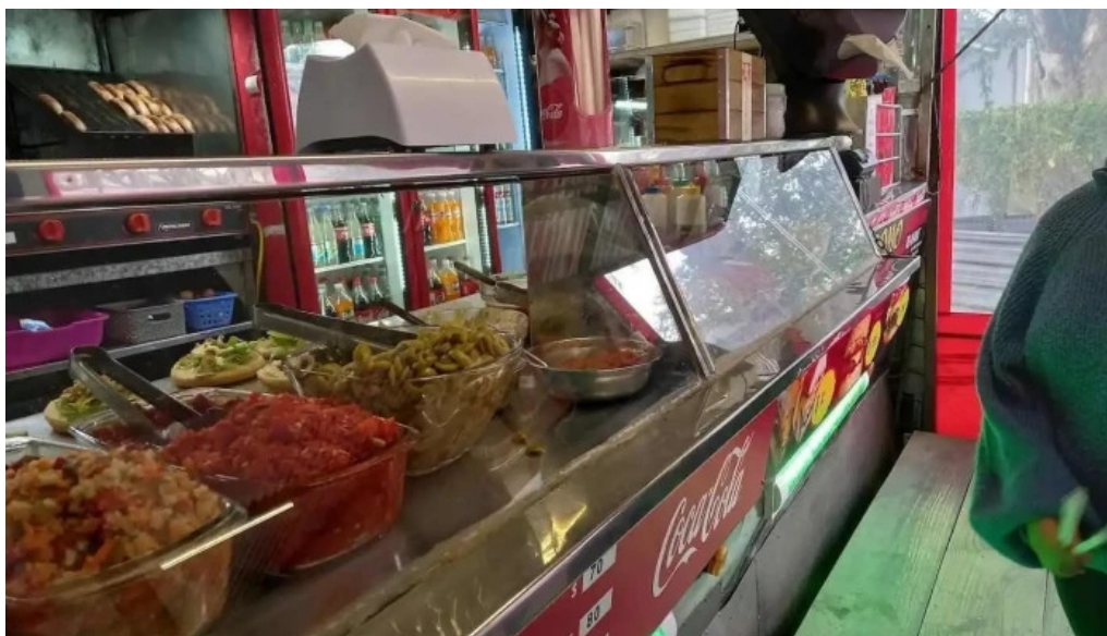
Ro ni mat ambiente