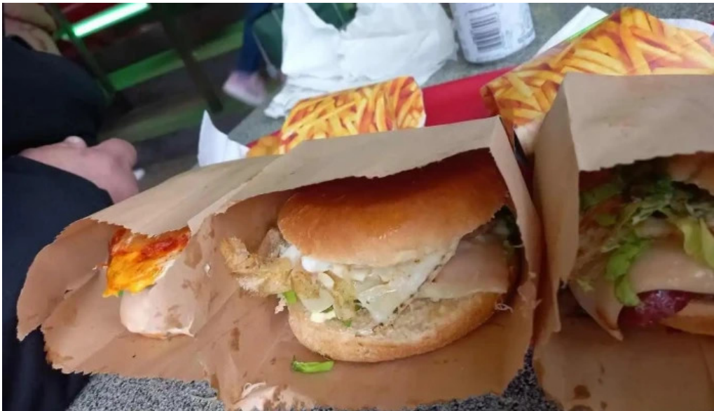
Ro ni mat comida reconfortante