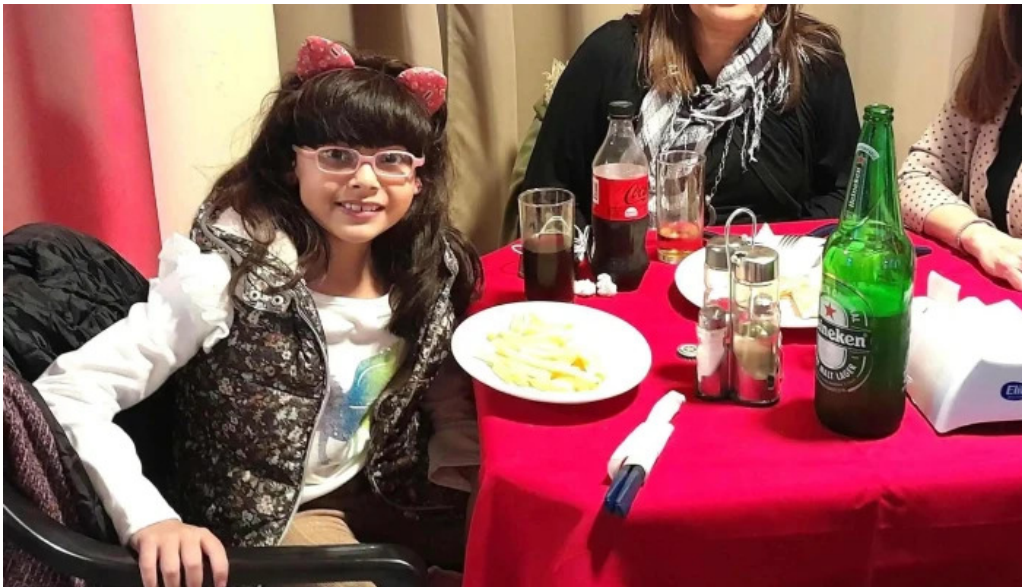
Restaurante parador municipal comentario 4