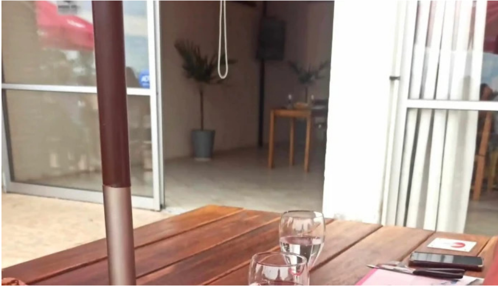
Restaurante parador municipal comentario 9