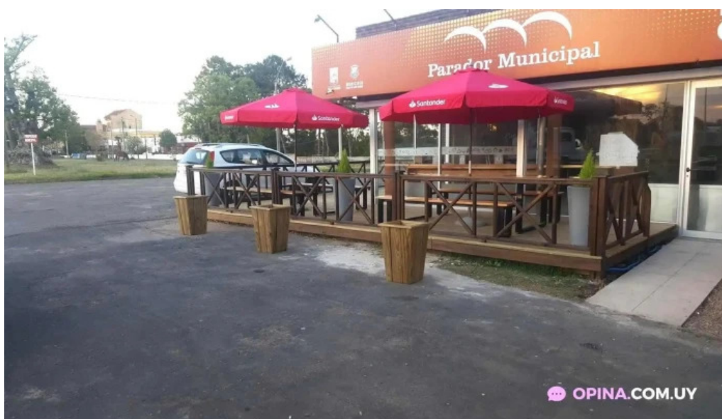
Restaurante parador municipal paso de los toros