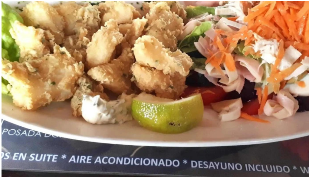
Restaurante parador municipal comentario 7