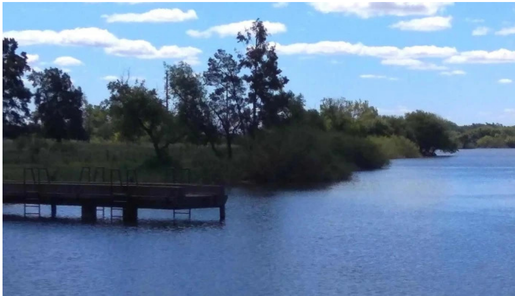
Restaurante parador municipal comentario 6