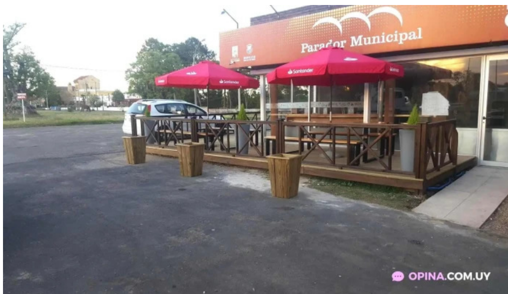
Restaurante parador municipal todo