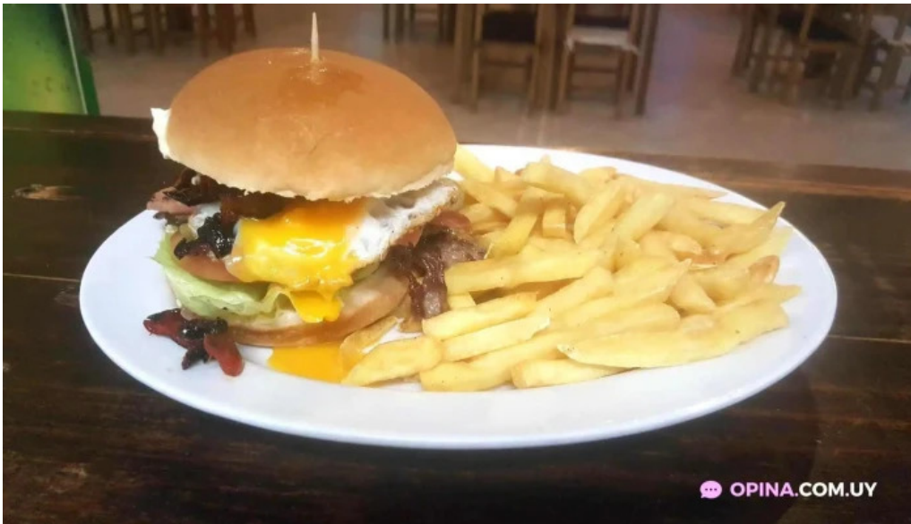
Restaurante parador municipal del propietario