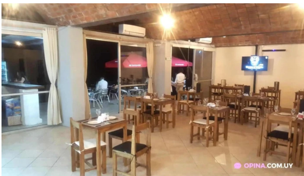
Restaurante parador municipal ambiente