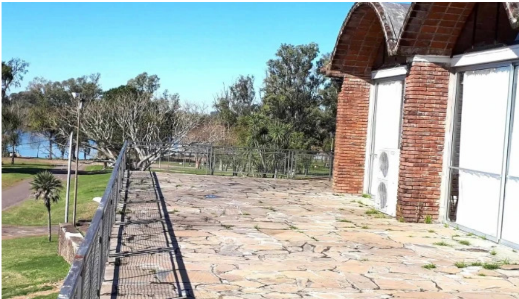
Restaurante parador municipal comentario 8