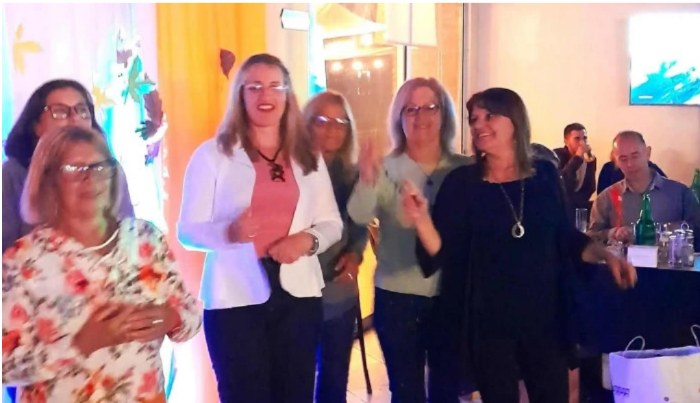
Restaurante parador municipal comentario 2