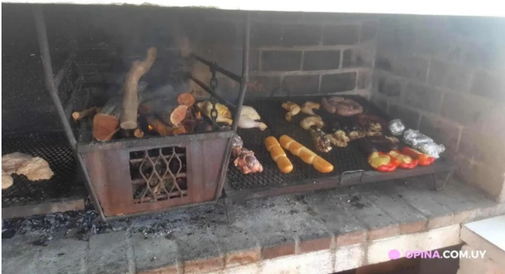
Restaurante parador municipal comidas y bebidas