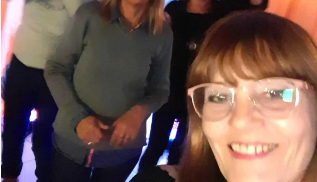
Restaurante parador municipal comentario 3