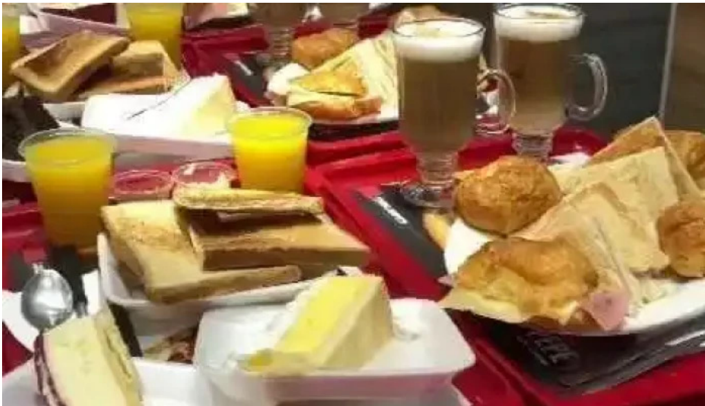
Restaurante lo de pepe comida y bebida