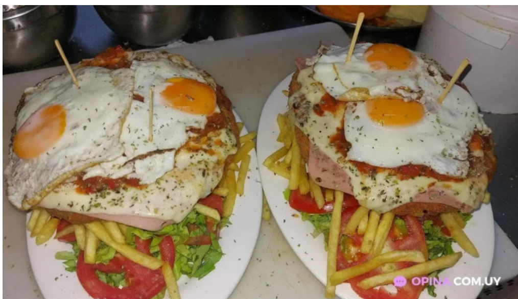
Restaurante lo de pepe comida reconfortante