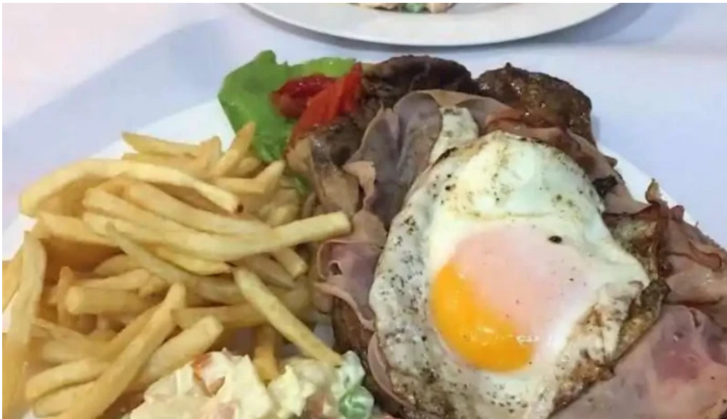
Restaurante lo de pepe papas fritas