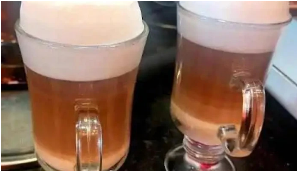
Restaurante lo de pepe del propietario