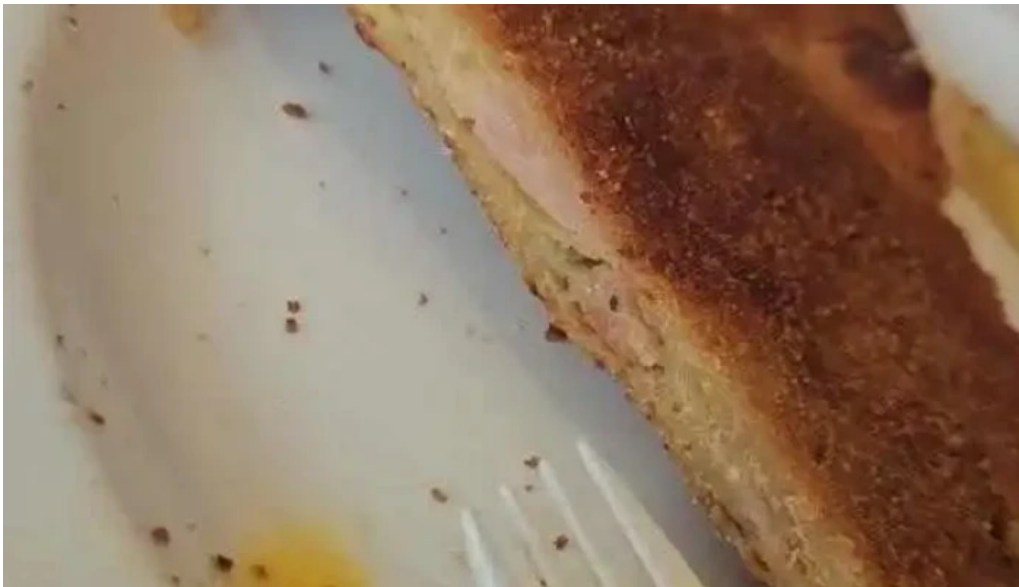
Restaurante lo de pepe mas recientes