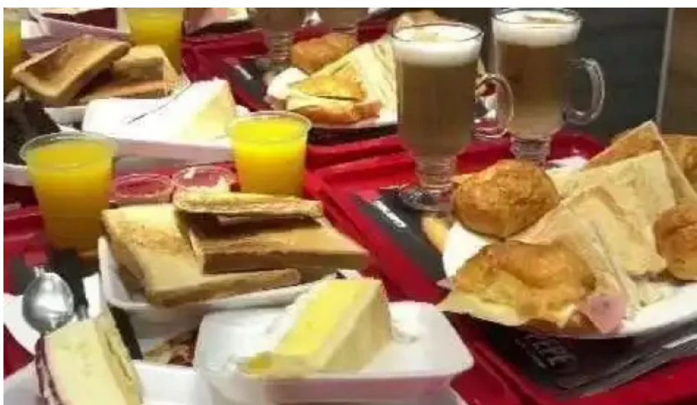
Restaurante lo de pepe ciudad de la costa