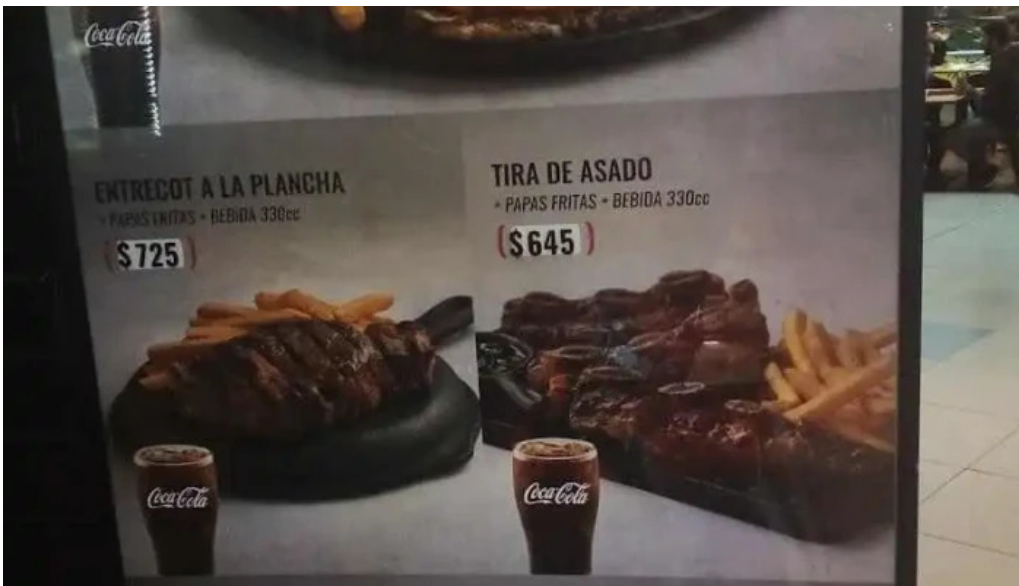
Restaurante lo de pepe menu