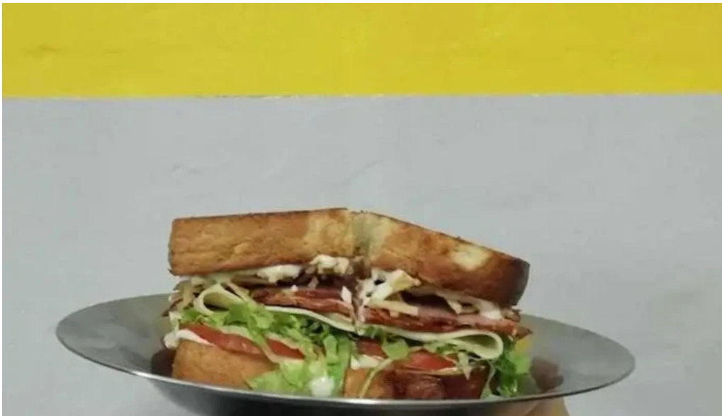
Republica rotiseria sandwich