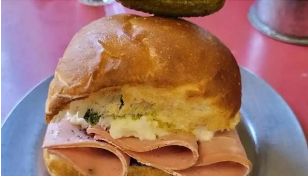
Republica rotiseria comida y bebida