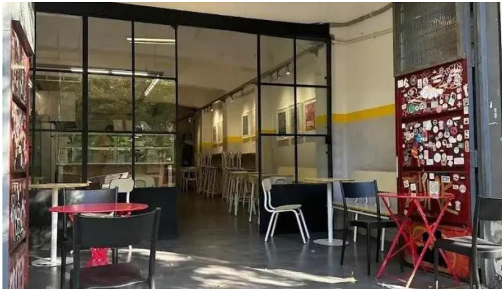
Republica rotiseria montevideo