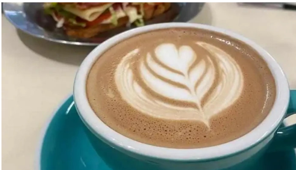
Republica rotiseria capuchino