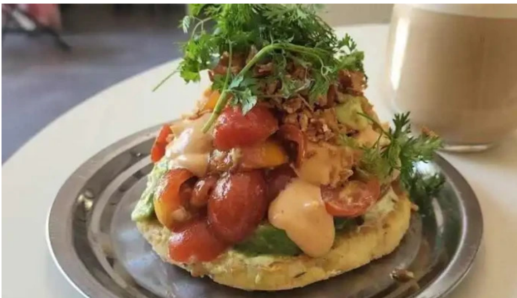
Republica rotiseria tortilla tostada