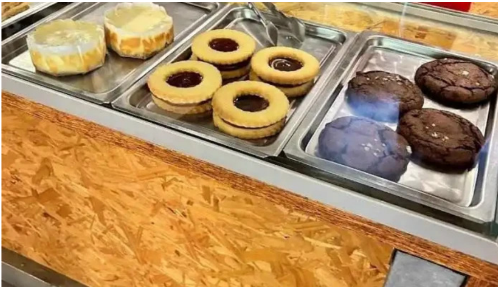
Republica rotiseria comida reconfortante