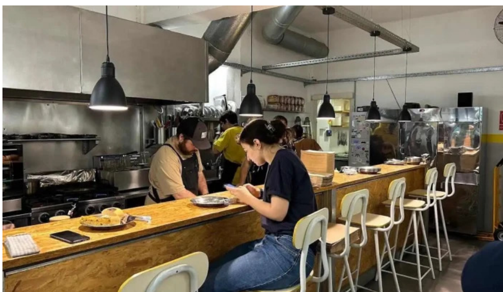
Republica rotiseria ambiente