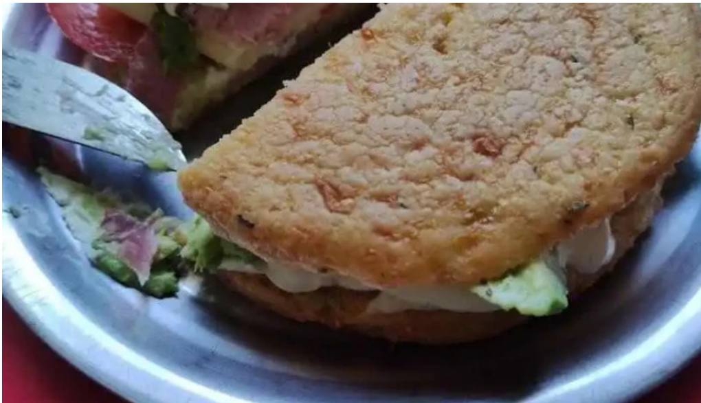
Republica rotiseria jugo