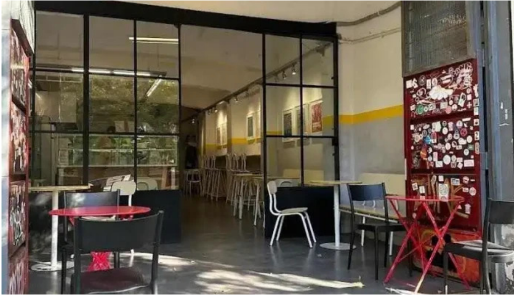
Republica rotiseria todas