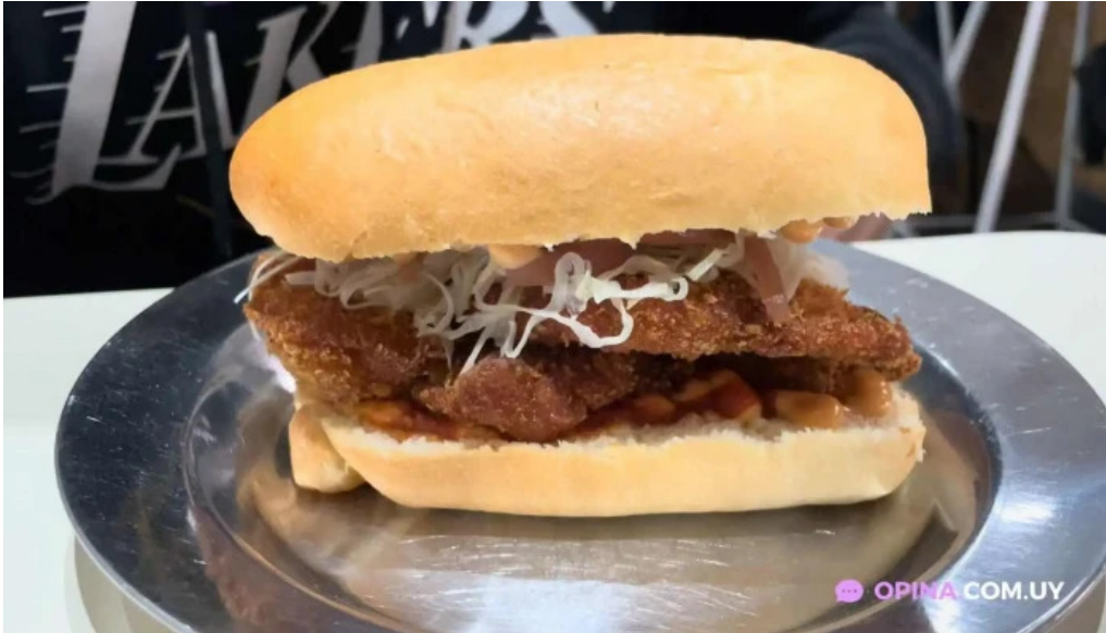
Republica rotiseria videos