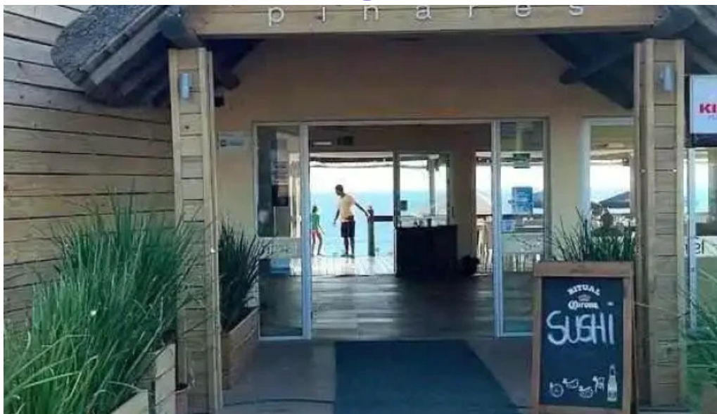
Parador scotiabank 31 de playa mansa videos