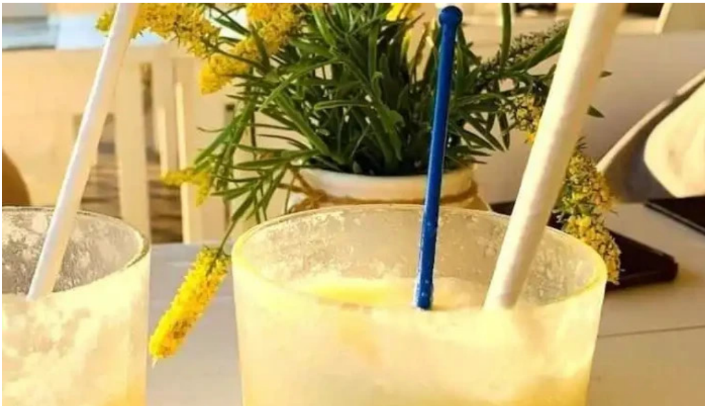
Parador scotiabank 31 de playa mansa comida y bebida