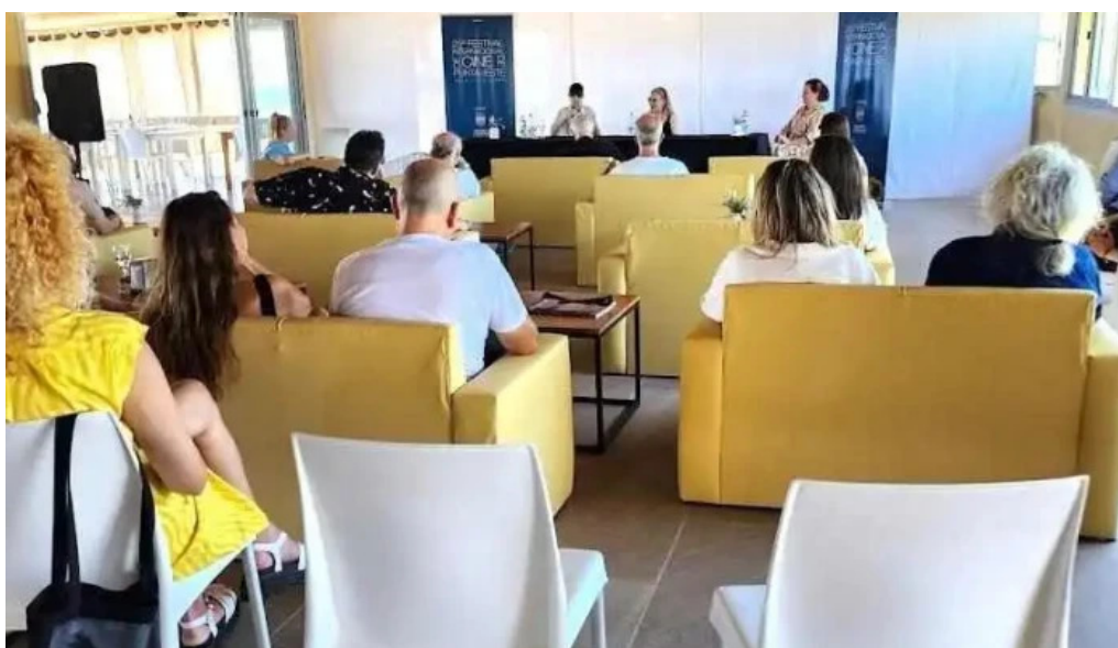
Parador scotiabank 31 de playa mansa ambiente