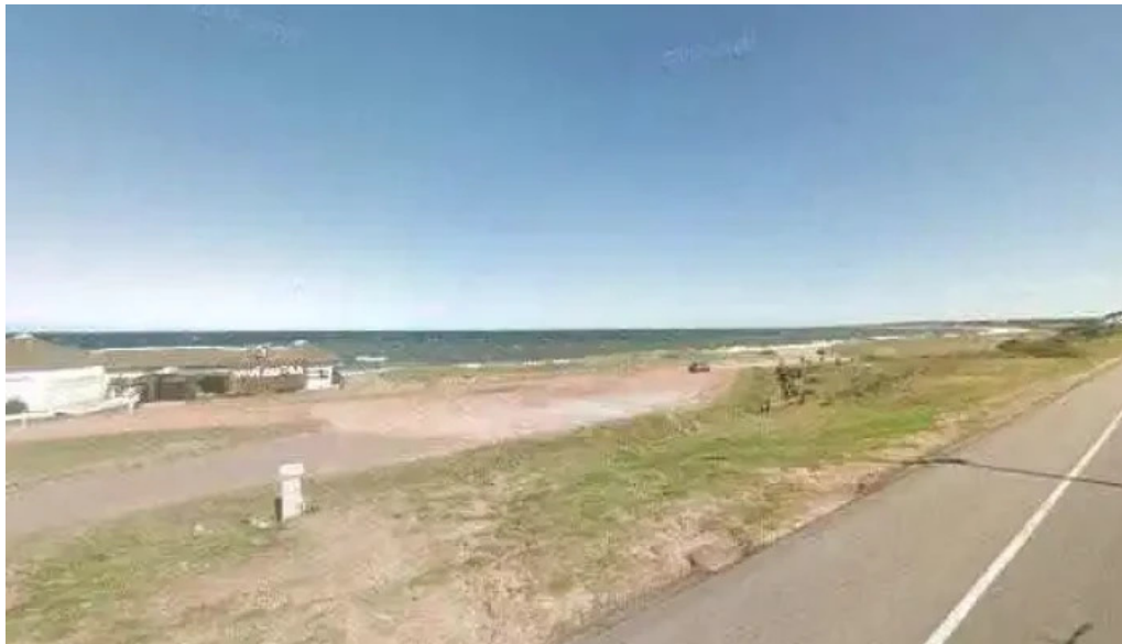
Parador scotiabank 31 de playa mansa street view y 360