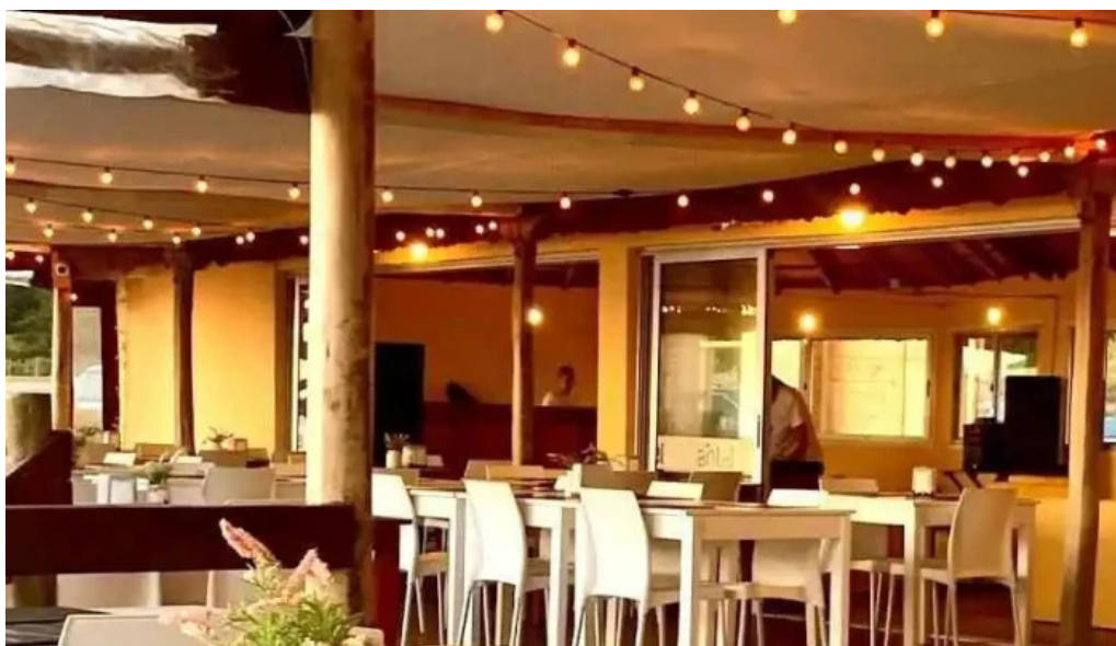
Parador scotiabank 31 de playa mansa todas