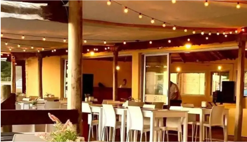
Parador scotiabank 31 de playa mansa maldonado