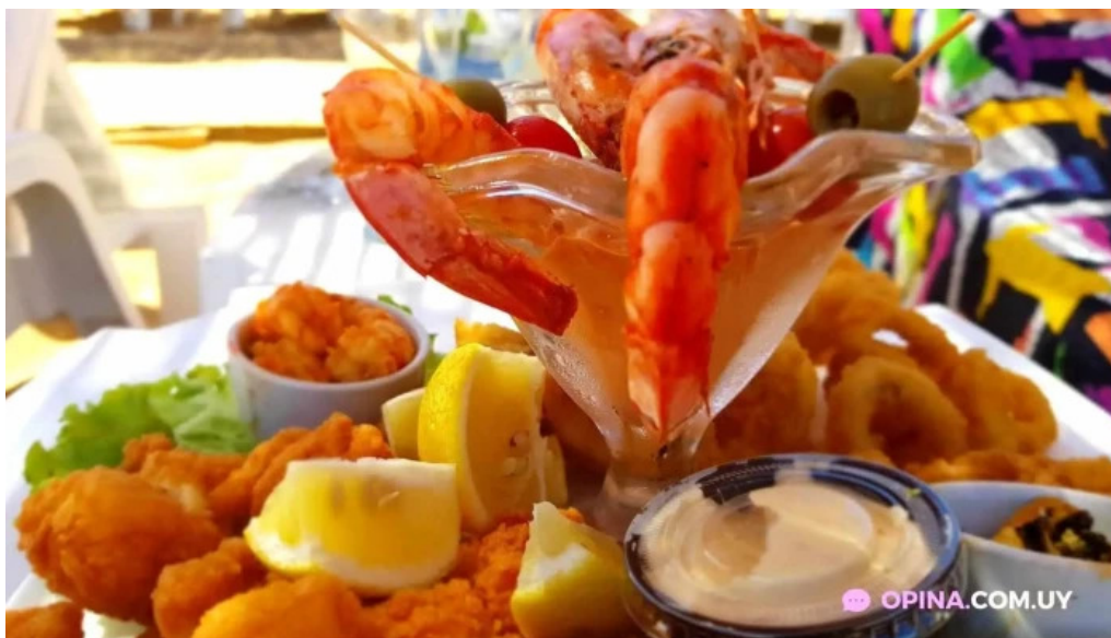
Parador scotiabank 31 de playa mansa comida de mar