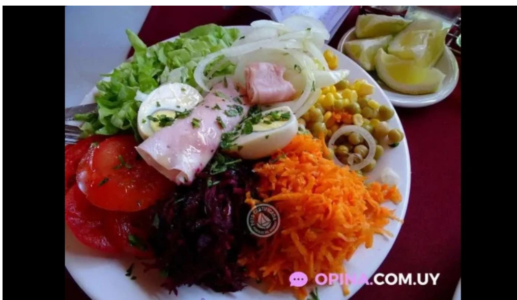
Parador maria esther comida y bebida