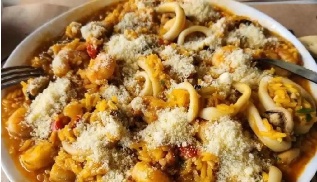
Parador maria esther comida reconfortante