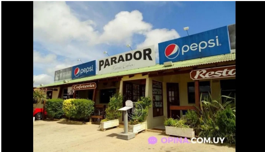
Parador maria esther todas