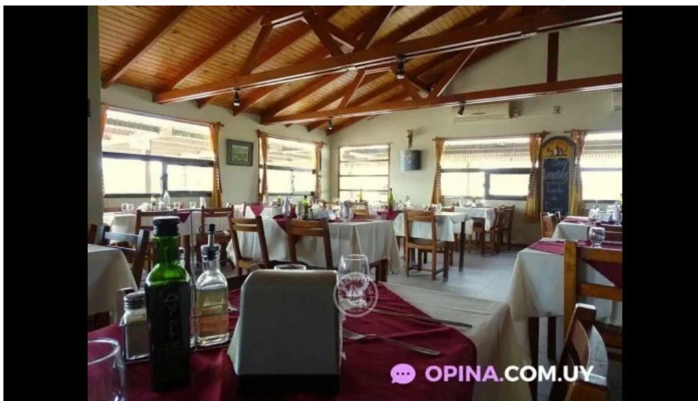
Parador maria esther del propietario