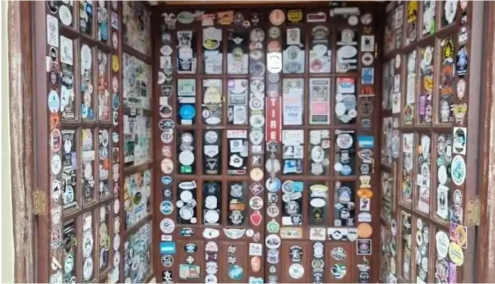
Parador maria esther mas recientes