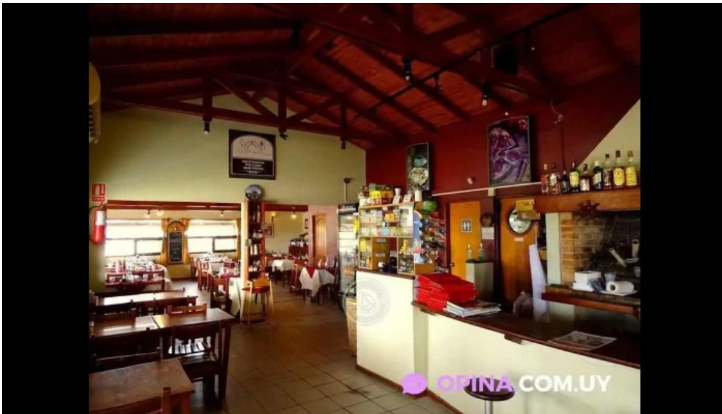
Parador maria esther ambiente