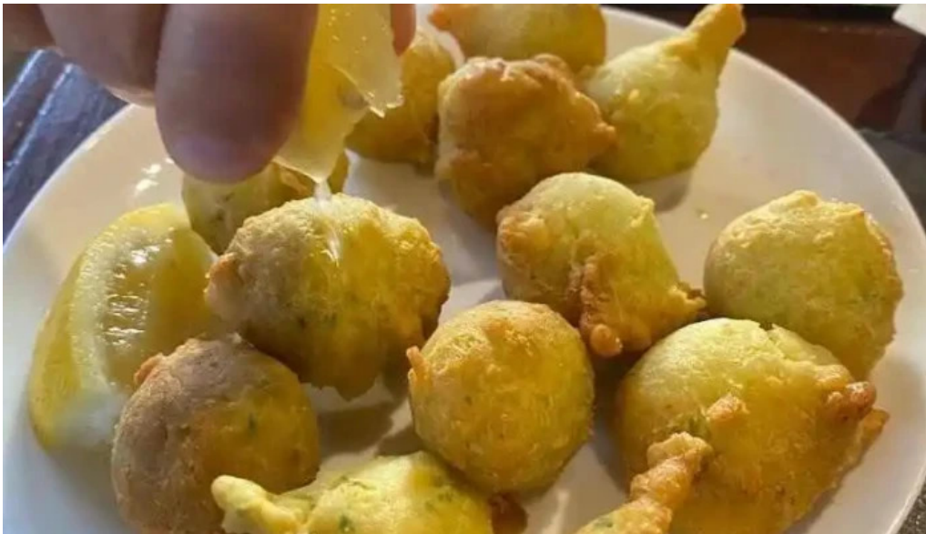
Parador maria esther quimbombo