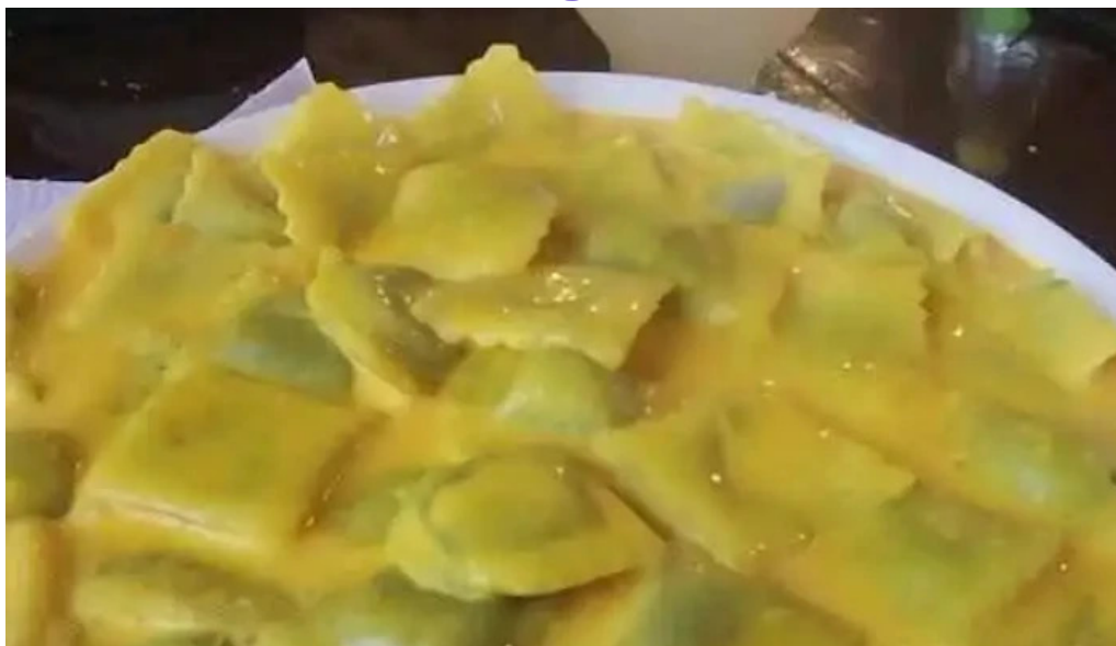
Parador maria esther videos