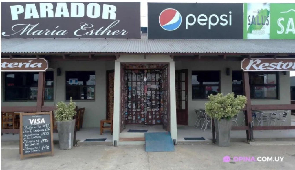
Parador maria esther rocha