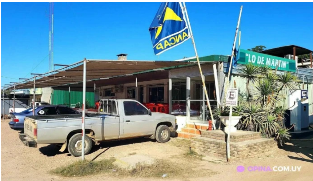
Parador lo de martin sarandi grande