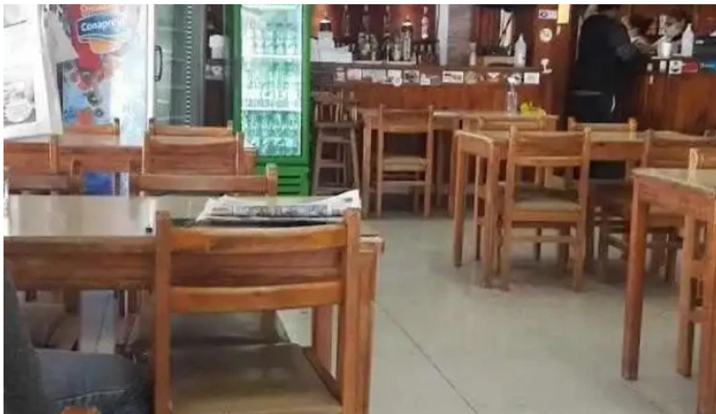
Parador lo de martin comida reconfortante