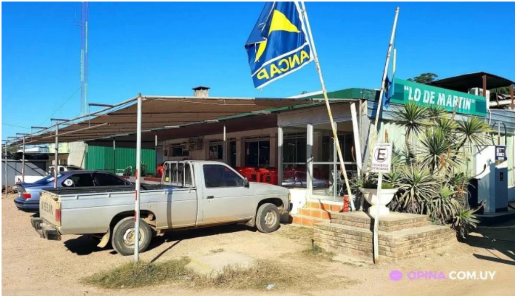
Parador lo de martin todas