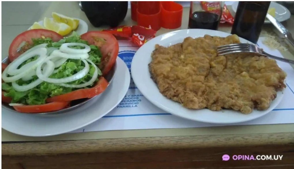
Parador lo de martin comida y bebida