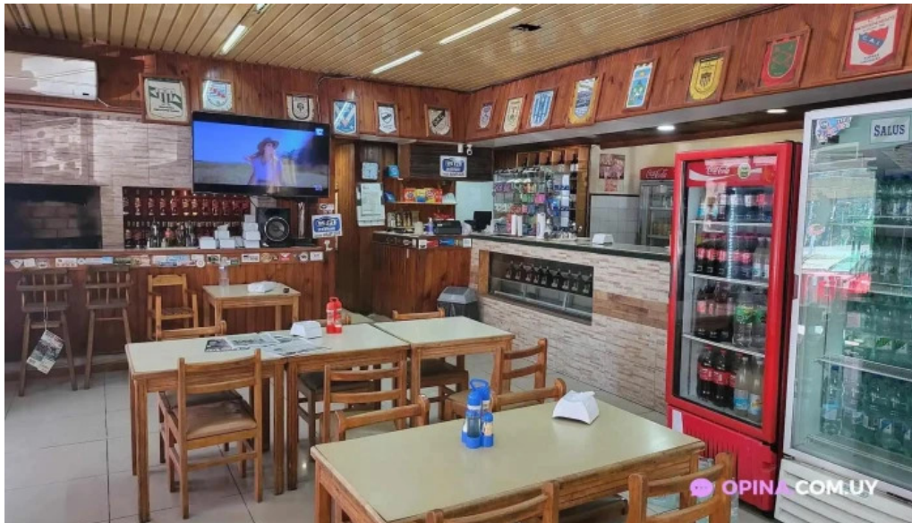
Parador lo de martin ambiente